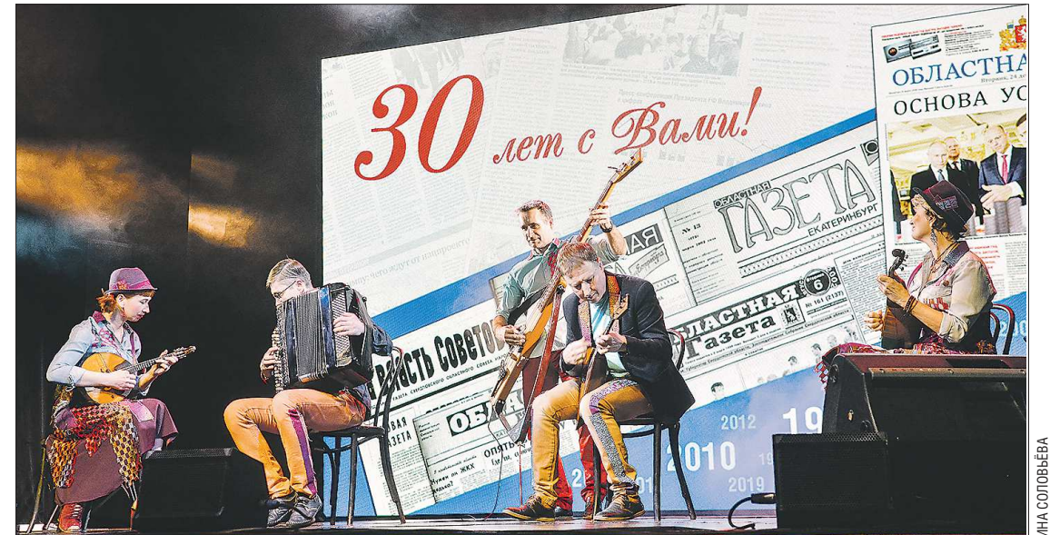
Торжественную часть открыл зажигательный ансамбль народных инструментов «Измруд»