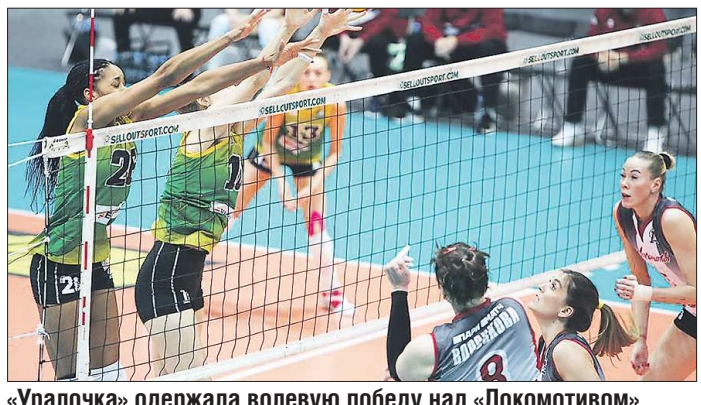
«Уралочка» одержала волевою победу над «Локомотивом»