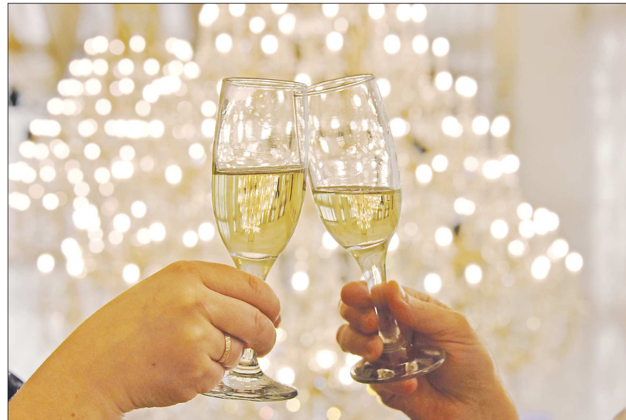
За наших читателей!