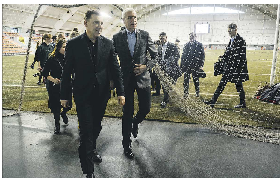
Это первый приезд в Екатеринбург Олега Матыцина (справа) после его назначения министром спорта России

В тени коронавируса и его последствий остался тема допинга, которая ещё недавно будоражила общественность. Российские спортивные власти ожидают проведения слушаний в Спортивном арбитражном суде по делу Всемирного антидопингового агентства (ВАДА) и Российского антидопингового агентства (РУСАДА) в конце мая. Такое мнение высказал Олег Матыцин на встрече со студентами Уральского федерального университета. — Сейчас в связи с коронавирусом можно будет сдвигать сроки рассмотрения в Спортивном арбитражном суде этого дела, — заявил министр спорта. — Вероятнее всего, оно будет сдвинуто на конец мая. Но все необходимые действия выполняются, и, надеюсь, как минимум мы защитим интересы спортсменов на Олимпийских играх в Токио, если они состоятся. Пока МОК не делал никаких заявлений об отмене или переносе, национальная команда России будет участвовать со всеми национальными атрибутами.