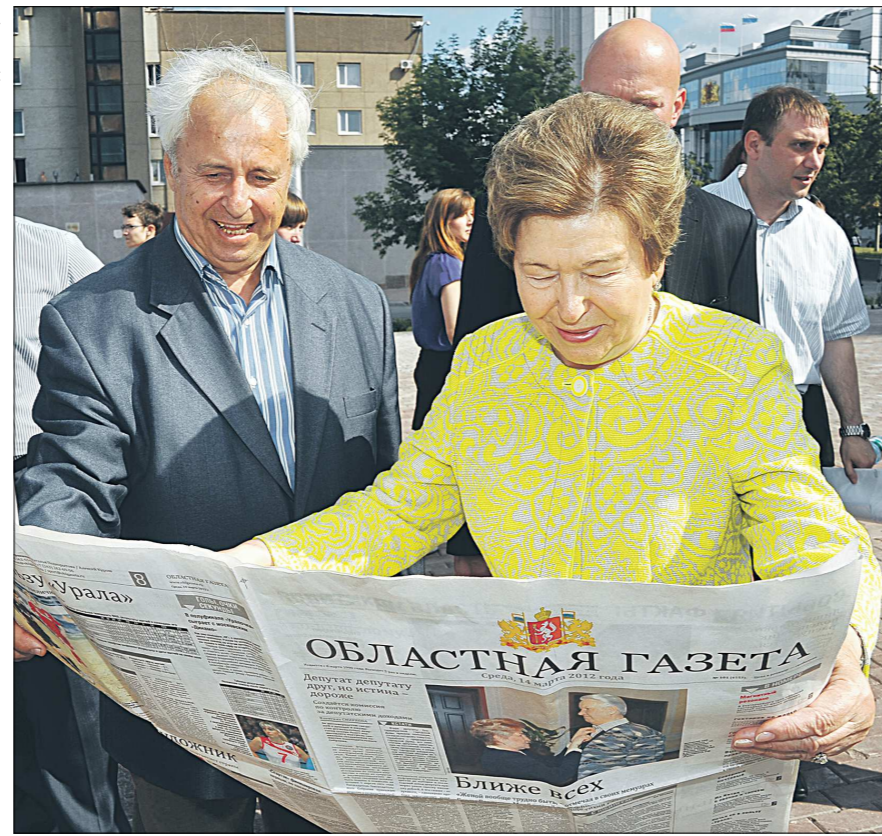
Наина Ельцина, вдова первого Президента России