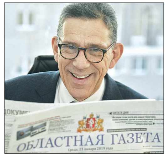
Генеральный консул Франции в Екатеринбурге Пьер-Ален Коффинье