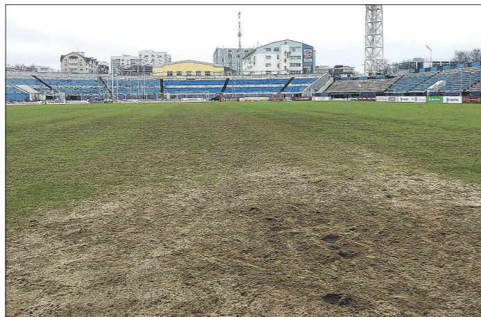
Так выглядит штрафная площадка футбольного поля стадиона в Ярославле

Российский футбол только-только вышел из зимней спячки, как уже вокруг него разгорелся очередной скандал. На этот раз дело происходило не в чемпионате страны, а в национальном Кубке, матч 1/4 финала которого должны были состояться на этой неделе.