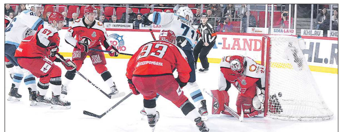
Несмотря на все старания Якуба Коваржа, новосибирцы всё же смогли поразить ворота «Автомобилиста» в обеих встречах

Под угрозой распространения коронавируса отменяются массовые мероприятия