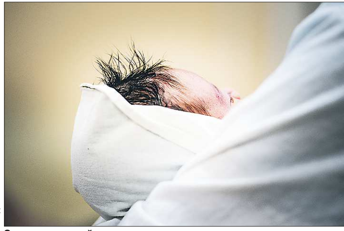
От того, как пройдут роды, зависит, сможет ли женщина снова стать мамой