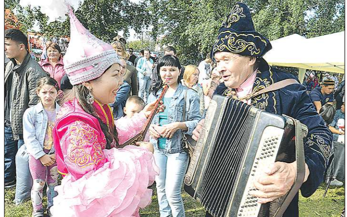
День народов Среднего Урала, ежегодно отмечаемый в Свердловской области, способствует объединению живущих в регионе народов

– Действительно, школьный праздник «15 республик – 15 сестёр» мы, родившиеся в СССР, помним с первого класса... – А сейчас этого поля для знакомства с национальностями нет. Зато очень много неправды в Интернете, нас захлестнула волна фейковых новостей про национальные традиции, которые способны только напугать. В 90-х годах начался процесс разделения народов: даже появились СМИ, которые говорят или показывают только на одном языке – без титров, без перевода на русский. Первая часть нашей Государственной национальной стратегии так и называется: «Стратегия единства российской нации и сохранения этнического многообразия». Пе-