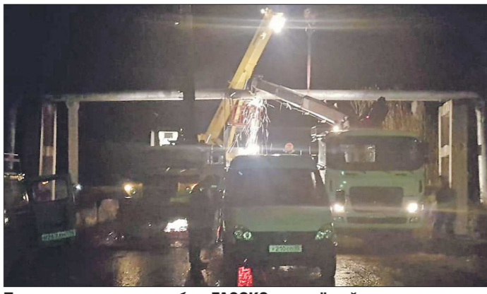
По данным пресс-службы «ГАЗЭК», гружёный лесовоз повредил газопровод расправленной стрелой. Устранение аварии заняло всю ночь

Свыше 37 тысяч североуральцев в минувшее воскресенье, 27 октября, остались без отопления и газа. В связи с этим вчера в городском округе не работали детские сады, учреждения доподготовки и лагеря дневного пребывания. Виной тому повреждение лесовозом газопровода высокого давления. На протяжении двух дней местные жители разрывали своими силами социальными сетями, обсуждая причины аварии и делясь сведениями о том, когда в их дома вернётся хотя бы горячая вода.