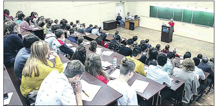
Для написания географического диктанта в УрГУ выделены четыре римские аудитории

– Но откуда такая значимость знания своего национального языка? Мы живём в России, и, может, достаточно всем владеть одним языком – русским? – Русским языком владеть, безусловно, важно, поскольку вся российская цивилизация основана на знании языка межнационального общения, которым и является русский. Однако знание родного языка – конкурентное преимущество. Сегодня в глобальном мире, когда всё унифицируется, особенно ценится и монетизируется непохожесть. Если мы утратим свою уникальность – а это подходы, взгляд на мир, система питания, проверенная веками