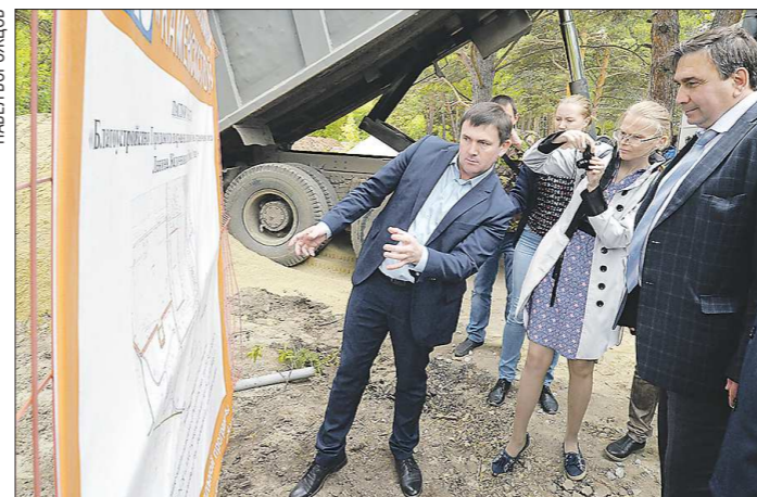
Глава Каменска-Уральского Алексей Шмыков: «Нам очень нужен второй мост через реку Исеть»