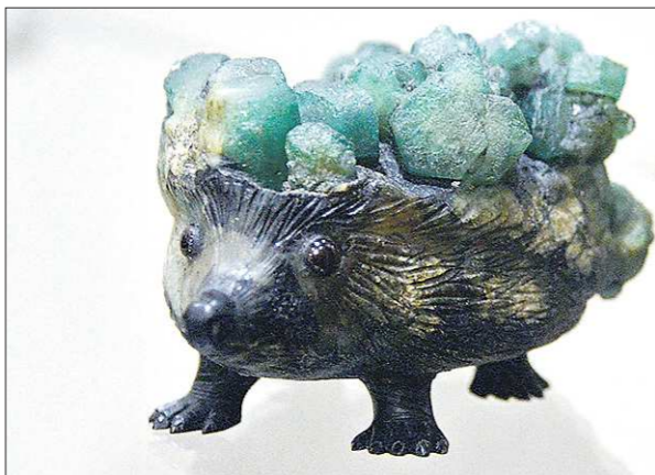
МЕТАЛЛ КАМЕНЬ ИДЕЯ 2019

Богата Россия на таланты, работающие с полезными ис-