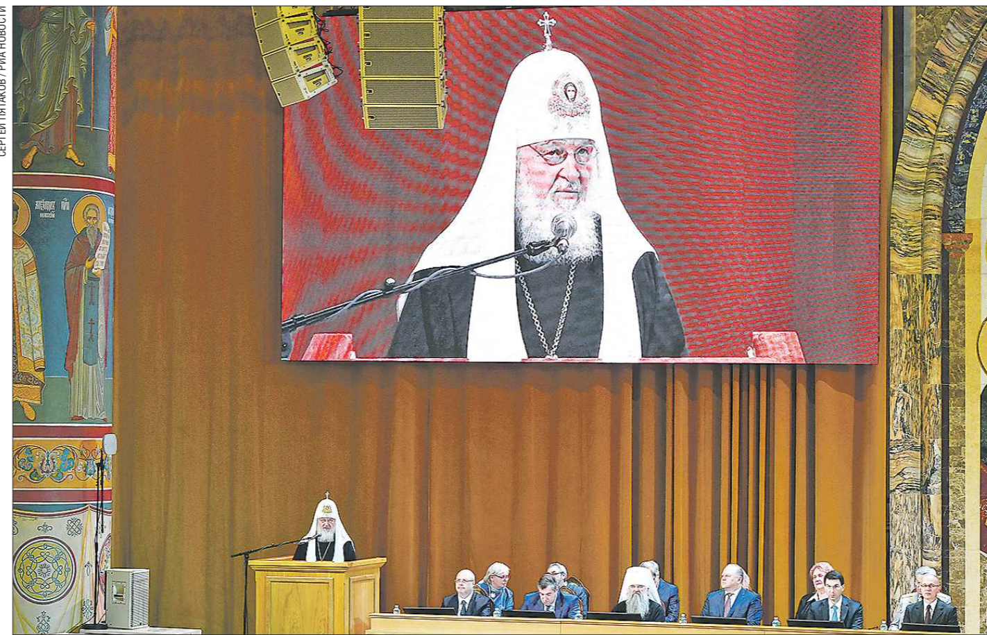
Главой Собора является Предстоятель Русской Православной Церкви

Всемирный русский народный собор предложил правительству план до 2050 года. Администрация президента поддержала