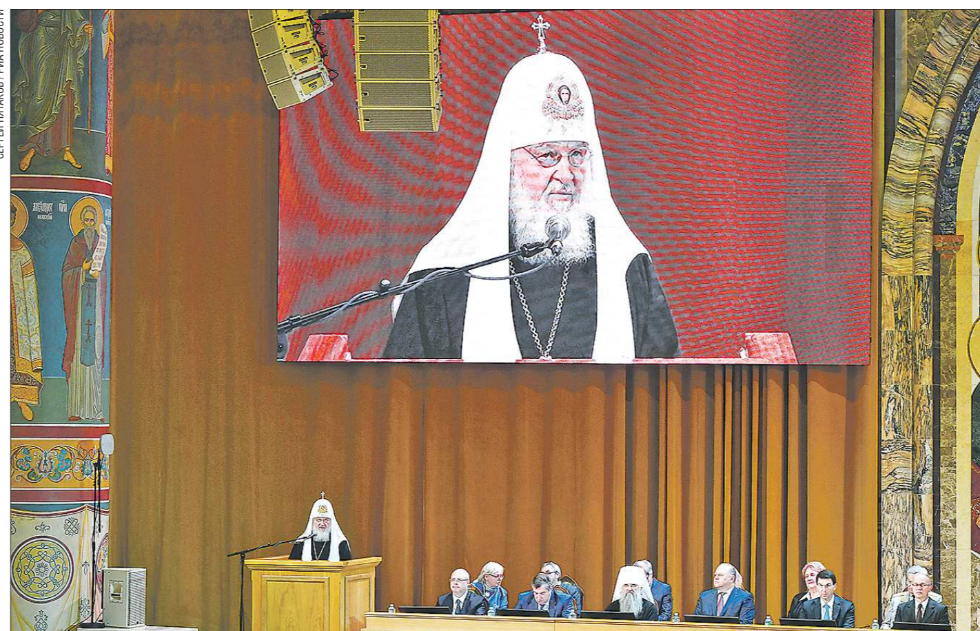
Главой Собора является Предстоятель Русской Православной Церкви

Всемирный русский народный собор предложил правительству план до 2050 года. Администрация президента поддержала