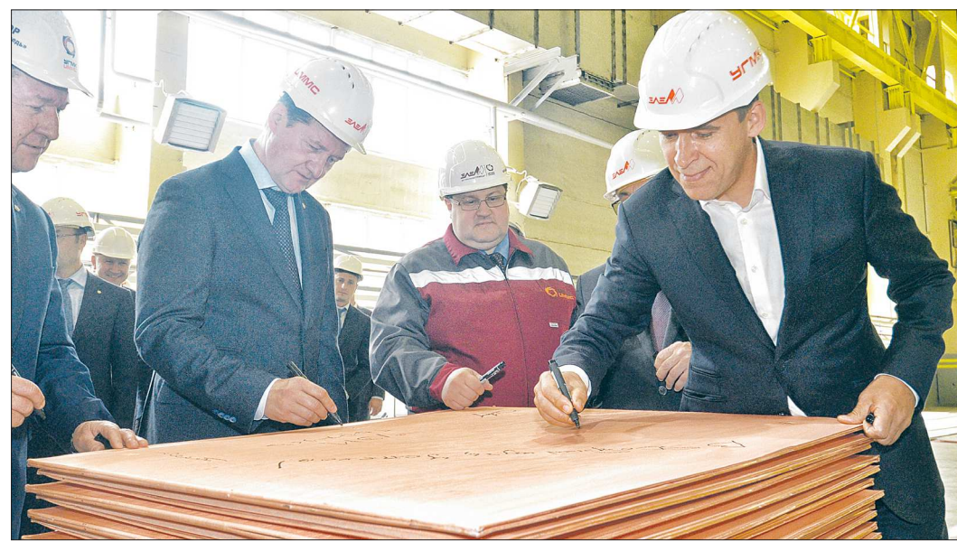
Активно идёт техническое перевооружение промышленности Урала. Глава региона – на пике второй очереди строительства нового электролизного цеха АО «Уралэлектромедь»