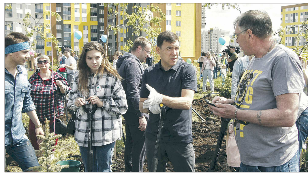
В День защиты детей (2019 г.) екатеринбуржцы вместе с губернатором Евгением Куйвашевым заложили в Академическом районе города будущий Преображенский парк