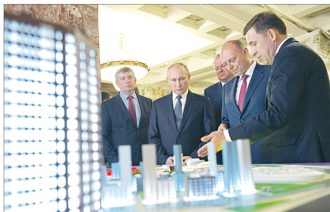
Во время Глобального саммита GMS-2019 Президенту РФ Владимиру Путину был представлен проект строительства Деревни Универсиады. После Универсиады объекты будут переданы под студенческие общежития УрФУ, учебные корпуса, медицинский, спортивный, социальные центры

А набережная Верх-Исетского пруда станет дополнительным центром развития города, объединившим административный, деловой, финансовый, культурный, спортивный потенциал.