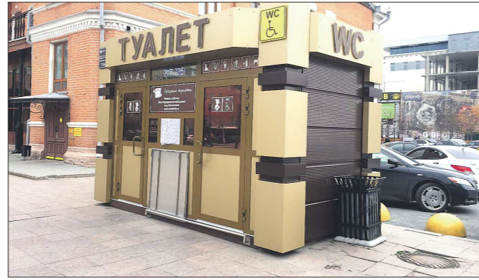
Вот такие стационарные туалеты находятся в Тюмени. Екатеринбургцы, увидевшие их, в своих постах в соцсетях нередко советуют местным властям перенять полезный опыт

Ежегодно на этот город тратит около 35 миллионов рублей, по итогам конкурсных процедур установкой и обслуживанием общественных уборных занимается частный подрядчик.