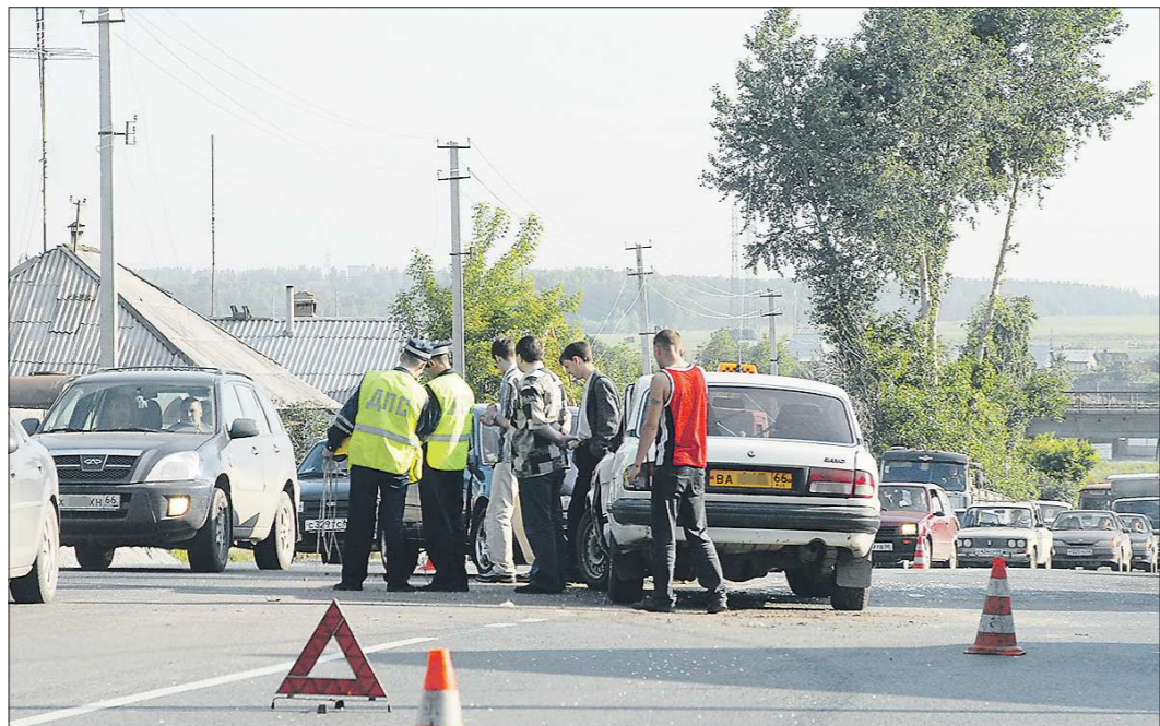
Сегодня автомошеничники предпочитают орудовать прямо на месте ДТП, чтобы не привлекать лишнее внимание страховщиков и полиции

А дальше, используя различные способы фальсификации документов, они начинают зарабатывать на завышении суммы ущерба, но больше – на нестраховых выплатах.