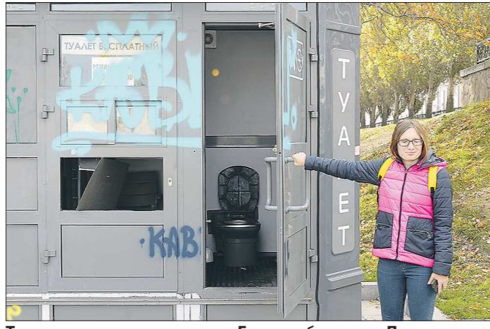
Так выглядит туалет в сердце Екатеринбурга – на Плотинке

А дальше, используя различные способы фальсификации документов, они начинают зарабатывать на завышении суммы ущерба, но больше – на нестраховых выплатах.