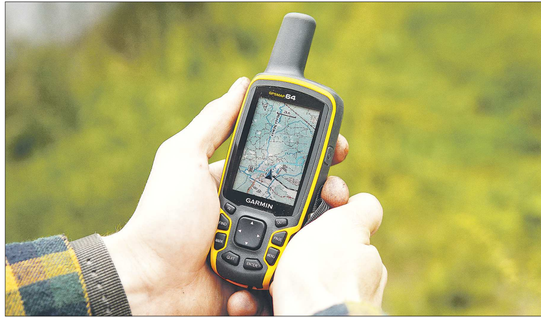
Если при ребенке есть какое-нибудь электронное устройство с GPS-навигатором, то его поиски значительно облегчаются

случаи попадают в статистику. К счастью, большую часть детей обычно находят за один-два дня. Каждым случаем пропажи ребенка занимается полиция, но если в деле есть вероятность преступления, то к расследованию подключается СК. Каждое такое дело берется на особый контроль.