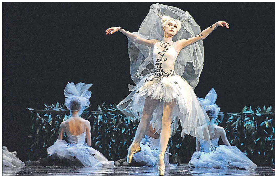
«Под небом голубым» для школьников до 11 лет.

Поверить, что кто-то захотел бы опубликовать некие списки без одобрения главы ведомства, мягко говоря, сложно. Да и вообще ситуация, когда проект уже запущен, а методики его реализации так и нет, кажется абсолютно ненормальной.