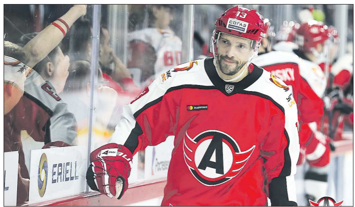
Павел Дацюк отдал первую голевую передачу в составе «Автомобилиста»