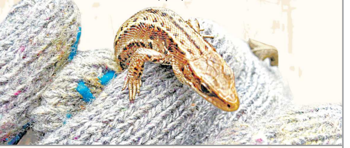
Самая распространённая на Урале ящерица – живородящая. Её размер – 15–18 см (из них 10–11 см приходится на хвост). Питается мелкими насекомыми, улитками, дождевыми червями. Особенностью вида является живорождение, в целом нехарактерное для семейства настоящих ящериц

Согласно бажовским сказам, Хозяйка Медной горы обладала способностью превращаться в ящерицу. В зависимости от настроения она могла предстать перед человеком как в виде маленькой ящерицы в короне, так и в виде жуковатого существа, сочетающего в себе черты женщины и ящерицы.