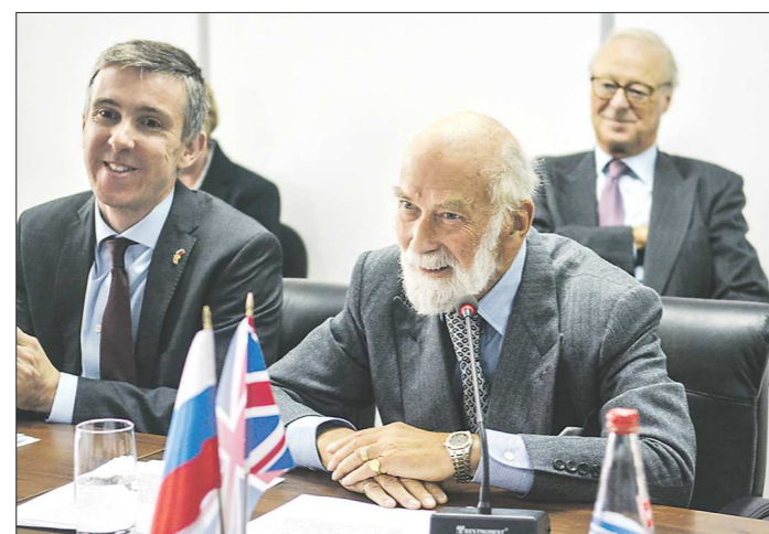
Принц Майкл Джордж Чарльз Франклин (Кентский) родился 4 июля 1942 года. Президент США Франклин Рузвельт является одним из его крёстных отцов. Принц Майкл по линии своей бабушки, великой княжны Елены Владимировны (внучка Александра II) является родственником последнего российского императора Николая II, о чём, в частности, свидетельствует его внешнее сходство с ним

Принц и его супруга часто становятся героями неоднозначных историй. И Майкл, и Мария Кристина исполняют представительские обязанности лишь выборочно. Иными словами, принц и принцесса