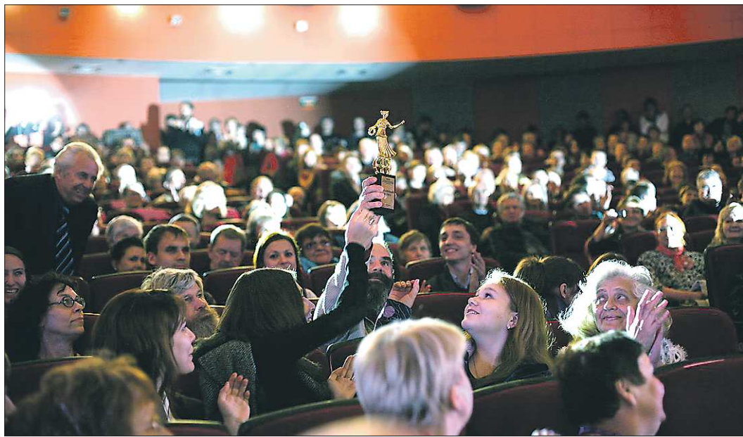
Одним из главных достоинств «России» кинематографисты считают именно зрителя. На фото многолетняя традиция — на открытии гости «заряжают» призы фестиваля своей энергией

— Начинать всегда надо с плюсов. Фестиваль традицион-