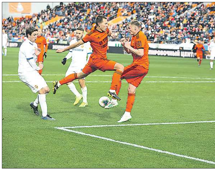
Футболисты «Урала» допускали много ошибок в обороне в матче с ЦСКА

«Урал» с 14 очками в активе занимает седьмую строчку в турнирной таблице. Но интересно, что в последние две недели екатеринбургская команда привлекает к себе внимание не результатами. Дело в том, что футбольные эксперты, а также федеральные спортивные СМИ рассматривают наставника «Урала»