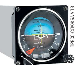
АГР-29 — один из трёх авиагоризонтов, которые представил на авиасалоне Уральский приборостроительный завод