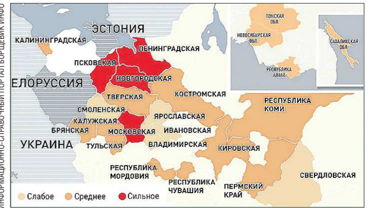
Карта распространения борщевика на территории России похожа на карту боевых действий. Средний Урал пока — в зоне слабой напряжённости

В министерстве АПК и продовольствия Свердловской области сообщили, что общая площадь произрастания борщевика Сосновского в нашем регионе составляет 144,1 гектара, в том числе площадь земель сельскохозяйственного назначения, поражённых этим сорняком, составляет 31,8 гектара. Не так уж и много, если вспомнить, что в Московской области борщевик занял 32 тысячи гектаров, а в Кировской — 10 тысяч гектаров. Учитывая серьёзность проблемы, в этих регионах была введена административная ответственность за благодушие отношение к королю сорняков. В судебной практике есть не-