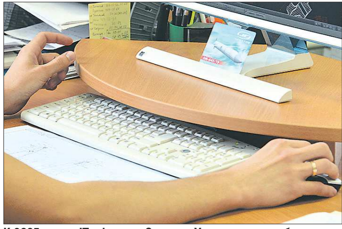
К 2035 году в IT-сфере на Среднем Урале должно работать около 34 тысяч человек