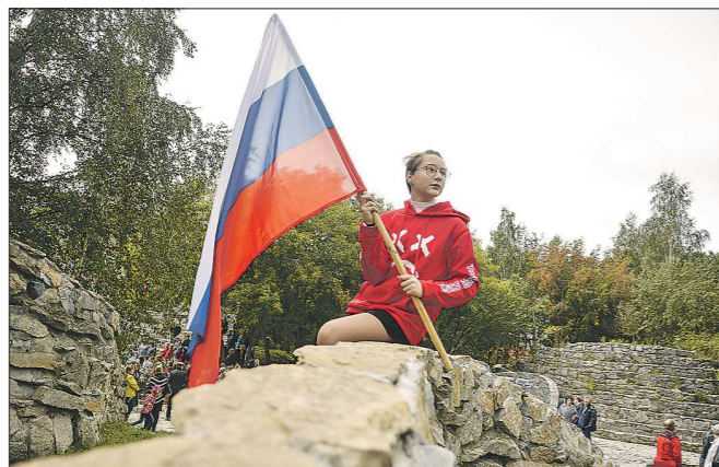
Новое место отдыха облюбовала молодёжь

Вчера в Екатеринбурге открылся обновлённый сквер Первых строителей МЖК. За несколько десятилетий он пришёл в запустение. Теперь, после реконструкции, жителям микрорайона ЖБИ могут позавидовать и в других внутригородских районах.