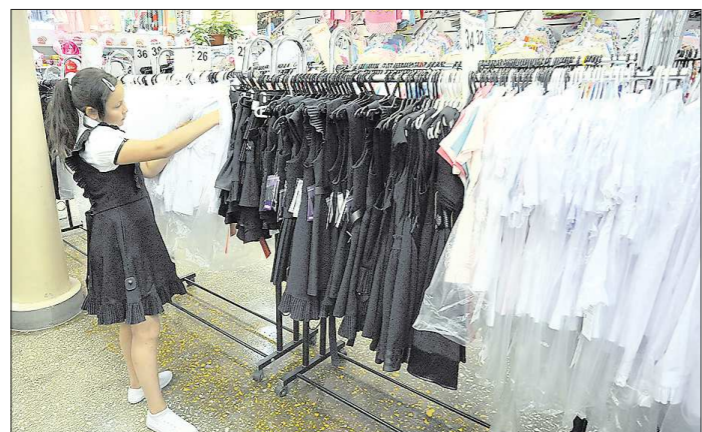
Школьный сарафан в магазинах Свердловской области обойдётся в 700-800 рублей, брюки — в 1 000-1 200 рублей, юбка — в 500-700 рублей, блузки и рубашки — от 300 рублей

К сожалению, проверки школьной формы, которая реализуется в магазинах, показывают плохие результаты. Санитарные врачи уверяют: до половины всех магазинов грешат обманом покупателей. Пишут на бирках, что ткань состоит из хлопка, но по факту в составе оказывается полиэстер. Специалисты говорят, этот материал — то же самое, что полиэтил. Беда синтетических материа-