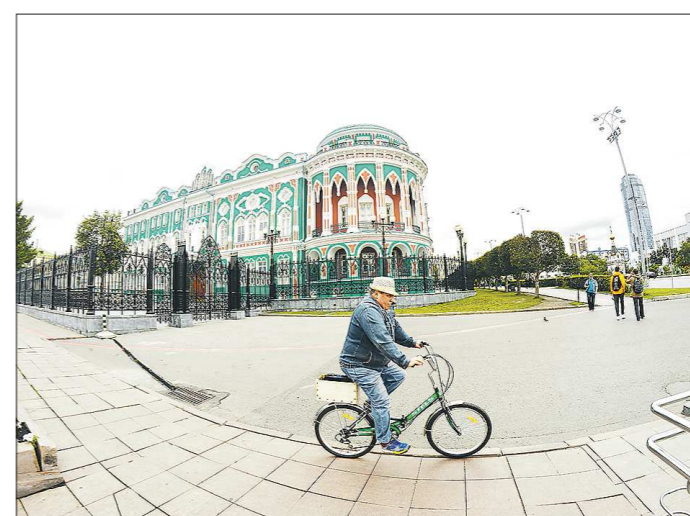
При расчёте индекса будет также учитываться и уровень внешнего оформления городского пространства

Правительство Свердловской области распорядилось организовать в регионе сбор информации для расчёта индекса качества городской среды в муниципалитетах (соответствующий документ был опубликован вчера на портале правовой информации области www.pravo.gov66.ru ). Зачем нужен этот индекс и что он даст муниципальным образованиям, рассказала «Облгазета».