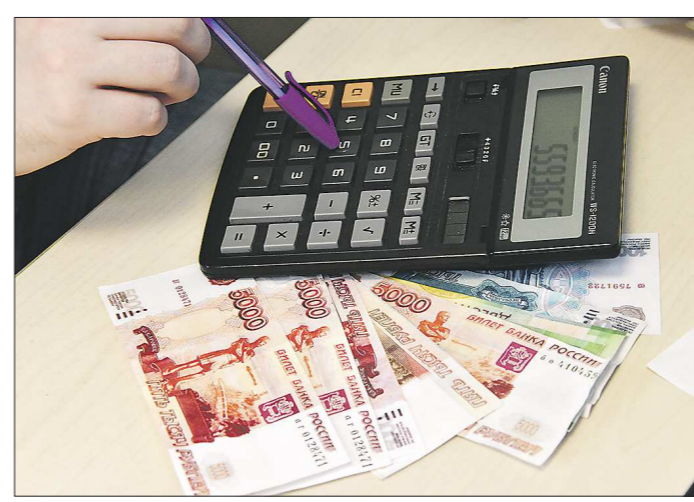
Одним из факторов снижения уровня просроченных платежей стал рост финансовой грамотности россиян

С 1 октября для россиян вводятся ограничения по выдаче потребительских кредитов: банки будут отказывать в кредитовании, если показатель долговой нагрузки заёмщика (то есть отношение ежемесячных выплат по займам к месячному доходу) слишком высок. Мера должна уберечь россиян от непосильных займов. Между тем и на Среднем Урале количество выданных потребительских кредитов растёт.