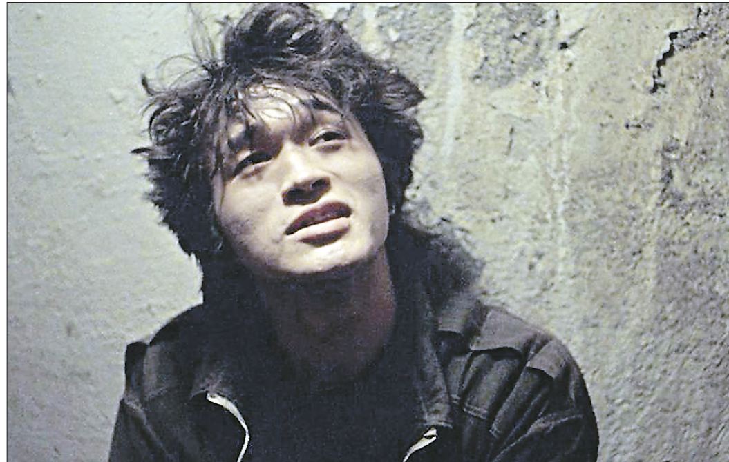
Картина уже была в производстве, когда киностудия «Казахфильм» сменила предыдущего режиссёра на Нугманова. Он согласился снять фильм при условии, что главную роль исполнит Виктор Цой

Этот приём позволил добиться невероятной естественности. Пересмотрите «Иглу». На свежий взгляд вам покажется, что картина документальная. Это, по сути, рассказ о людях и времени, зафиксированный на плёнке, заснятый, привлечённый разными эффектами и песнями «Кино». Рашид Нугманов сознательно спрятал некоторые важные детали в подтекст, и получился классический пример того явления, которое через пару лет Александр Житинский довольно точно назовет «областью чистого кайфа», когда самое важное — это едва