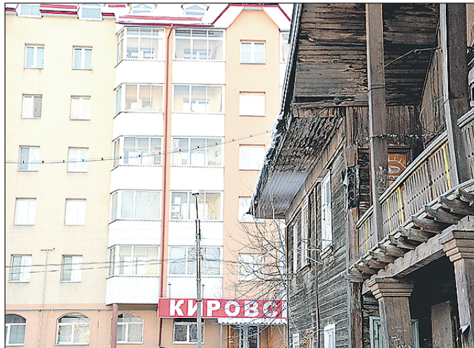
Ключевая задача напроката «Жильё и городская среда» – улучшение жилищных условий россиян

Повышенное внимание заказчика требует в связи с переходом строительного комплекса на проектное финансирование – то есть от-