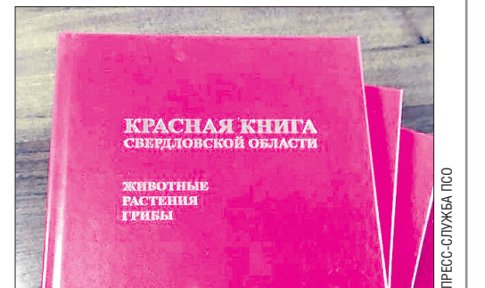
Красная книга Свердловской области издается в регионе с 1996 года

В новую редакцию Красной книги вошли 109 видов животных, из них 11 видов млекопитающих, 45 видов птиц, 2 вида рептилий, 4 вида амфи-