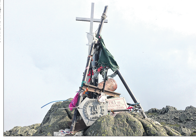
На вершине Конжака туристы оставляют разные вещи в память о восхождении на гору. Здесь лежат металлические таблички, старый огнетушитель и другие предметы

Несмотря на большой турпоток, проблем с экологией в этих местах нет. Рекреационная нагрузка на Конжаке в разы ниже, чем на популярных уральских курортах, например, горе Белой под Нижним Тагилом. Дунитовый карьер тоже не влияет на состояние окружающей среды: добыча этого минерала не представляет опасности для природы, в отличие от медных или