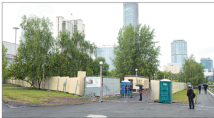
Сквер на набережной Екатеринбурга, где по требованию общественности отменили строительство храма