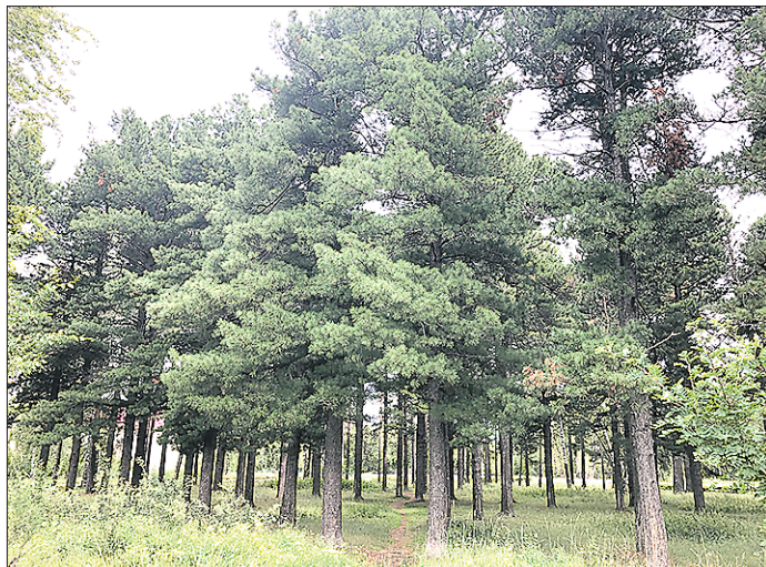
Этой кедровой роще на окраине Карпинска более 200 лет

«Они были посажены на окраине посёлка Богословского медеплавильного завода более 200 лет назад, — написал пенсионер. — В то время вдоль дороги, идущей в Турьинские медные рудники (теперь это город Красно-