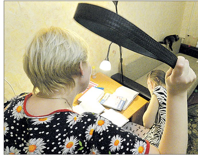
По данным Следственного комитета РФ по Свердловской области, в регионе за год регистрируется примерно 80 случаев жестокого обращения с детьми, когда против агрессоров заводят уголовные дела

По мнению участников общественных слушаний, это административное наказание следовало бы ужесточить. Речь не идёт об увеличении суммы штрафа, но срок заключения стоит увеличить с 15 суток до 30, точно так же в два раза увеличить и продолжительность обществен-