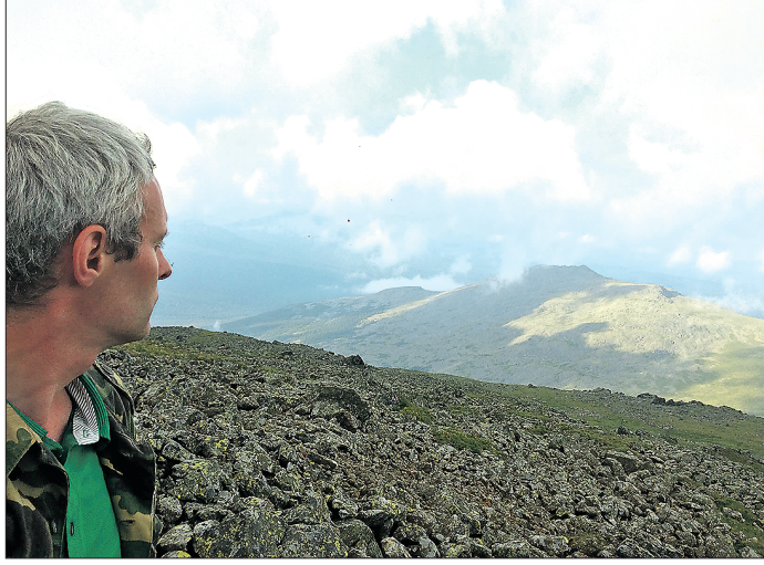
С Конжаковского Камня открывается вид на гряды Уральских гор, тянущуюся далеко на север до Карского моря

Хотя по сравнению с Южным Уралом здесь их немного. Даёт о себе знать удалённость от Екатеринбурга: до Конжака от него 475 километров. Но живописные ландшафты, чистый горный воздух и душистые альпийские луга всё равно притягива-