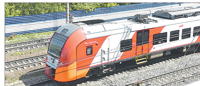
«Ласточки» курсируют между Каменском-Уральским и Екатеринбургом с 2015 года