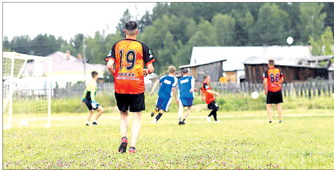
Вместо протеста лобвинцы вышли на поле, приговорённое к застройке, на товарищеский матч: молодёжная сборная выиграла у ветеранов со счётом 5:2

Этим летом жители Лобвы (Новолялинский ГО) узнали, что территорию поселкового стадиона отдали под индивидуальное строительство. Шумные митинги лобвинцы устраивать не стали, а в качестве протеста провели на приговорённом поле товарищеский матч между двумя местными футбольными командами: молодёжной и ветеранской. Кроме того, защитники стадиона обратились за помощью к кандидатам в депутаты Госдумы. В итоге стадион остался на своём месте.