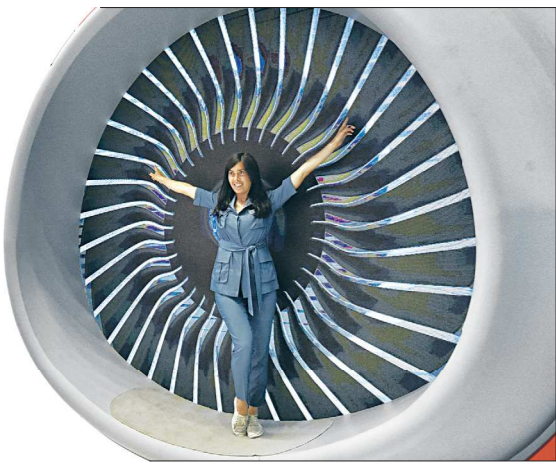
На стенде «Уральских авиалиний» можно было сделать необычное фото и с помощью специального терминала переслать его себе на электронную почту