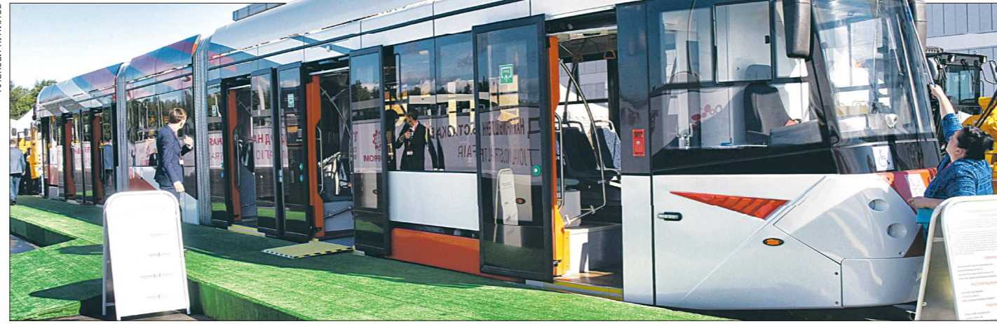
Уралтрансмаш представил на выставке низкопольный трёхсекционный вагон 71-418, предназначенный для людей с ограниченными возможностями здоровья и пассажиров с детьми