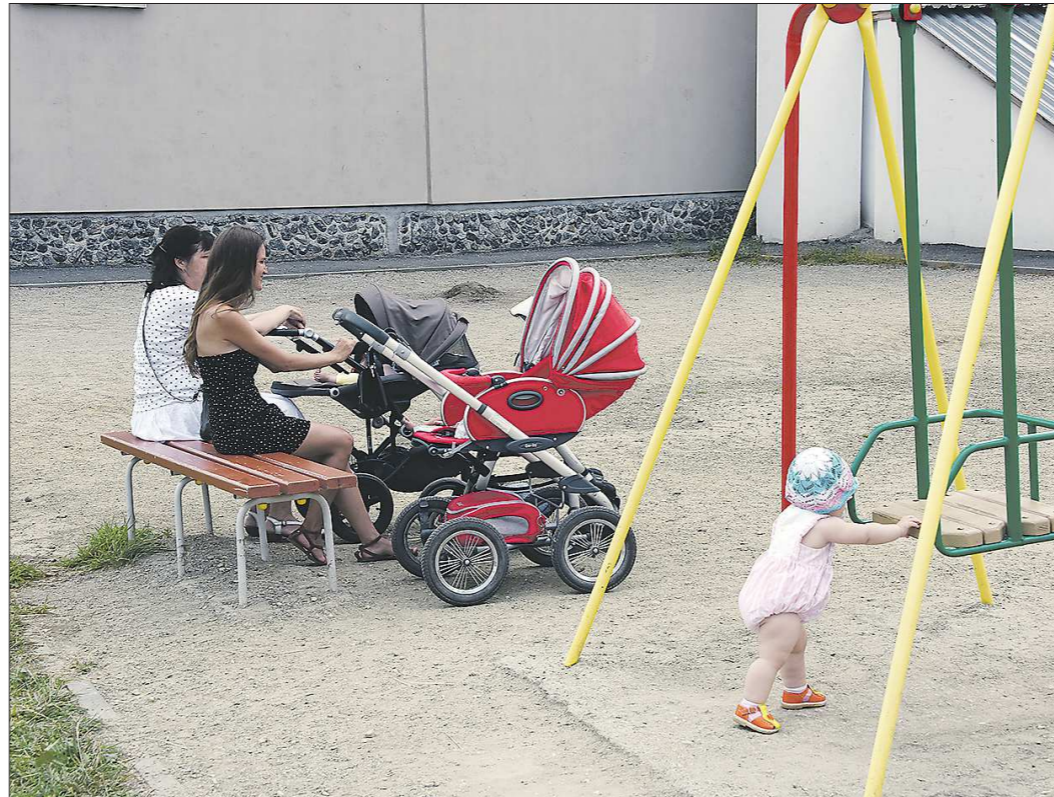
Возможность посещать ясли детям от 2 месяцев до 3 лет, в соответствии с майским указом Президента РФ, позволит мамам выходить на работу раньше. Это отразится на уровне доходов российских семей, а может быть, и на рождаемости

— Мой третий ребёнок получил место в группе для 2-летних детей ещё до своего второго дня рождения, — рассказывает многодетная мама