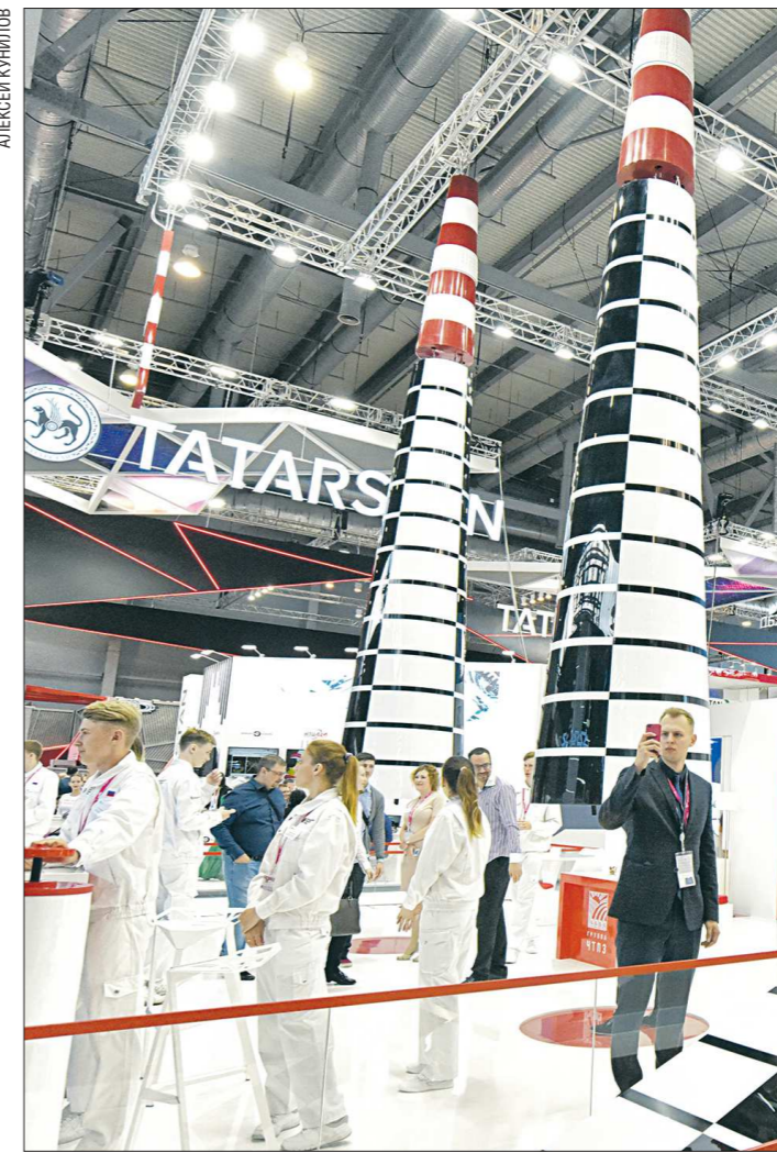
Стенд ЧТПЗ в этом году граничил со стендом Республики Татарстан. Гостей выставки сюда зазывали большие ростовые куклы в виде труб, которые гуляли по павильонам в течение дня

14 национальных стендов разных государств было представлено на выставке в этом году – это вдвое больше, чем в 2018-м. Впервые на ИННОПРОМе свои предприятия представили Австрия и Франция