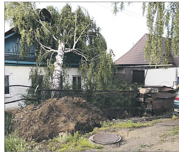
Ураганный ветер вырвал деревья с корнем, и они падали на дома

Из-за порывов на линии без электричества остались жители 274 домов, в 28 домовладений прекратили подачу газа. Специалисты ресурсоснабжающих организаций работали на пострадавших от стихии линиях до поздней ночи. За двое суток электроснабжение восстановлено, на время сдачи номера в печать работы аварийных бригад на газовых