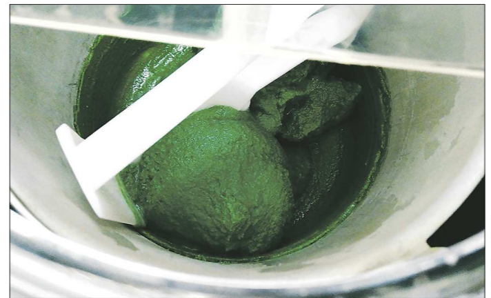
Спорулина добавляется в мороженое во время его изготовления вместе с другими сухими компонентами

Тогда девушке пришла идея взять за основу обычный ГОСТовский пломбир, но в нём в молоко добавили фермент, расщепляющий лактозу, а сухое молоко заменить на... спорулину. Эта полезная сине-зелёная водоросль, появившаяся на Земле более миллиона лет назад, стала известна в последние годы благодаря диетологам и рекламе блогеров. Однако это не пустая раскрутка. Научно доказано, что употребление спорулины в пищу очищает кровь от токсинов, норма-