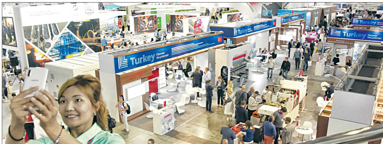
Масштаб выставочных площадей МВЦ Екатеринбург-ЭКСПО – около 50 тысяч квадратных метров. Не менее трёх тысяч из них заняла экспозиция Турции – страны-партнёра ИННОПРОМА