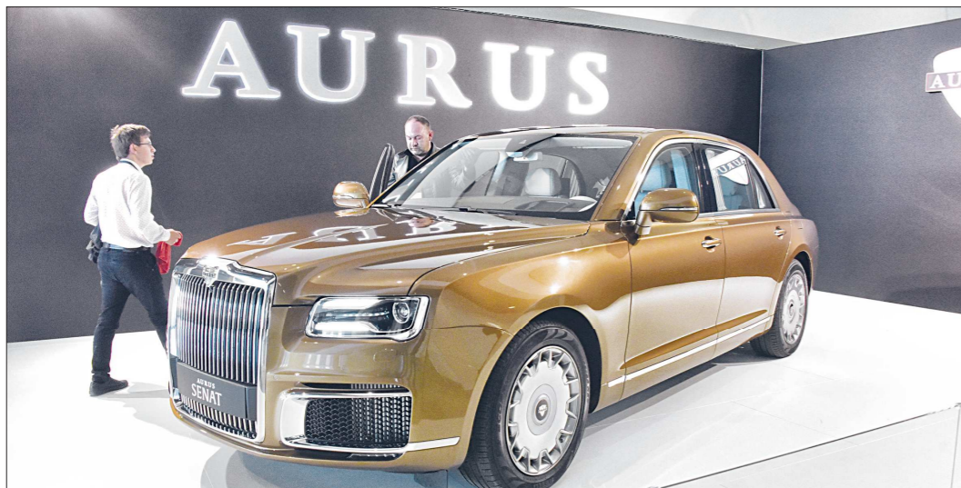
На полях выставки представили лимузин Aurus Senat. Аналогичным пользуется Президент РФ Владимир Путин

Более 600 высокотехнологичных компаний представили на выставке свои новинки