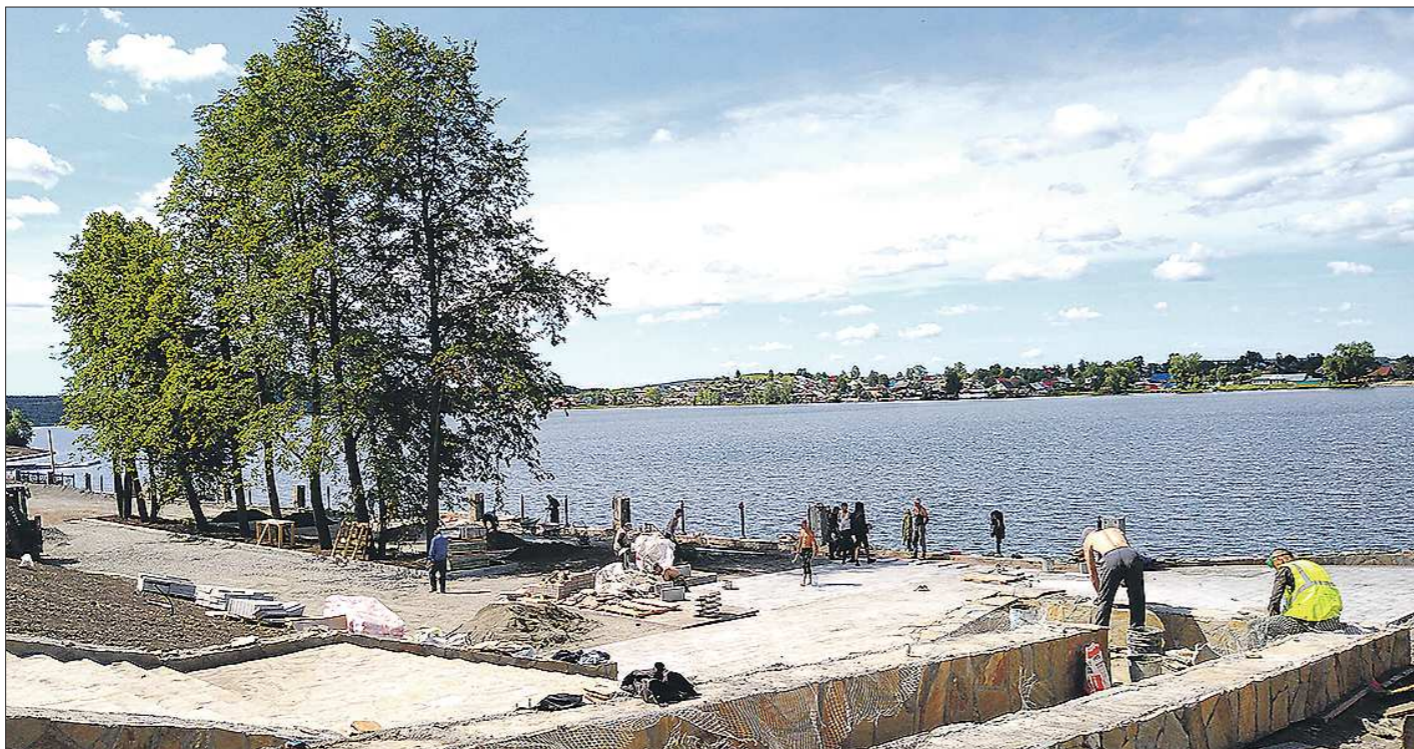
На одном из участков набережной подрядчики уже укладывают тротуарную плитку

ООО «ТУРА-ЛЕС» работает на территории городского округа с 1998 года. В качестве резидента ТОР предприятие планирует реализовать инвестиционный проект «Создание производства по комплексной переработке древесины с собственным циклом лесозаготовки». ООО «Синергия» только начинает свою деятельность и предла-