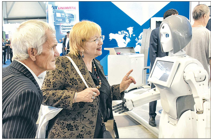
Ни один робот на полях выставки не остался без внимания. Такие экспонаты в диковинку для посетителей всех возрастов