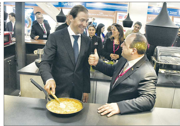
На открытии стенда Турции министр промышленности и технологий Республики Муштафа Варанк (справа) предложил своему российскому коллеге Денису Мантурову отведать национальные блюда