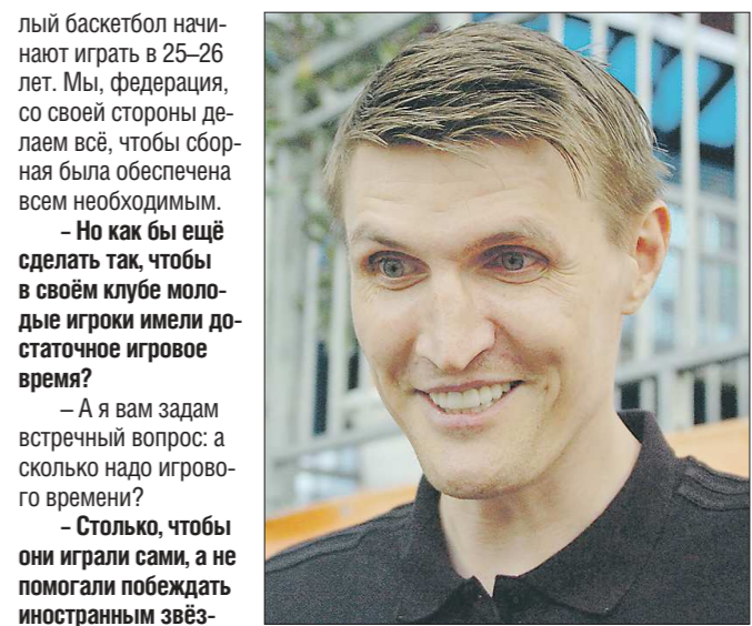
Оптимизму президента РФБ Андрея Кирилленко можно только позавидовать

– Не могу не спросить про женский баскетбол. Вы действительно считаете, что никакие серьёзные изменения там не нужны? – Есть данность, которую невозможно исправить одним изменением. Вы же видите, что в сборной сейчас очень большой разрыв. Есть игроки 30 лет и старше, а есть 23 и младше. Суперпоколение, девочки, которые два года назад победили на чемпионате мира до 19 лет. Да, нам очень хочется, чтобы они уже сейчас выстрелили, но это невозможно. Во взрос-