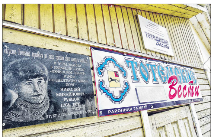
«Я буду долго гнать велосипед. В глухих лугах его останавлю». Автор этих стихов Николай Рубцов останавливался и здесь, в редакции местной газеты

Олег КУВШИННИКОВ возглавил Вологодскую область в конце 2011 года. Тогда ему было 46 лет, за плечами – солидный стаж работы в крупной промышленной корпорации «Северсталь» и четырёхлетний опыт работы на должности мэра Череповца. Регион занимает один процент территории России. Население – около 1,2 миллиона человек, из которых более 97 процентов – русские