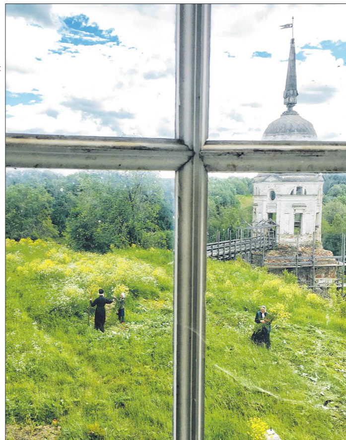
На Пятидесятницу монахи Спасо-Суморина монастыря в Тотме украшают свой храм цветами. Сейчас в этом городе нет купеческого богатства, но огромное количество шедевров архитектуры Русского Севера

– Ещё в 2012 году я, понимая, что обратная связь чрезвычайно важна, запустил систему онлайн-приёмной губернатора, которая в круглосуточном режиме реагирует на обращения граждан, поступающие из самых разных источников: через Интернет, блогосферу, по телефону горячей линии, из аккаунтов в социальных сетях. В год поступает от 12 до 15 тысяч обращений. Мы ввели регламент ответа на вопросы в срок не более трёх дней. Не тридцать, как предусматривал закон, а три дня. Многие вопросы получают ответы в первые сутки. В каждом органе власти есть ответственные за быстрое реагиро-