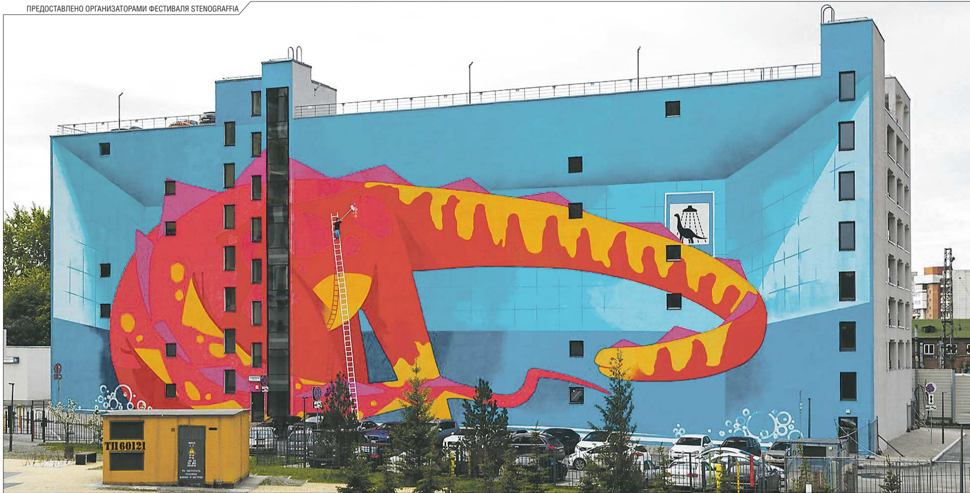
Стена площадью более тысячи квадратных метров кому-то может показаться огромной, но только не динозавру, который решил принять душ