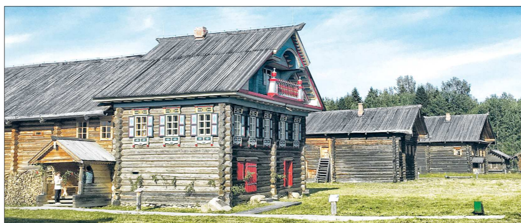
Как и в Свердловской области в Нижней Синячихе, у вологодцев есть музей деревянного зодчества «Семеново». Здесь можно не только заказать экскурсию, но и сбить и продегустировать масло, а также принять участие в народном спектакле

Чтобы поднять пашню, теперь мало вспахать целину. Прежде нужно вспахать информационное поле и привлечь людей на заброшенные земли. Поэтому одной из ключевых задач при запуске проекта «Вологодский гектар» стала разработка электронной карты, где любой желающий мог бы посмотреть в Интернете свободные участки и оформить заявку. 3300 гектаров во-