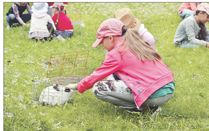
В прошлом году в число победителей конкурса попал проект тактильного зоопарка на Станции юннатов в Асбесте. Теперь в городе – свой тактильный зоопарк!

География проектов широка: благоустройство парков Победы в селе Костино и в селе Голубковском, сквер «Музейный» в селе Деево, детские площадки в селе Толмачёво и посёлке Самоцвет, два проекта по дополнительному обра-