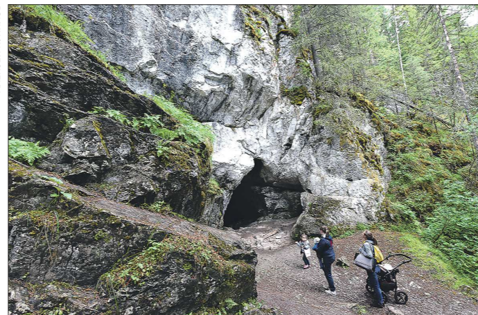
Туристы со всей России посещают «Оленьи ручьи» и в будни, и в дождь. Эта семья приехала в парк из Тюмени