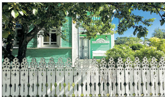
«Дом, где родился палисад» – не только строчка из советского хита «Песняры». Он действительно существует в Вологде, как и сотни других домов с палисадами

стве, происходит и в медицине региона – появляется техника, строятся ФАПы, но нет специально обученных людей: