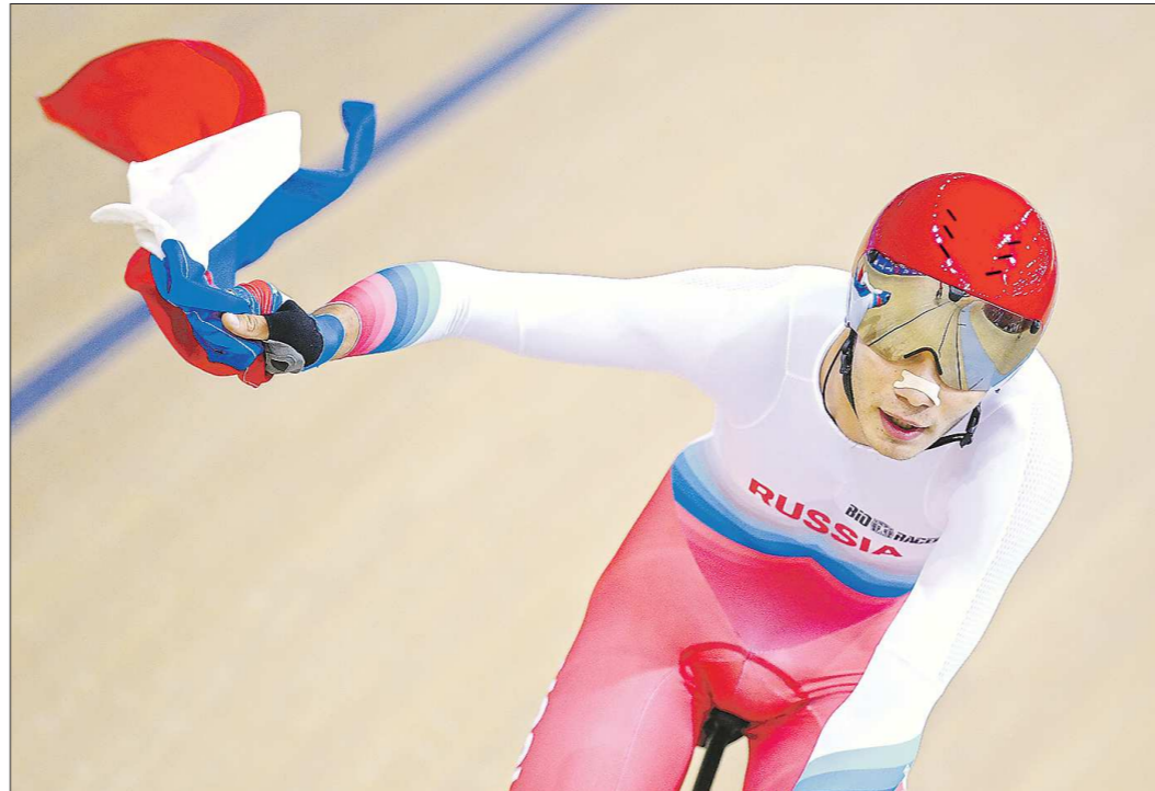
Победный финиш на Европейских играх. Конечно, с флагом — по всем традициям трека