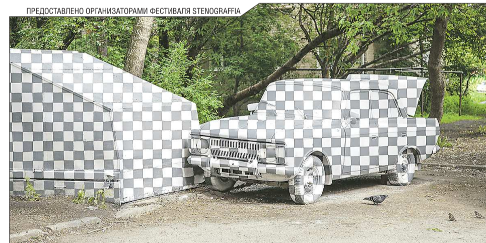
Заброшенная машина, о которой хозяин и думать забыл, в российских дворах – не редкость. При помощи уличных художников «удалили» бесхозный автомобиль