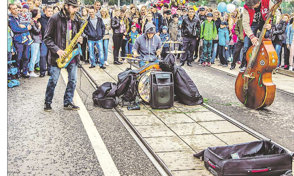
Музыканты не ставят перед собой цели много заработать на уличных выступлениях, но они отмечают, что если публике нравятся песни – им дают деньги

лиция, то разбирается она с попрошайками, а музыкантов не трогает. Вторая беда, по словам саксофониста – маргинальные личности, люди без определённого места жительства, алкоголики, которые портят атмосферу выступлений и начинают требовать деньги от окружающих. Саксофонист вспоминает, что однажды хулиганы забрали у него из чехла всё заработанное и убежали, это научило музыканта бдительнее следить за вещами.