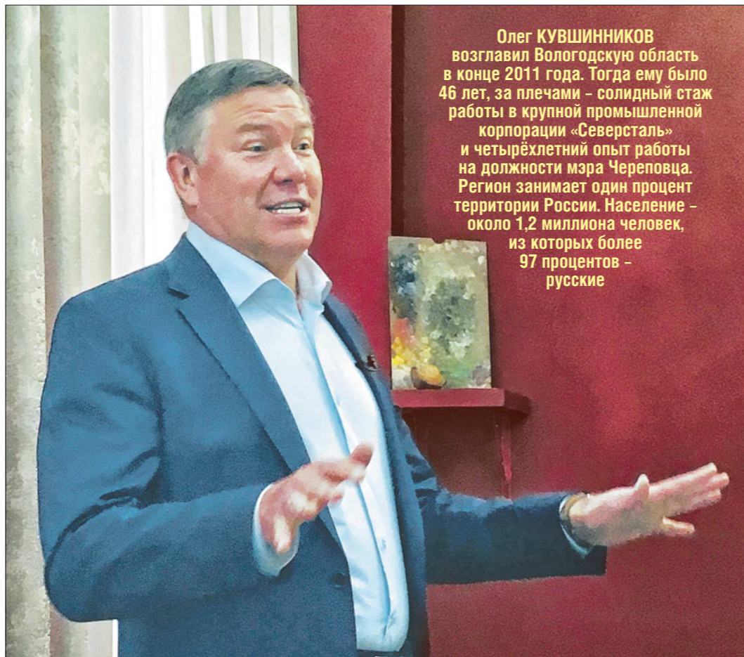
Губернатор Вологодской области Олег Кувшинников отработал на своём посту уже два срока, но получил одобрение в Кремле и снова идёт на выборы

Как потратить заработанное Благополучно, по словам губернатора, миновав кризис, Вологодская область создала невиданный там доселе бюджет развития – 50 мил-