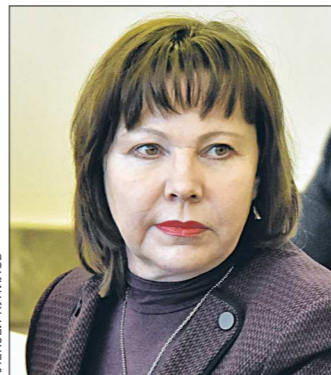
Галина КУЛАЧЕНКО Заместитель губернатора — министр финансов