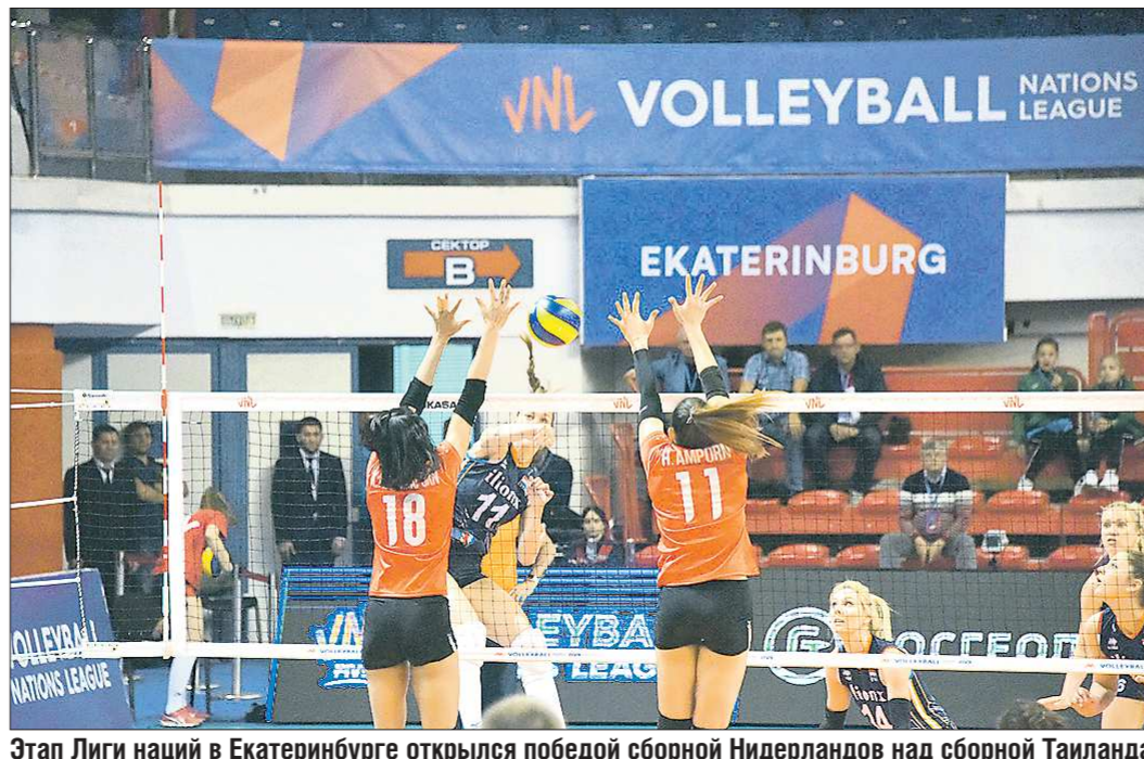
Этап Лиги наций в Екатеринбурге открылся победой сборной Нидерландов над сборной Таиланда

Я частично доволен ее игрой, - рассказал журналистам тренер сборной. - Однако выступать с травмой очень сложно. На первых