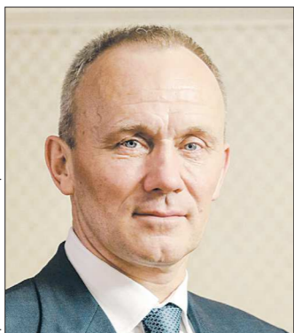
Олег ЧЕМЕЗОВ Заместитель губернатора