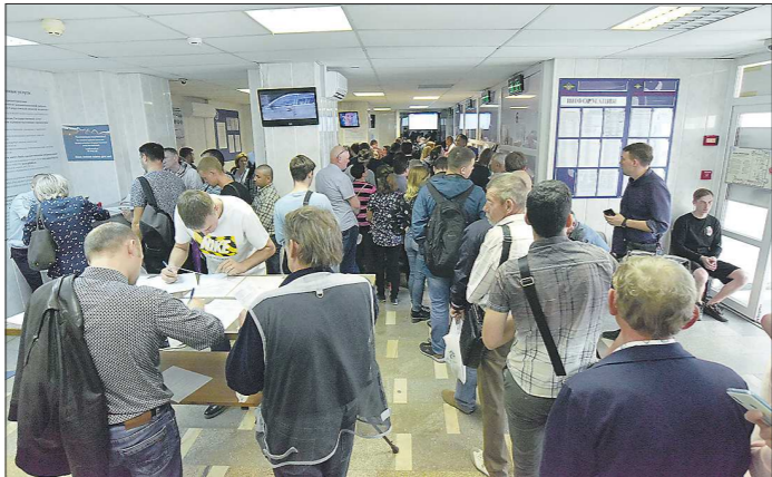
Так выглядит живая очередь в РЭО ГИБДД в Екатеринбурге

– В этом году проходит очередная массовая замена водительских прав. Первая была в 1999 году, когда меняли права советского образца с отметкой SU на единые российские национальные с отметкой RUS и переходили на пластик. А поскольку права выдаются на 10 лет, следующая их замена была в 2009 году, а теперь в этом году. Хотя права можно поменять и досрочно, но в нашем менталитете заложено всё делать в последний день, отсюда и огромные очереди, – пояснил «Облазеты» начальник меж-