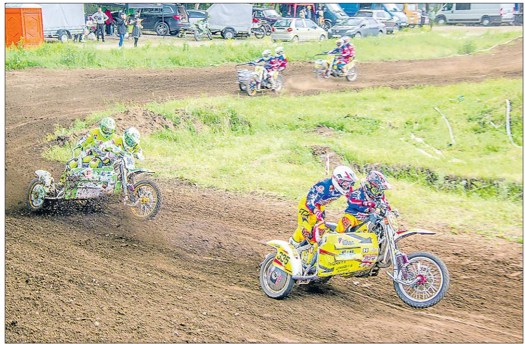
Борьба за медали между свердловскими экипажами велась до финиша