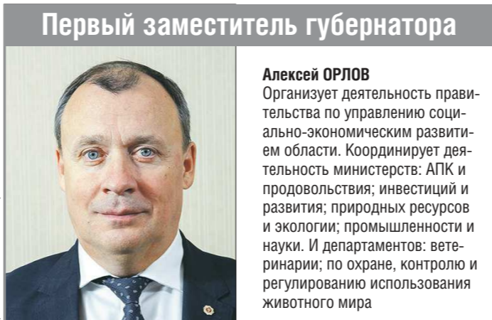
Первый заместитель губернатора

Организует деятельность губернатора и правительства Свердловской области в сфере внутренней и информационной политики. Координирует деятельность управленческих округов области и департаментов: внутренней политики; информационной политики; по местному самоуправлению