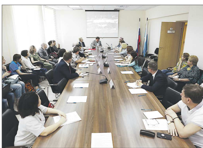
Мы знаем, город будет. А вот каким – зависит от каждого из нас

Повестка заседания Общественной палаты Свердловской области звучала так: «О недостатках сложившейся практики проведения общественных обсуждений и публичных слушаний по вопросам архитектуры и градостроительства».