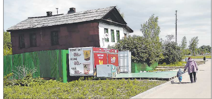
На днях возле дома появился киоск предприниматель объяснил, что арендовал эту землю. На продавца составлен административный протокол за торговлю в не отведённых для этого местах

Парк «Народный» в марте прошлого года стал лидером голосования за комфортную городскую среду в Нижнем Тагиле. Сегодня благоустроенная территория на берегу реки Тагил – это популярное место отдыха.