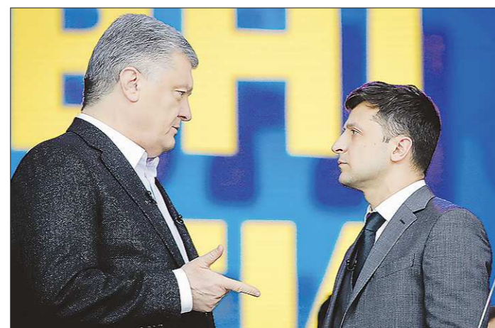
19 апреля Пётр Порошенко и Владимир Зеленский встретились на предвыборных дебатах на стадионе «Олимпийский»

Говорил «гарант» и о борьбе с коррупцией, предлагая следовать примеру Евросоюза: – По примеру наших соседей в Европейском союзе антикоррупционные органы искореняют коррупцию на самом высоком уровне. В 2014 году Порошенко