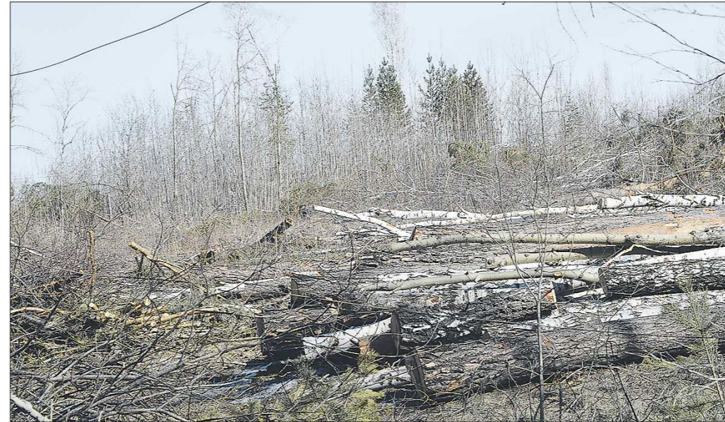
В прошлом году в лесах под Первоуральском было незаконно вырублено более десяти тысяч кубометров древесины — это четверть от всего объёма незаконных рубок в нашем регионе