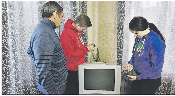
Перестроить старые телевизоры на цифровое телевидение в Свердловской области помогают более 1 200 волонтеров