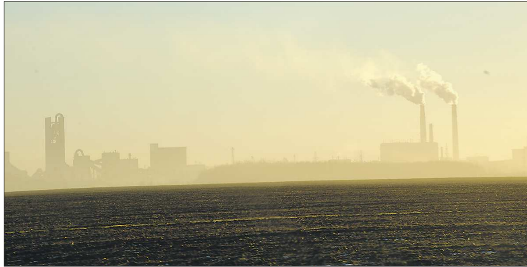
В прошлом году смог над городами области держался около ста дней