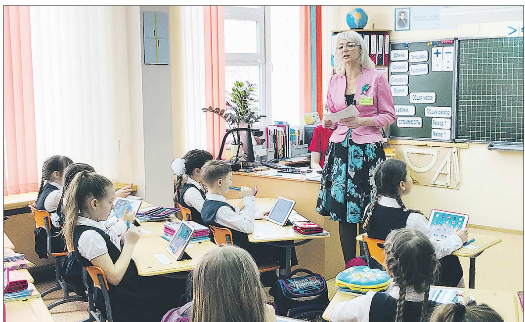
Сегодня учителя стараются строить уроки так, чтобы находить индивидуальный подход к каждому ученику

Пожалуй, несколько успешных родителей в Екатеринбурге может лишь сравнение с тем, как организован летний детский отдых в других регионах России. Так, в столице Чувашии — Чебоксарах — мамы и папы по старинке в ночь на 30 марта ночевали перед муниципальными центрами, дежуря в очереди для записи в лагерь. Жители Тюмени и вовсе должны вначале за свой счёт купить путёвку в лагерь, а потом только получить на счёт частичную компенсацию. В Сыктывкаре родители подают заявления на Госуслугах, как и уральцы — у них запись стартует лишь 15 апреля. Но в администрации Сыктывкара говорят, что их электронная система тоже пока не даёт сбои. Правда, они не по-прежнему решают: нагрузка на систему ниже: там проживает в два раза меньше людей, чем в Екатеринбурге.