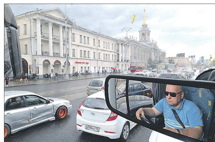
Ездить осторожнее станет выгодно

Наоборот, с льготной ставки на обычную - 20 про-