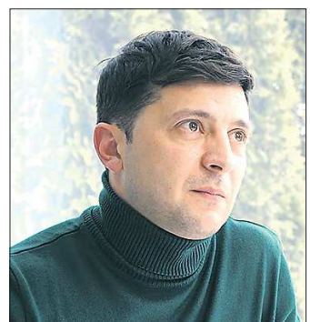
Владимиру Зеленскому (слева) – 41 год, опыта работы на госслужбе он не имеет. Петру Порошенко (справа) – 53 года, он стал президентом Украины 7 июня 2014 года

Не смогли также проголосовать в силу особенностей внутреннего законодательства ещё от 1 до 3 млн украинцев из числа внутренних перемещённых лиц и тех, кто не имеет постоянной прописки. Но на сей раз организаторы президентских выборов пошли ещё дальше. Центральная избирательная комиссия внесла поправки в регламент, ликвидировав все участки для голосования в