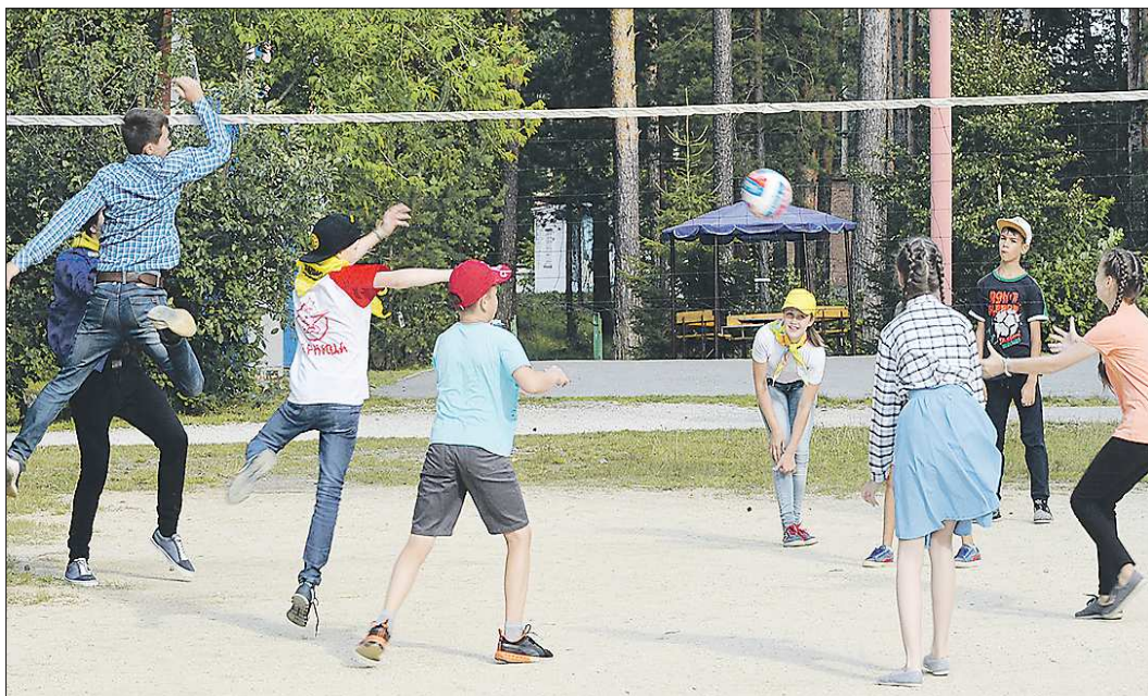
Те, кто не попадут в лагерь за бюджетную стоимость, могут попытаться купить путёвку в загородный муниципальный лагерь за 20–21 тысячу рублей