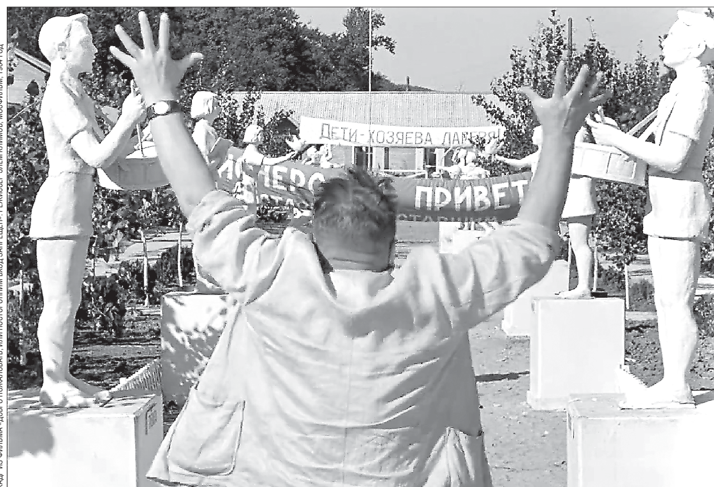
КАДР ИЗ ФИЛЬМА «ДОБРО ПОЖАЛОВАТЬ, ИЛИ ПОСТРОНИМ ВХОД ЗАПРЕЩЕНО» РЕЖИССЁРА ЭЛЕКСИЯ САВИНА

Электронная система записи в детские лагеря даёт сбой пятый год подряд