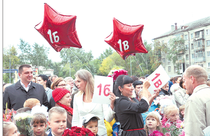
В 1-й класс в 2019 году в Екатеринбурге пойдут более 20 тысяч детей