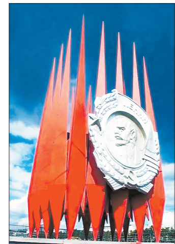
Краснознамённую группу в Свердловске установили в 1974 году

— Мы исходим из того, что этот объект в целом является символом трудовых побед, которые совершены жителя-