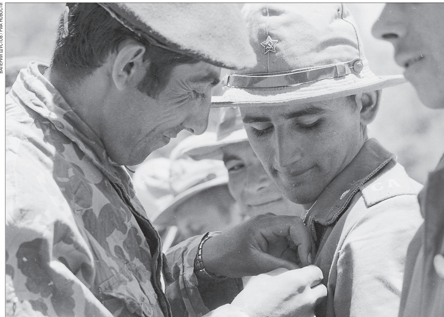
1981 год. Афганский воин дарит советскому солдату значок на память

Утром 15 февраля 1989 года по мосту через пограничную реку Амударью на территорию СССР перешли последние подразделения Ограниченного контингента советских войск в Афганистане. Прошло тридцать лет, и те события сегодня действительно переосмысливаются. В Афганистане наших солдат и офицеров, как и вообще советское присутствие, всё чаще помнят добрым словом. А те, кто был на войне, пытаются добиться от государства объективной политической оценки пребывания ограниченного контингента советских войск в Афганистане