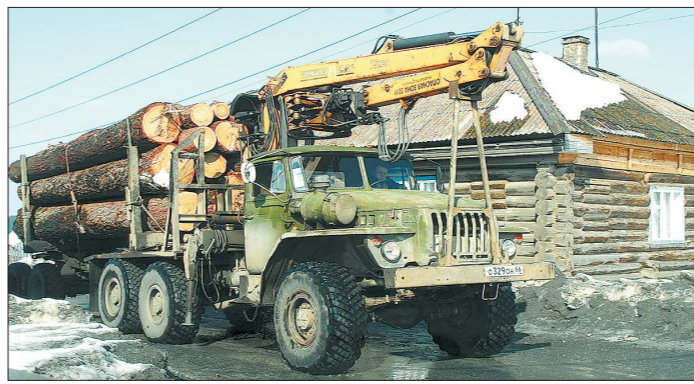
СВЕДЕНИЯ О НЕЗАКОННЫХ РУБКАХ ЛЕСНЫХ НАСАЖДЕНИЙ НА ЗЕМЛЯХ ЛЕСНОГО ФОНДА СУБЪЕКТОВ УРАЛЬСКОГО ФЕДЕРАЛЬНОГО ОКРУГА (2017—2018 ГОДЫ)

Самые действенные меры борьбы с «чёрными лесорубами» — это наличие выделенной в отдельное ведомство лесной охраны и дистанцион-