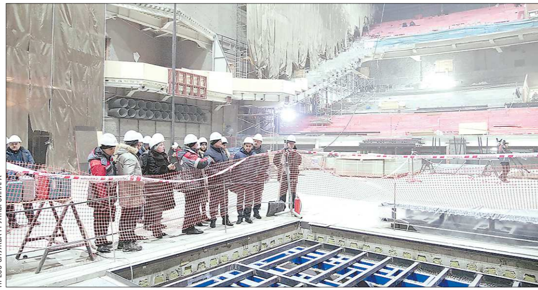
ПРЕСС-СЛУЖБА ГРУППЫ СИНРА

Количество участников GMIS-2019 пока не называется, но конгресс-центр, который сейчас достраивается рядом с МВЦ «Екатеринбург-ЭКСПО», рассчитан на большее количество гостей. Участники