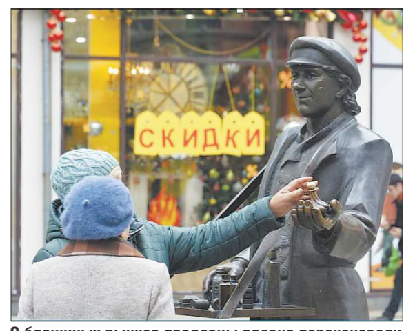
С блошиных рынков продавцы плавно переключались в Интернет: там теперь можно найти что угодно. Но необязательно это «что-то» будет иметь реальную ценность

БИЛЕТИК НА СЧАСТЬЕ. Маниакальная страсть к покупкам обладают не только коллекционеры. Один из знакомых жаловался, что боится оставить супругу один на один с Интернетом: она тут же что-нибудь купит. Ономазия, при которой покупки совершаются не из-за необходимости, а ради самого процесса, достаточно распространена в наши дни, поэтому даже са-