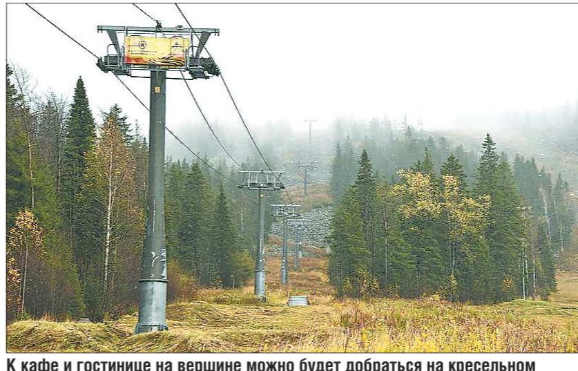
К кафе и гостинице на вершине можно будет добраться на кресельном подъемнике