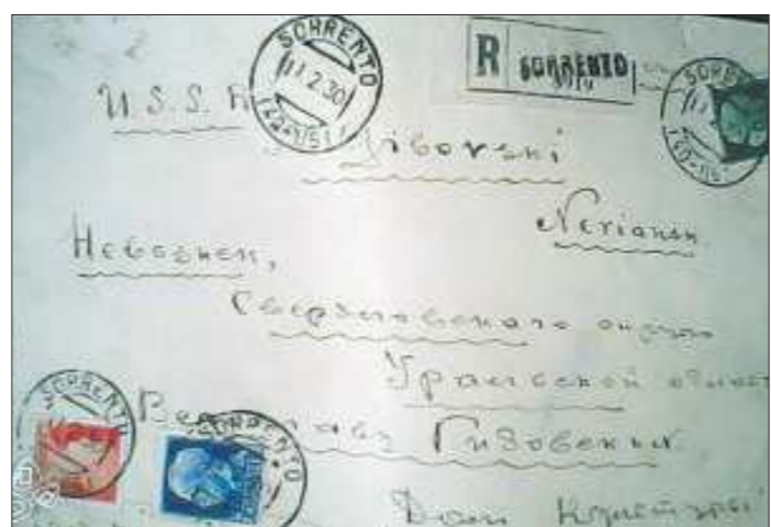
Как пояснил обладатель письма из Сорренто, обстоятельства знакомства ученика средних классов и русского писателя ему неизвестны

Школа эта необычная, она работает с 1905 года и имеет музей, где бережно хранятся реликвии учебного заведения. В списках директоров