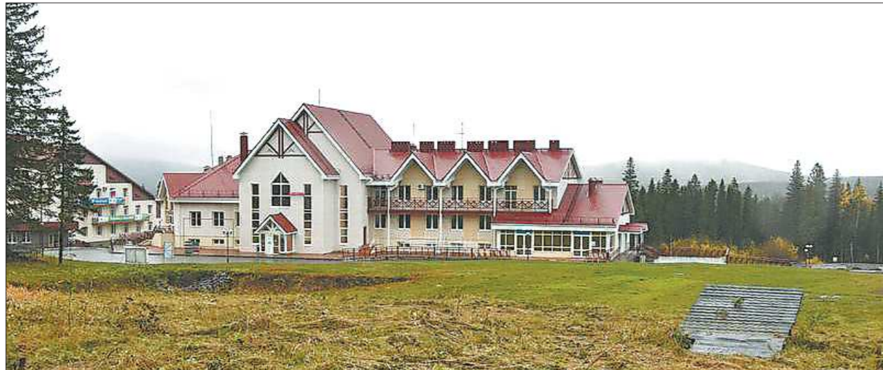
Горнолыжный комплекс «Гора Белая» — есть где развернуться будущему строительству