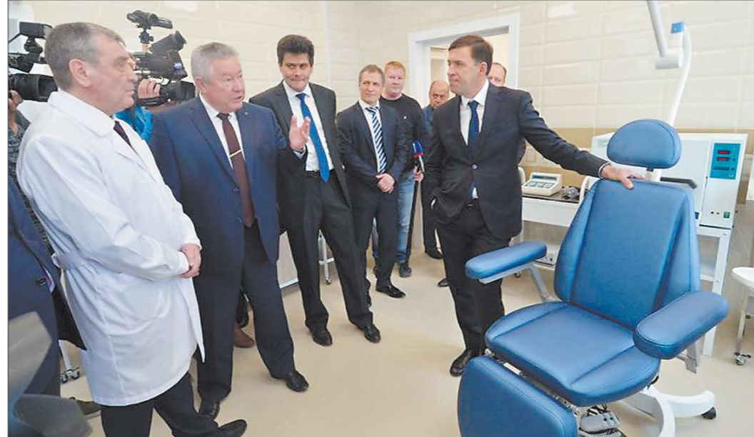
Главе региона доложили, что лечиться в новой заводской медсанчасти смогут работники не только МЗиКа, но и других предприятий

Кроме того, если в 1990-е годы оборонщики были вынуждены «сбрасывать» на баланс местных органов власти свои ведомственные поликлиники, базы отдыха, стадионы, пионерские лагеря и другие социальные объекты, то сегодня наблюдается обратная картина. За минувшие пять лет — с 2014 по 2017