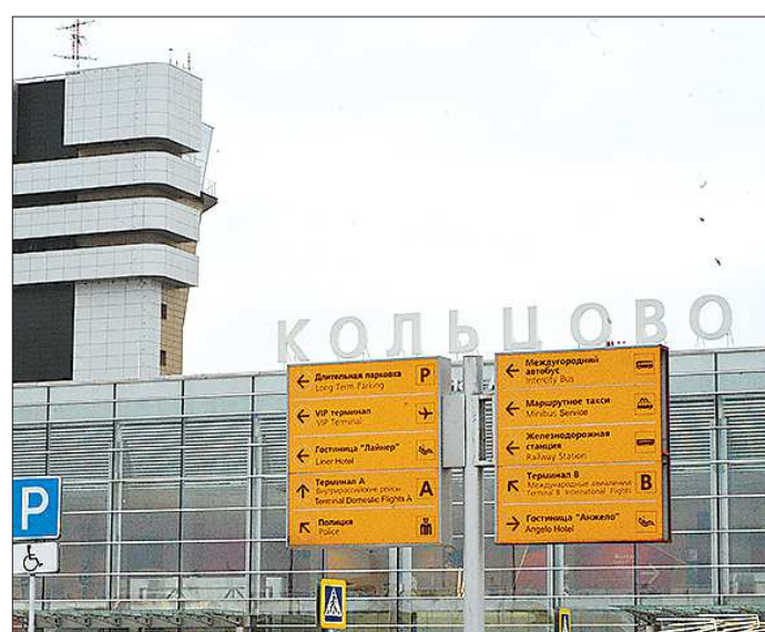
Второе имя для воздушной гавани Екатеринбурга будет известно уже 5 декабря