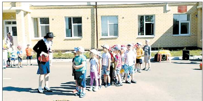
В «Родничке» — почти 400 мест, но проблему очереди они не решают

Пока муниципалитеты области создают места в яслях, в селе Косулино Белоярского ГО всё ещё не удаётся закрыть очередь в детский сад для детей от трёх до семи лет.