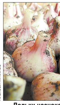
Дольки чеснока нового урожая отлично подходят для поздней посадки