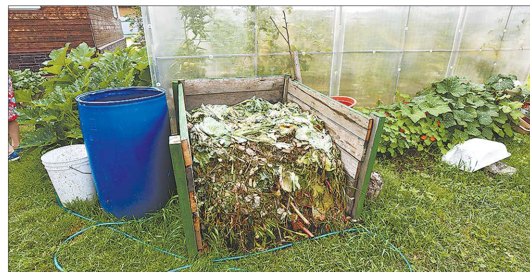
В компостную кучу можно добавлять навоз любого вида

Хранить картофель рекомендуется отдельно по сортам в тёмном месте при температуре плюс два – четыре градуса и влажности порядка 80 процентов, в слишком сухом месте он просто дрябнет. Семенной картофель стоит хранить так же, но в проветриваемом погребе или яме. В противном случае семена могут испортиться или заболеть, а значит, о хорошем урожае следующего года придётся забыть.