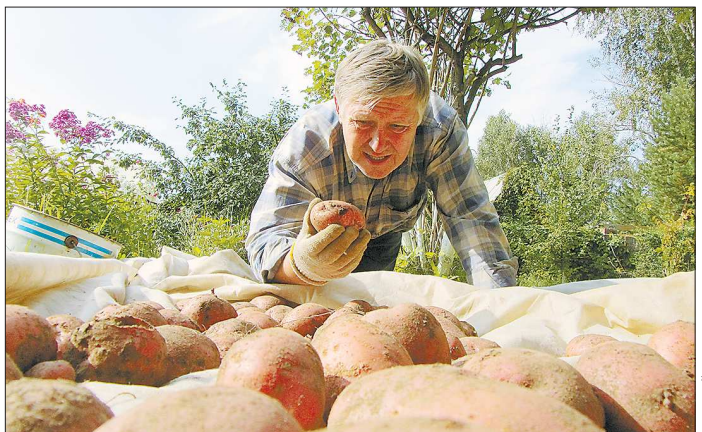
По возможности лучше выращивать картофель самому, соблюдая все правила агротехники культуры

Недавно эксперты Роскачества подвели итоги масштабного исследования магазинного и рыночного картофеля этого и прошлого годов. Как выяснилось, любая картошка, выращенная в условиях массового производства, может быть заражена болезнями, содержат вредные вещества с нитратами и иметь механические повреждения. «Областная газета» решила узнать у уральских аграриев, как выращивать картофель полезным и получить здоровый урожай.