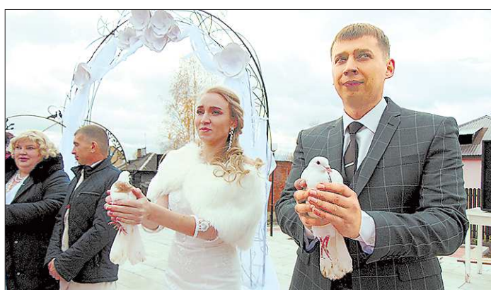
На регистрацию брака верхнетуринские пары ездят в Кушву и Красноуральск, а новобрачные из городов-соседей теперь будут ездить в Верхнюю Туру – за свадебными снимками