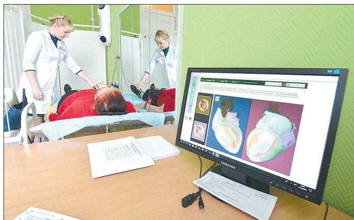
В ходе марафона здоровья можно проверить состояние и своих лёгких, и сердца