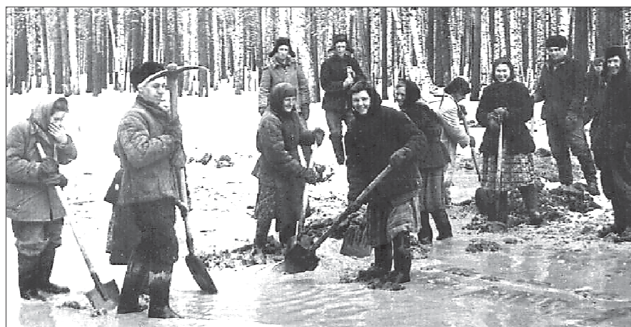
Дорогу от Мезенки до будущего Заречного строили и комсомолыцы, и комсомолочки