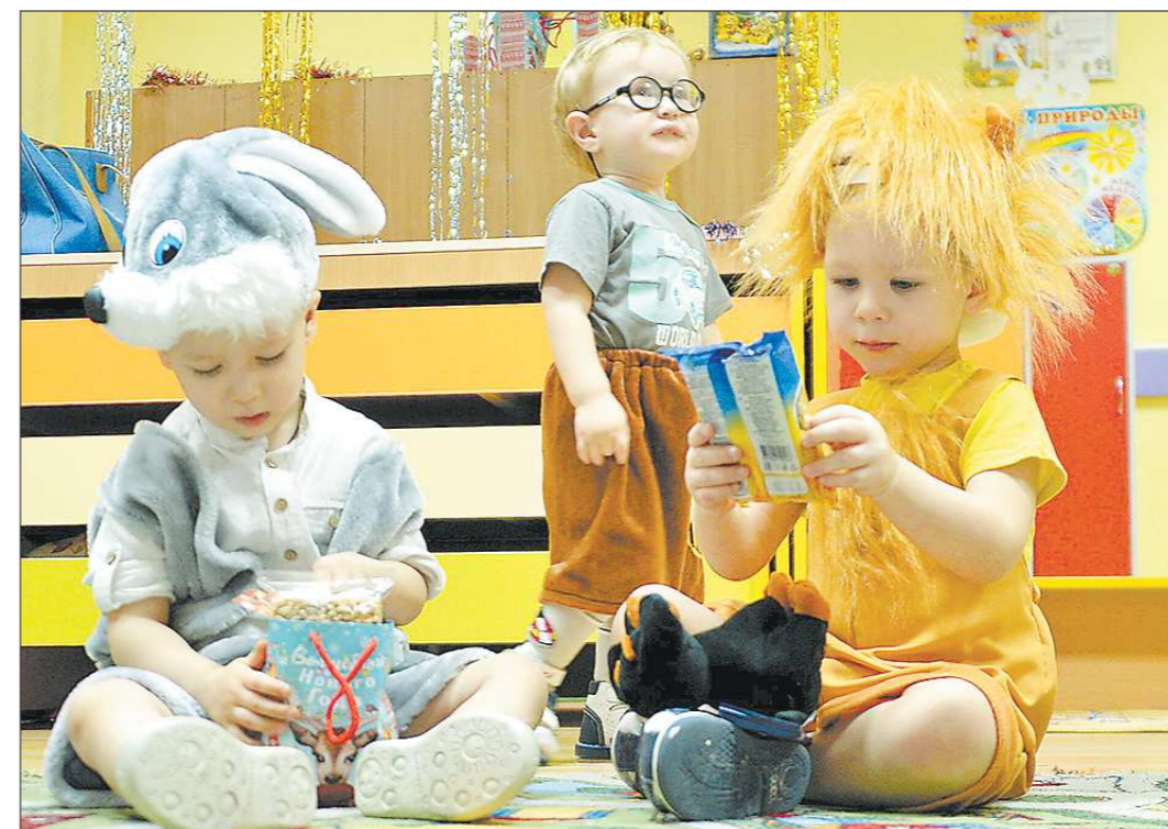
С местами для детей от трёх до семи лет в области давно нет проблем. В некоторых городах уже разобрались и с нехваткой мест в яслях

— Острой потребности в группах от года до трёх нет. Заметила, что мамочки в Полевском наоборот стараются отдавать детей в садик полегче, потому что они часто болеют. Но все дети, от родителей которых поступили заявки, посещают ясли. У нас даже есть одно заявление с просьбой предоставить место для ребёнка двух месяцев, но такой возможности пока нет. Чтобы заниматься малышом, нужны специальные условия.