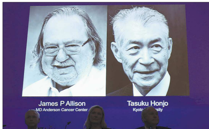
За выдающиеся успехи в лечении рака в 2017 году Джеймс Эллисон (слева) вошёл в ТОП-100 самых влиятельных людей мира по версии американского журнала Time. Тасуку Хондзэ в Японии считают легендой иммунологии, он изучает эту сферу более 50 лет

Если говорить языком науки, то организм может увидеть опухоль и бороться с ней при помощи собственных иммунных клеток