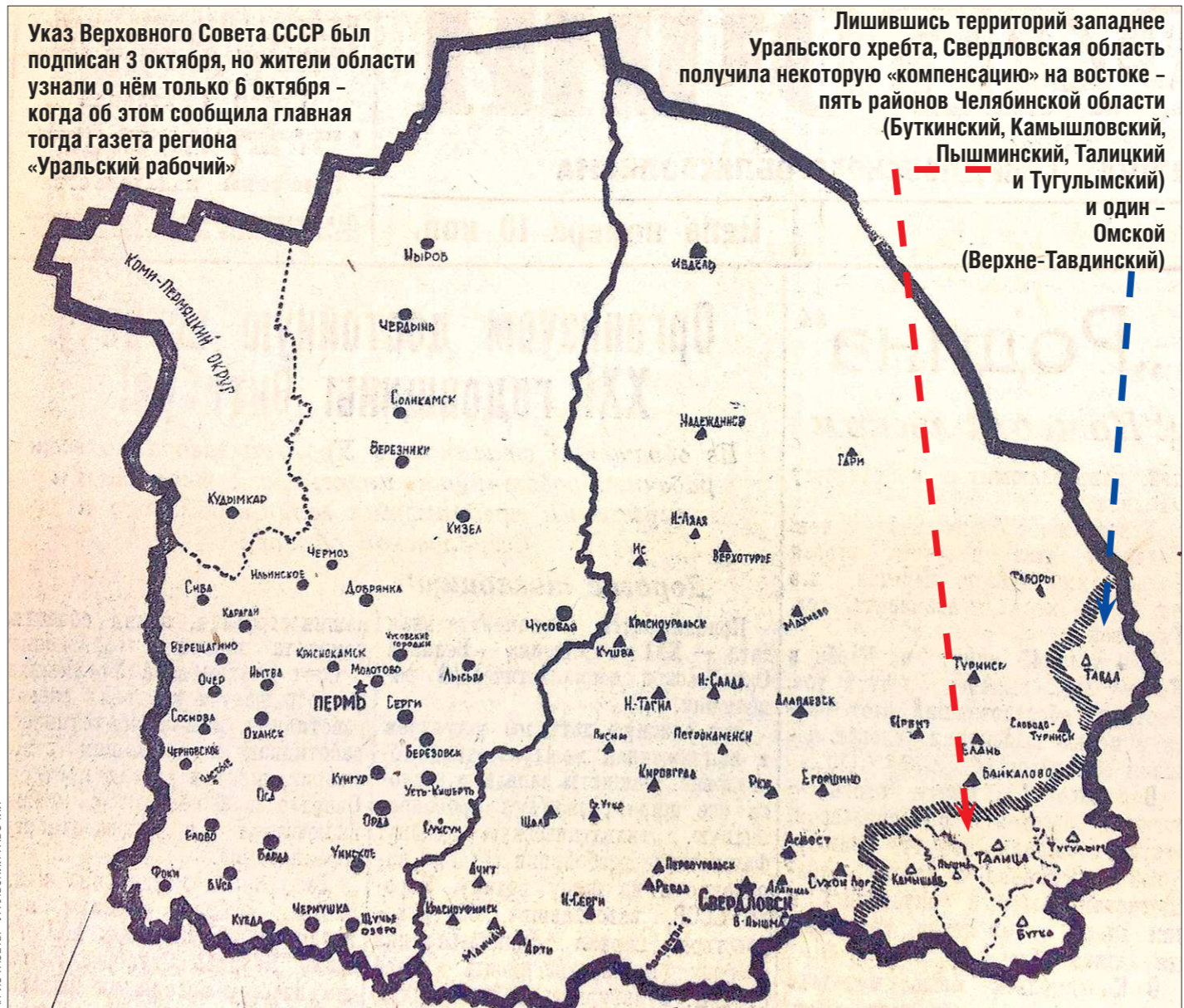
Окончательно формирование Свердловской области завершилось в 1942 году, когда к ней был присоединён Каменский район

— Да, выделение Пермской области из Свердловской имеет и чисто географический смысл. Граница между двумя регионами пролегла по Уральскому