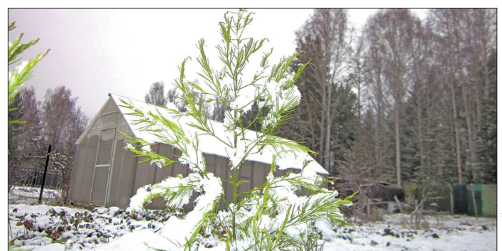
Малое количество снега садоводам приходится компенсировать укрытиями