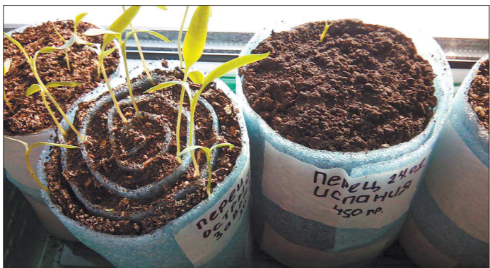
«Улитка» с появившимися всходами

Сложного здесь нет ничего: вместо ёмкости с грунтом семена высевают на ленту, припаянную к земле, потом её сворачивают в форме улитки.