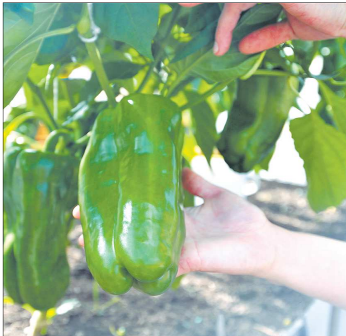
Такие красавицы-перцы вырастают до полукилограмма

Следующим этапом будет пикировка. Выполняется она легко: кусок ленты с растением отрезаем, полиэтилен выбрасываем, а сеянец высаживаем на новое место.