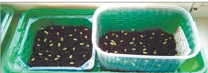
Всходы цветочной рассады очень нежные, важно их не пересушить и не залить водой

Многие дачники предпочитают не покупать цветочную рассаду, а выращивать её самостоятельно. На Среднем Урале последний месяц зимы — это время, когда пора высевать в грунт цветы-однолетники с долгим периодом вегетации.