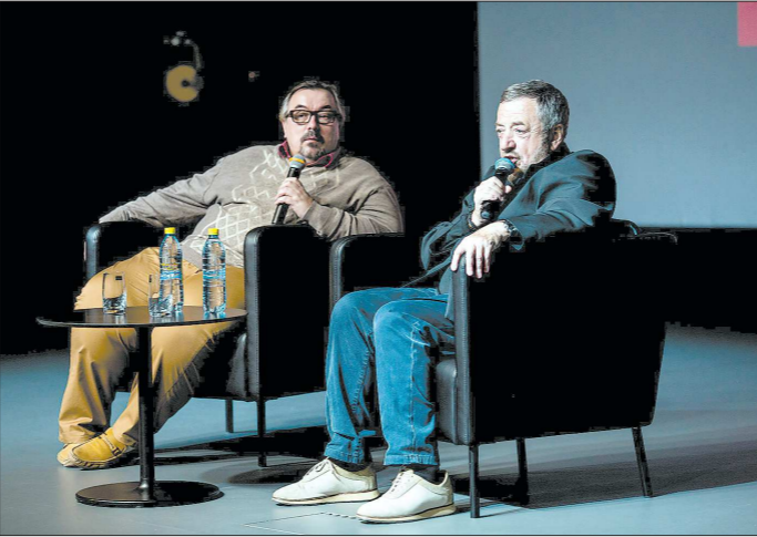
Вячеслав Шмыров (слева) часто выступает модератором творческих встреч. На фото — режиссёр Павел Лунгин отвечает на вопросы зрителей после показа своего фильма «Дама пик»

— Да, я вижу в зале знакомые лица. Понятно, что многие ориентированы на громкие имена, которые есть в на-