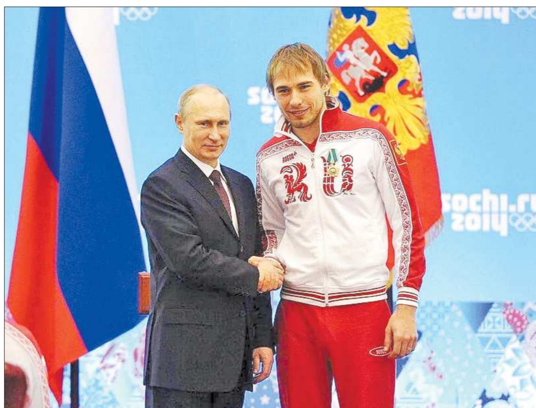
О своём вступлении в Putin Team Антон Шипулин написал в Instagram, выложив фото, где Владимир Путин поздравляет его с олимпийской медалью

Движение Putin Team появилось в конце прошлого года — о его создании через Instagram объявил хоккеист Александр Овечкин. Он призвал объединиться людей, поддерживающих действующего президента. За сутки к движению присоединились хоккеисты Илья Ковальчук, Павел Буре, Борис Михайлов и Вячеслав Фетисов. Но прирастать оно начало не только хоккеем. За три месяца в Putin Team вошло около 100 известных спортсменов, актёров, певцов. Из числа уральцев к движению присоединились актриса «Уральских пельменей» Юлия Михалкова и биатлонист Антон Шипулин — оба сейчас лидеры мнений у молодежи.