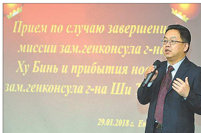
Новый заместитель Генерального консула КНР в Екатеринбурге господин Ши Тяньцзя намерен продолжить курс своего предшественника на укрепление экономических и культурных связей двух стран