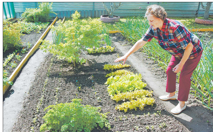
На основании поправок в категории физических лиц (в том числе пенсионеры) получили право на налоговый вычет за земельный участок. Льгота действует с 2017 года

И хотя список банков-участников программы ещё формируется, выданы уже два таких кредита, один в Санкт-Петербурге и один в Екатеринбурге. Напомним, что такие льготные ставки возможны при соблюдении ряда условий. Во-первых, если в семье родился второй ребёнок в обозначенные постановлением правительства сроки — с 1 января 2018 года по 31 декабря 2022 года. У наших героев, имена которых мы не раскрываем по их просьбе, второй ребёнок родился 7 января. Кредит уже переформирован, дом был выбран в одном из строящихся жи-