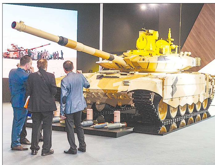
Танки Т-90 разных модификаций — непременные участники всех крупных международных военных выставок

ется дальнейшим развитием разработанного в 1990-е годы основного отечественного танка Т-90 (экспортный вариант — Т-90С). От своей предшественницы новая боевая машина отличается прежде всего конструкцией башни, в которой боекомплект для повышения выживаемости экипажа размещён вне боевого отделения, и модернизированной 125-миллиметровой пушкой с увеличенной длиной ствола. По сравнению с орудиями, которые устанавливались на Т-72Б и предыдущих моделях Т-90, у этой пушки гораздо выше скорострельность (до 12 выстрелов в минуту — как у «Арматы»). Кроме того, Т-90М оборудован новейшей системой управления огнём «Калина» с лазерным дальнометром и интегрированным тепловизионным каналом, и новой модульной динамической защитой от практически всех современных и перспективных противотанковых средств.