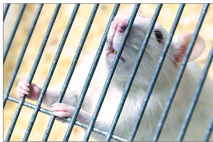
Статья о клонировании мышки Маши вышла в 1987 году в советском журнале «Биофизика». Маша прожила больше года — столько, сколько мыши живут в природе. Учёные обратились с публикацией в журнал Nature, но редакция это сообщение... проигнорировала. В мире шла «холодная война»