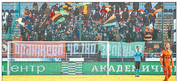
Болельщики «Урала» — самые дисциплинированные в Премьер-лиге

Свердловская область — лучший регион в развитии спорта в России