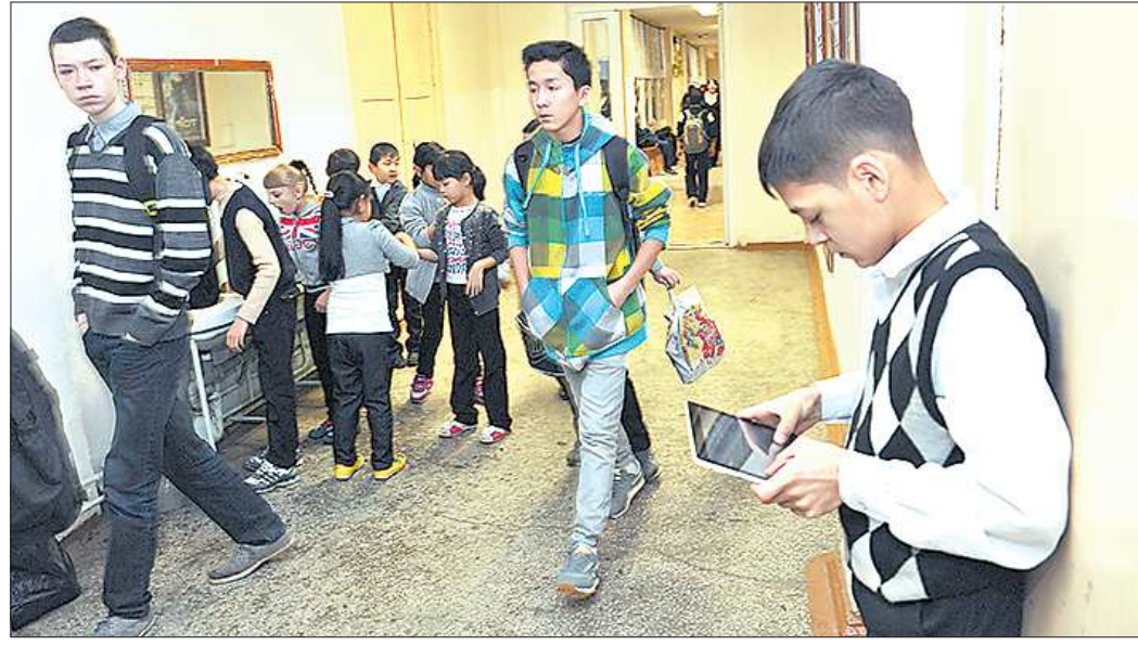
На переменах вместо игр с одноклассниками дети играют в игры компьютерные — с виртуальными друзьями

— Однако у родителей наболело. Одна из самых обсужда-