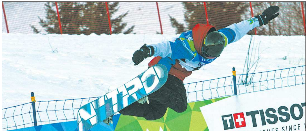
Биг-эйр — зрелищная акробатическая дисциплина сноуборда, популярная у молодёжи