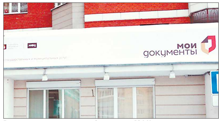
В настоящее время опыт обращения в МФЦ имеют около 45 процентов свердловчан. В 2018 году эту цифру планируется довести до 70 процентов

Чтобы занять высшую ступень, региональным многофункциональным центрам необходимо было получить суммарную оценку свыше 80 баллов из 100 возможных. Эффективность работы свердловского МФЦ в тре-