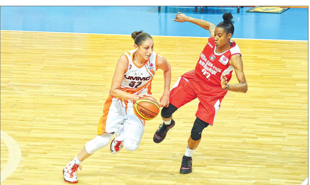
Кроме командных титулов у Таурази (с мячом) есть около полусотни индивидуальных наград

— Я пишу не об истории. Это ошибка — считать «Захкок» историческим романом. Хотя действия происходят в недалёком прошлом, но это ни в коем случае не историческое сочинение. Это также и не рассказ о гражданской войне. Война присутствует в романе как некий фон, потому что события происходят в далёком горном кишлаке. Отголоски