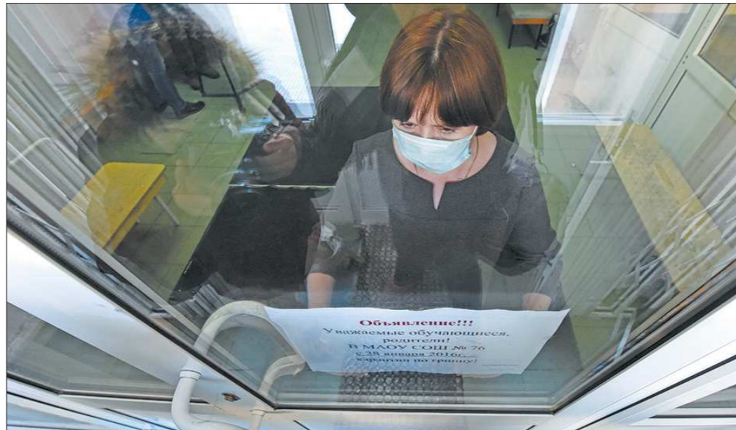
В этом сезоне медики ожидают в Свердловской области уже знакомый нам вирус гриппа H1N1 — именно от него прививают население

Конечно, есть случаи, когда младенцев с рождения суровые родители выгуливали в коляске даже зимой всего лишь под простышкой. Такая в 90-е годы была мода. И дети вроде бы действительно не болели. Иммунитет укреплялся — будь здоров! Такие факты имеются. Но советовать такую подход всем подряд никак нельзя — а если не повезёт? И организм не выдержит?