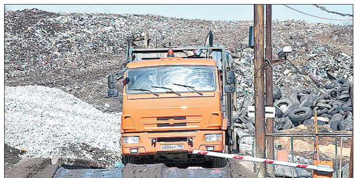
Сейчас повторно используется только 12-14 процентов ТКО, а можно — 80-90 процентов