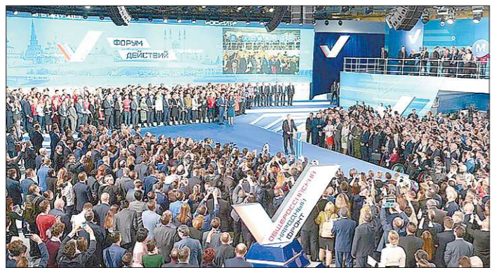
В этом году форум стал самым масштабным за всю историю ОНФ и собрал более 4000 участников со всей России