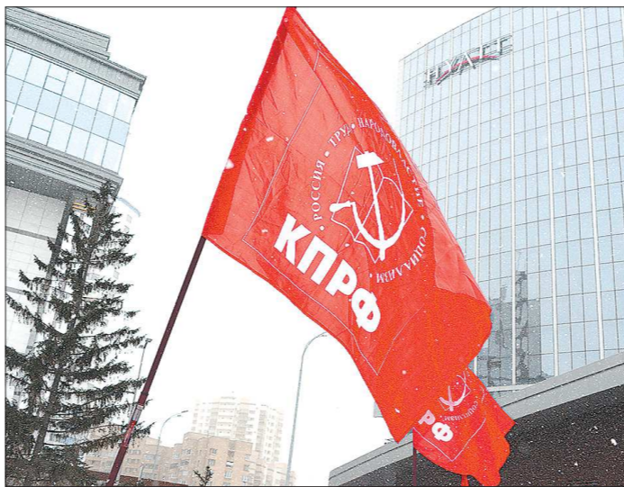
Решение о том, кто будет баллотироваться от КПРФ в Президенты России, коммунисты примут на съезде

Цитируем: «После обсуждения предвыборных вопросов и формирования рабочих органов съезда делегаты приступят к основной части мероприятия — выдвижению кандидата в Президенты РФ. Присутствующим будет озвучено мнение Высшего совета партии — о ре-