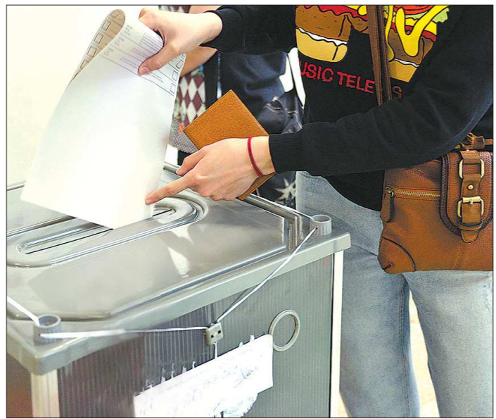
Досрочное голосование оставят только для жителей труднодоступных территорий

● Кроме того, прописаны случаи, в которых могут быть уточнены границы избирательных участков. Это может быть изменение границ, преобразование, упразднение муниципальных образований,