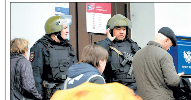
Эвакуация из здания Главпочтамта

13:00-13:30. Поступили сообщения о минировании Главпочтамта, администрации Кировского района, многопрофильной инспекции Чкаловского района, Дома актёра, представительства ЯНАО и ХМАО-Югры, а также нескольких школ. Сотрудники Роскомнадзора, расположенного в здании Главпочтамта, после проверки (в 19:30) вернулись на рабочие места и работали до полудня. Так поступали работники многих ведомств и организаций.