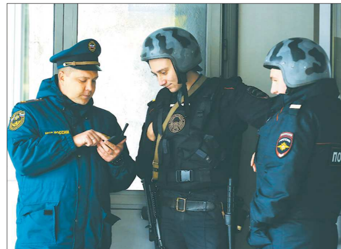
Полиция и МЧС во время эвакуации установили своеобразный «клапан», который работал только на выход. Судя по настроению ребят, за этот день они уже накапались по городу...