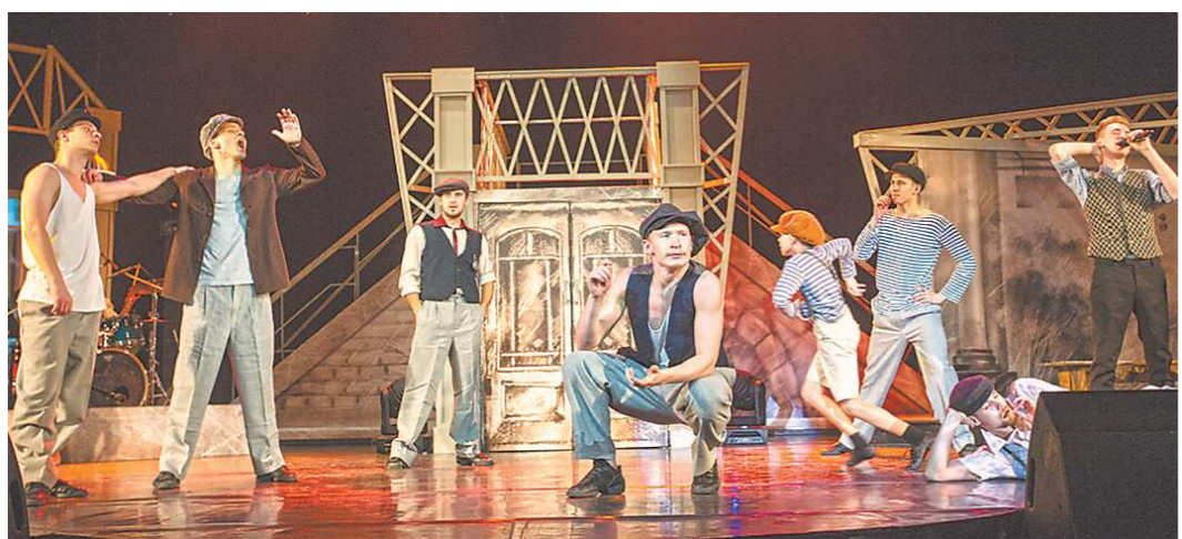
Стихи Сергея Есенина — гимн хулигана, вечно мальчишки и великого мудреца. Это создатели спектакля и пытались показать на сцене