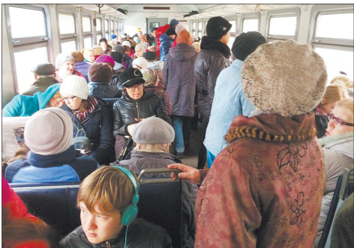
Пассажиры в электричке Екатеринбург — Дружинино в будний день

го графика движения именно с конца сентября существует на Свердловской железной дороге ещё с 2012 года. Тогда в СПК основной причиной отмены электричек называли традиционное снижение пассажиропотока в осенне-зимний период. «В связи с этим с октября на всех направлениях СВЖД пригородных поездов выводят из расписания ряд невостребованных у пассажиров малонаселённых поездов, что расширяет возможности железнодорожной ин-