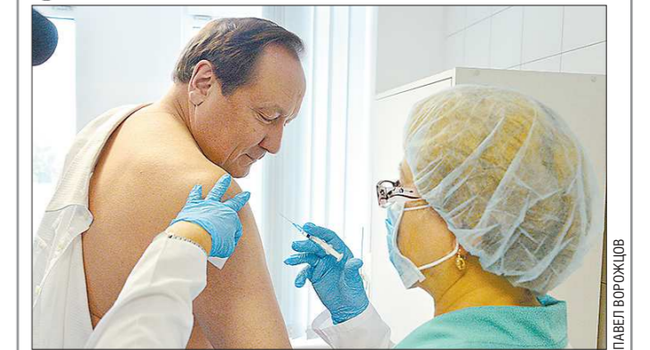
В Свердловской области продолжается прививочная кампания. На прошлой неделе члены правительства Свердловской области сделали прививки против гриппа. — Лучше привиться до подъёма заболеваемости. Вакцина абсолютно безопасна для здоровья и доступна для жителей области, — сказал и.о. министра здравоохранения региона Игорь Трофимов (на фото). В регионе планируют привить более 1,9 млн человек, в настоящее время план выполнен на 25 процентов. Кто ещё из ВИП-персон сделал прививку? Смотрите на сайте oblgazeta.ru