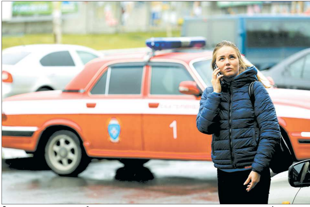
Эвакуированные екатеринбуржцы не спешили расходиться по домам, выкладывали фото в соцсети и рассказывали друзьям об очередных «приключениях»...