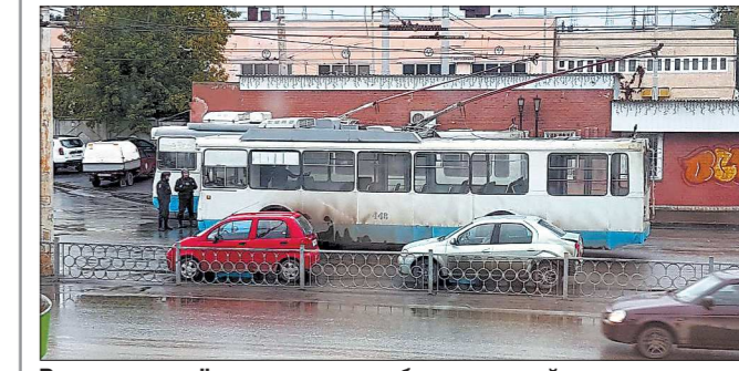
В эти дни сапёры проверяли общественный транспорт Екатеринбурга

Эвакуировали посетителей ТЦ «Мега» в Екатеринбурге и пассажиров железнодорожного вокзала в Нижнем Тагиле.