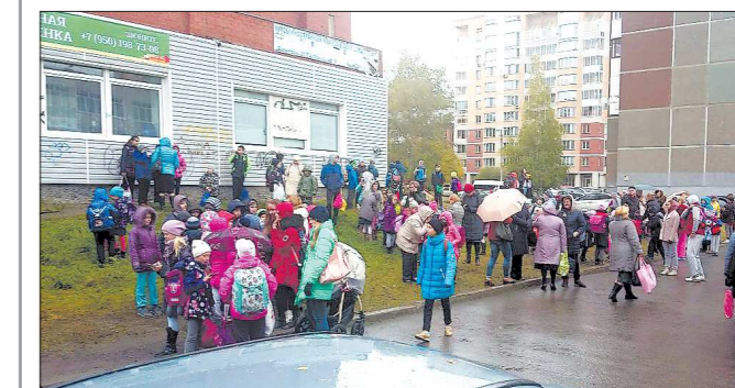
Эвакуация 165-й школы в Кировском районе Екатеринбурга

14:00-15:00. Покинуть здания были вынуждены посетители ТЦ «Парк-Хаус», «Диржижабль», «Кит», «Таганский ряд» и «Алатырь». А также посетители Центра культуры в Горном Ците, клиники «Альфа-Центр Здоровья», пассажиры Южного автовокзала, учащиеся ещё нескольких школ и детсадов на Заводской.