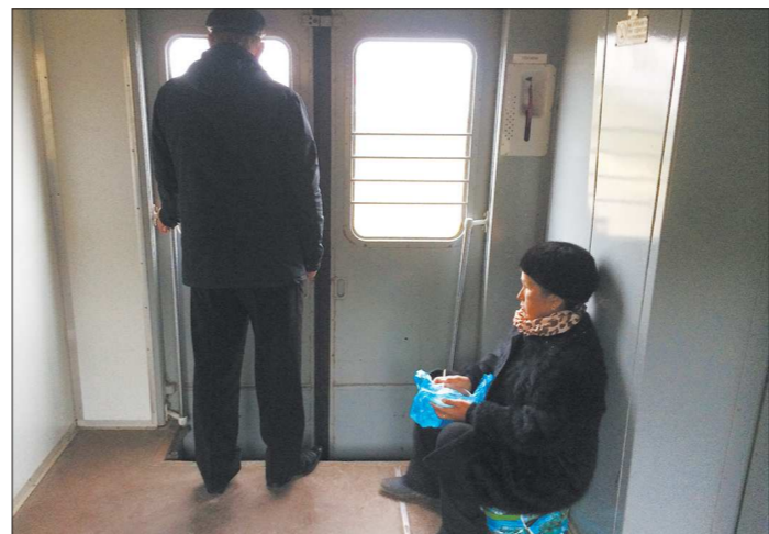
Некоторые пассажиры едут на сумках или складных стульях

В СПК нам так прокомментировали ситуацию: «АО «Свердловская пригородная компания» является перевозчиком, который осуществляет свою деятельность на основании заказа на пригородные перевозки со стороны субъекта РФ. Именно правительства ре-