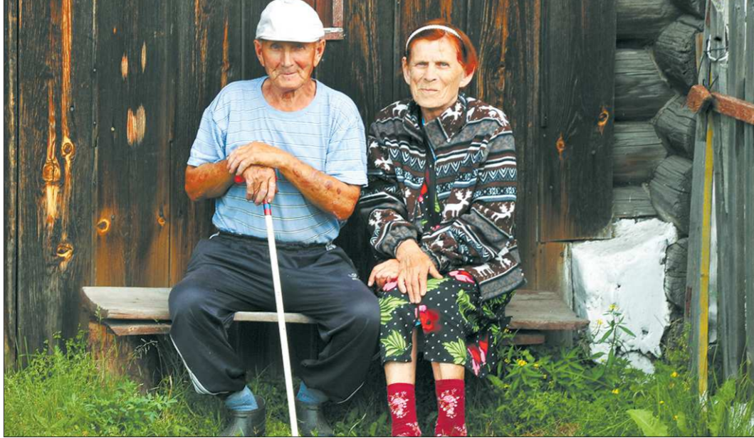
Подарок, который больше всего ждут в День пожилых людей (и в любой другой день, разумеется) — это внимание детей и внучат