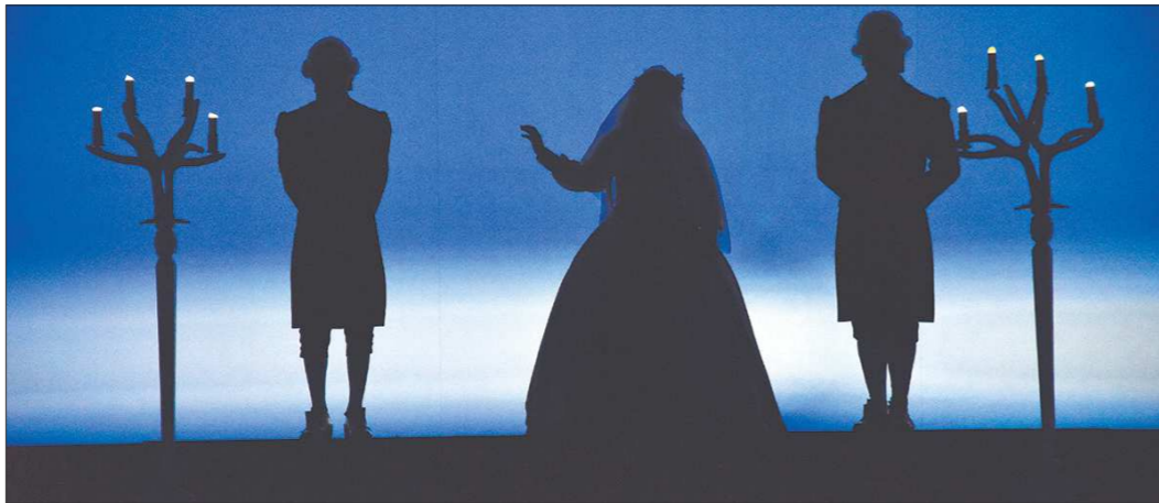
Ожидание конца света становится для человечества перманентным, только в этом году было несколько поводов