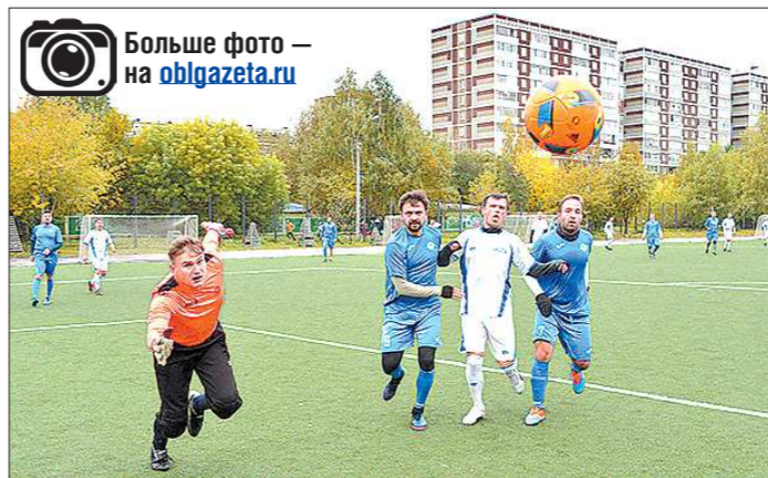
В футбольном матче игрокам команды диспетчеров-энергетиков (на фото — в синей форме) не всегда удавалось сдерживать атаки коллег-соперников

Перед игрой участники признавались, что в их диспетчерской работе крайне важны те качества, которые развивает футбол: единство команды, чувство плеча, нацеленность на результат. А реакция на любые штатные и нештатные ситуации помогает мгновенно принимать решение и на футбольном поле. — Такие командные виды спорта укрепляют коллектив, — отмечает начальник группы корпоративной социальной политики филиала «Аэ-