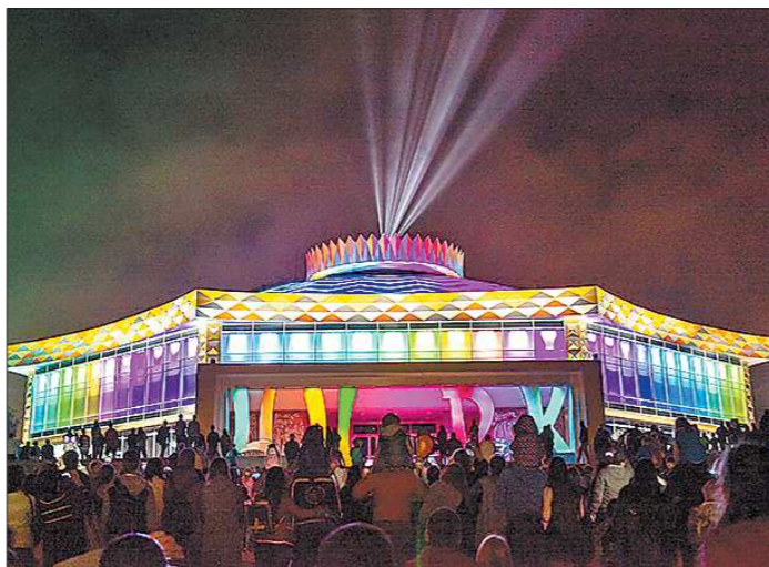
В День города тагильчане смогли впервые наблюдать уникальное световое представление на здании обновлённого цирка

Артисты воспринимали гастроли в Нижнем Тагиле как наказание. Зрители были также недовольны разрухой, царившей в зрительном зале и холлах. С этих стартовых позиций и начался капремонт в марте 2016-го.