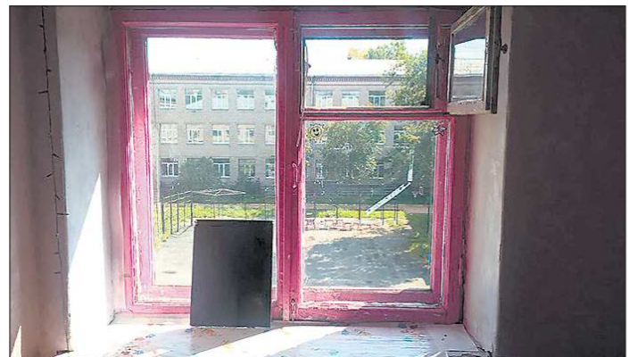
От холодов такое окно не защитит

По словам родителей, и в самом здании, и комнатам в