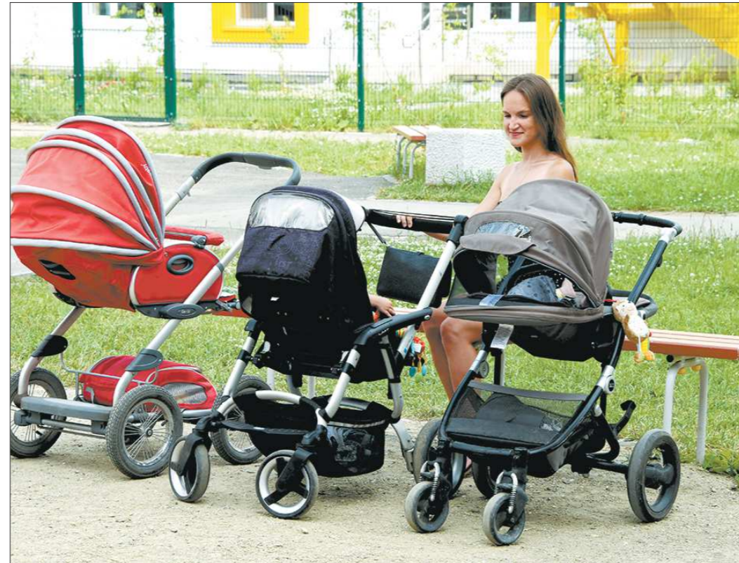
Выбирая няню, мамы чаще всего прислушиваются к «сарафанному радио», ориентируются на опыт и наличие педагогического образования у кандидата. Если няню подбирает папа, то, по данным кадровых агентств, на первом месте — возраст и... приятный внешний вид

Няня должна разбираться в возрастной психологии дошкольника. Имен-