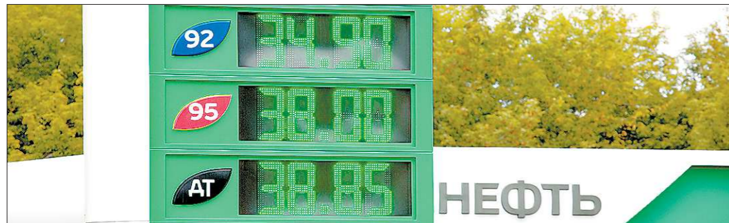
Сейчас цены на зарядку аккумуляторов электромобилей делают использование этих электромобилей выгоднее, чем заливку в бак бензина

ЭКСПО дало городу и культурный толчок. Например, в Национальный музей Республики Казахстан, который напоминает екатеринбургский Ельцин Центр, за три месяца