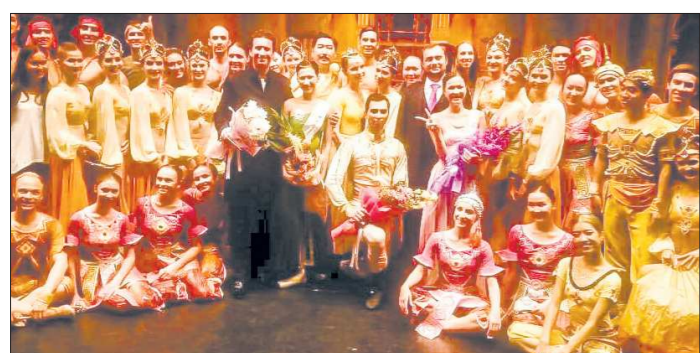
Свердловская балетная делегация после спектакля в Бангкоке