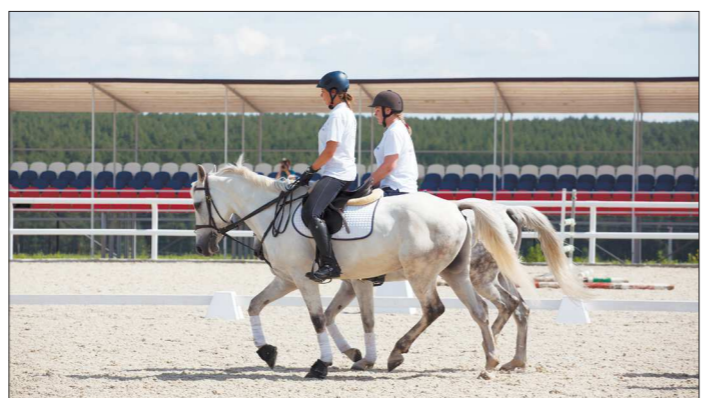
Конный спорт — удовольствие не из дешёвых. Но в некоторых школах для детей обучение бесплатное