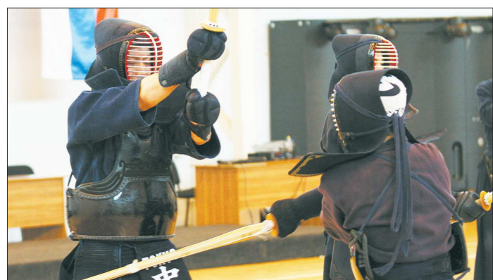
Кендо — для тех, кто хочет почувствовать себя настоящим самураем, ведь в его основе — самурайские техники владения мечом