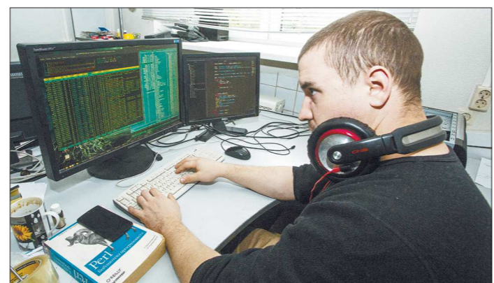
Не миф: почти все программисты хотя бы раз в жизни работали двое-трое суток подряд, а потом долго не могли понять, кто это в зеркале