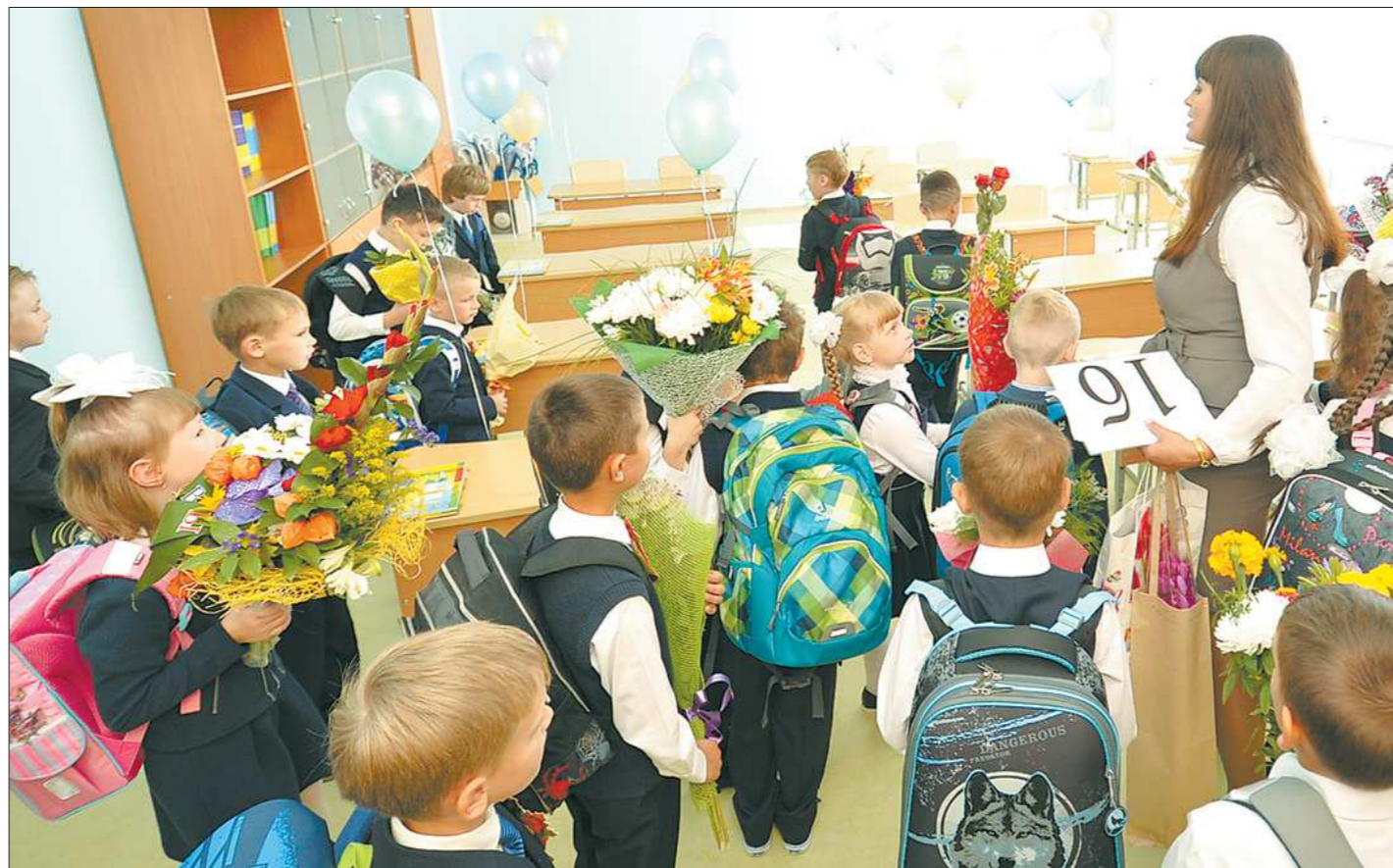
Санитарные нормы сейчас не запрещают зачислять в класс больше 25 детей. Главное — чтобы всем хватало места и света

Так, из пяти классов лицея № 88 в Кировском районе вполне получились бы шесть, а из четырёх гимназии № 35 — пять. Почему же не открыли больше классов и одновременно не сократили количество детей в них? Руководство школ называет две причины. Первая: в старых зданиях школ — таких как лицей № 110, гимназия № 44 в Екатеринбурге —