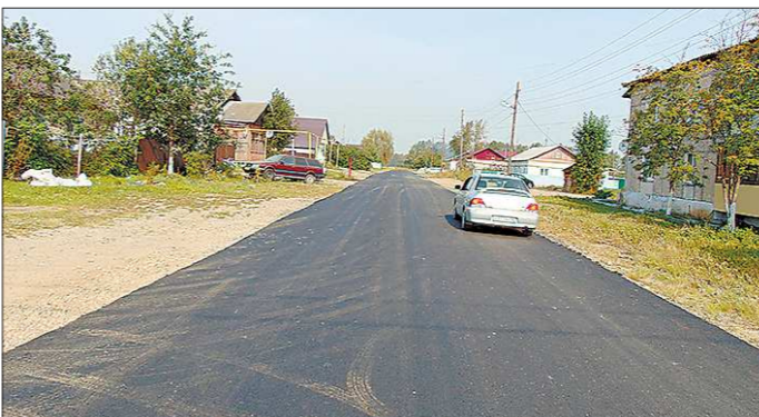
Теперь главные улицы Покровского заасфальтированы не только по документам