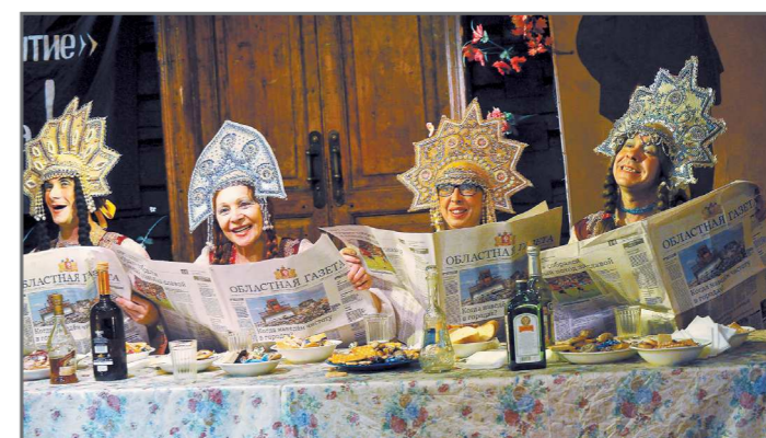
Актеры екатеринбургского «Коляда-театра» читают «Областную газету» даже во время спектаклей (сцена из постановки «Баба Шанель»)

Открыта подписка на «Областную газету» (расширенная социальная версия — со вкладками и ТВ-программой) на 2018 год