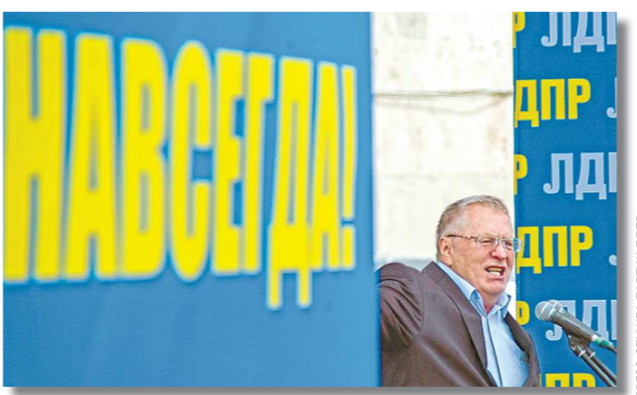
Владимир Жириновский: «Внешняя политика России должна стать жёстче и мудрее»

Киевские власти самостоятельно подкрепить свою самостоятельность, но из страны бегут не только россияне: бежит и украинская молодёжь. Пётр Порошенко своим выступлением на праздновании Дня независимости страны ещё раз рас-