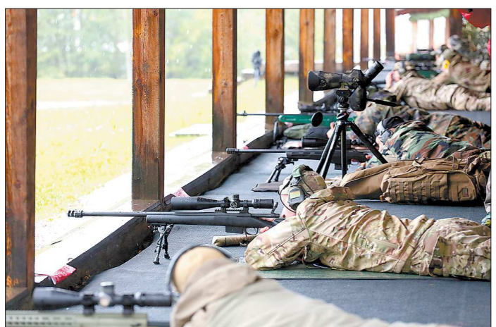
Нечасто в одном городе собираются сразу 40 российских снайперов. Лучшим на Кубке Урала по снайпингу стали два тюменца и стрелок из Набережных Челнов