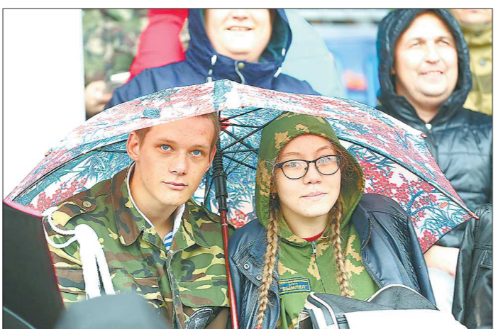
Основными участниками мероприятий на «Старателе» стали ученики кадетских корпусов и военных училищ, воспитанники военно-патриотических клубов и тагильские школьники