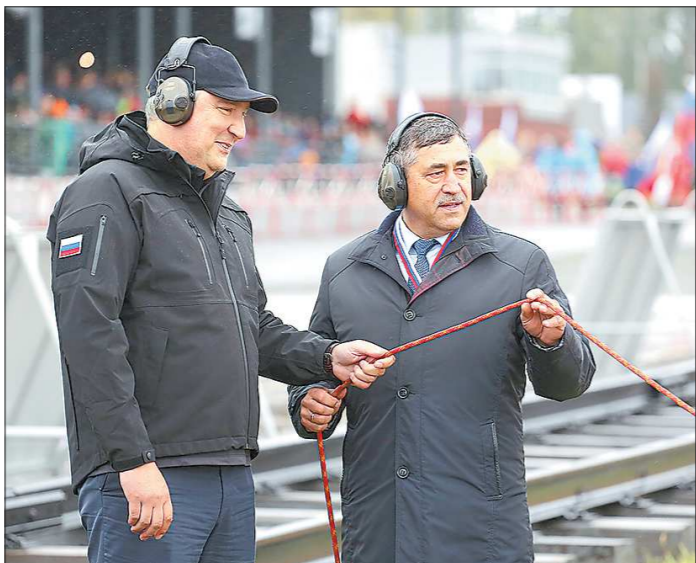
Старт фестивалю «УралТанк» дал Дмитрий Rogozin (на снимке — слева), сделав символический выстрел из гаубицы

В Нижнем Тагиле впервые прошёл военно-патриотический фестиваль «Урал-Танк». В День танкиста на полигоне «Старатель» зрители увидели реконструкцию Сталинградской битвы, соревнования снайперов и танковый биатлон.