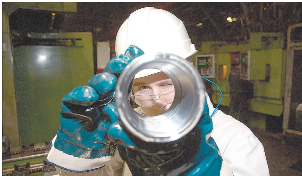
Хорен видит себя технологом трубного производства и рассчитывает, что работа в цехе — это не навсегда

— Да, поскольку там работает мой отец, и на тот момент я даже не представлял, где ещё у нас можно работать. Я просто решил пойти по его пути. В юношеском возрасте я начал