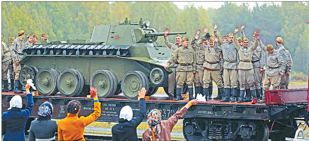
Историческая реконструкция событий 75-летней давности: так танки, сошедшие с конвейера «Уральского танкового завода», и свердловские солдаты отправлялись на фронт

В субботу дождь не утихал весь день, но зрительские трибуны на полигоне «Старатель» были переполнены. Главными гостями фестиваля стали кадеты, суровоцы и ребята из патриотических клубов.