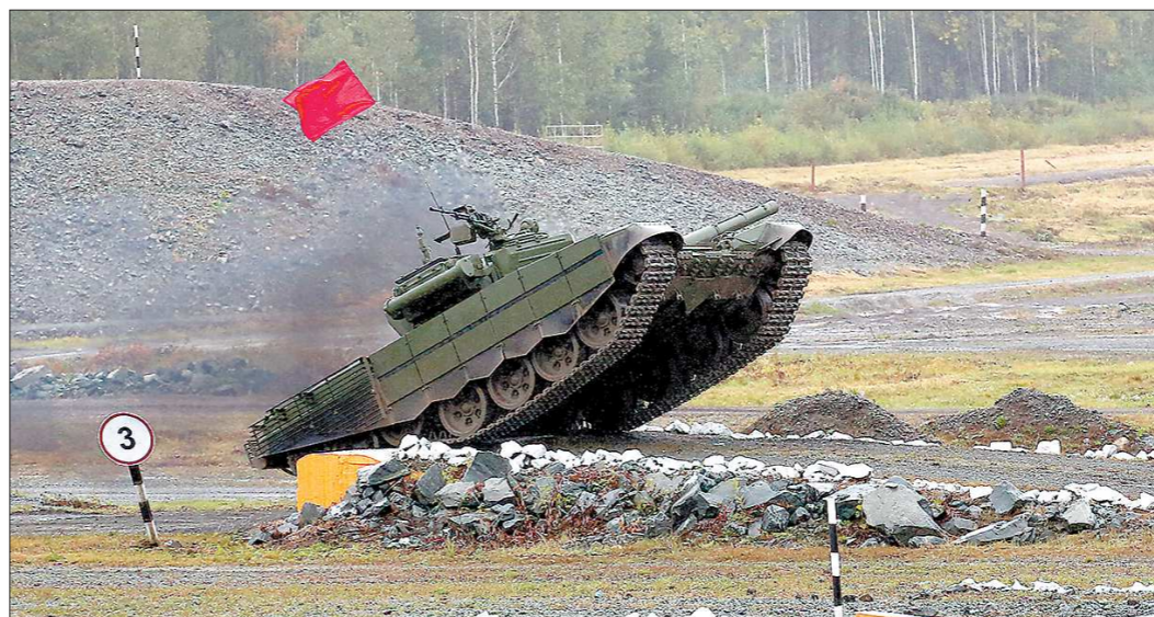
На соревнованиях по танковому биатлону выстрелы громче, чем на зимнем биатлоне, а трасса — экстремальнее, чем на современных автогонках. Техника только на первый взгляд кажется неповоротливой

В субботу дождь не утихал весь день, но зрительские трибуны на полигоне «Старатель» были переполнены. Главными гостями фестиваля стали кадеты, суровоцы и ребята из патриотических клубов.