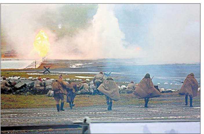
Полигон превратился в поле сражения: участники исторической реконструкции воссоздали один из эпизодов Сталинградской битвы