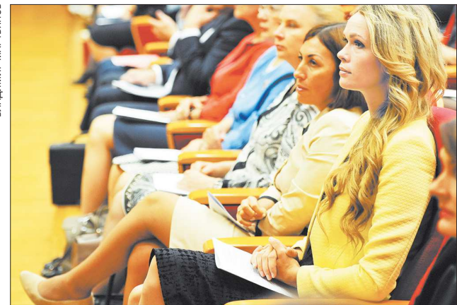
«А вот женщины, напротив, решили в очередной раз возвалить на свои хрупкие плечи целый ворох забот»