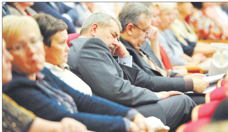
На заседание женского парламента пришло немало мужчин. Но не всем под силу оказался груз женских проблем