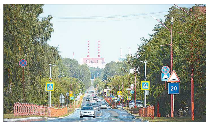
Визитная карточка Заречного — оранжевые фонари и ограждения. Благодаря им город даже в пасмурную погоду не выглядит серым