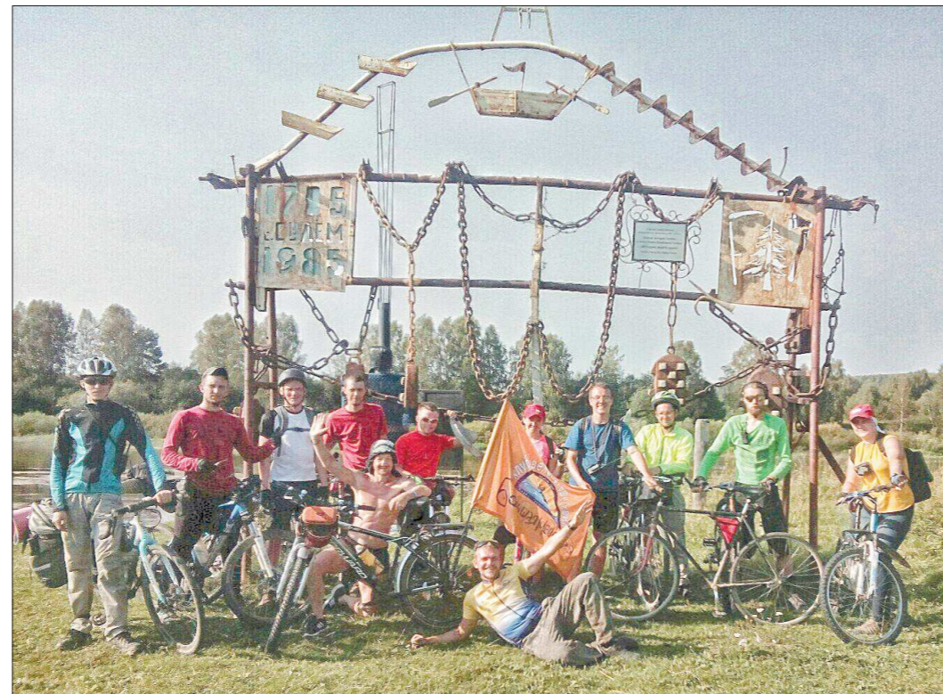
Фото краеведов на память в Музее под открытым небом Сулёма на фоне железной рамы, на вершине которой вырезана лодка с вёслами, символизирующая село

В деревне Усть-Утка участники побывали в музее «Русская горница». Здесь сотни кукол: обережные, обрядовые (для свадьбы или сватовства) или просто демонстрационные костюмы разных народов Урала. Яркие, нарядные. Попутно с костюмами для кукол здесь же шьются полноразмерные наряды – велосипедисты с большим любопытством примерили на себя одежду разных эпох и послушали рассказы о быте людей, живших на Урале в стародавние времена. В музее школы села Чусовое ребятам показали картинную галерею уральских художников, а также рассказали о значимости села во времена «железных караванов» – речной флотилии, осуществлявшей грузовые перевозки в европейскую часть России с металлургиче-