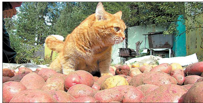
Собранную картошку нужно просушить на солнце