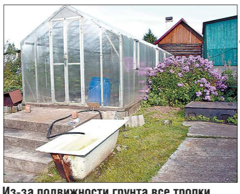
Из-за подвижности грунта все тропки в саду и подходы к теплице пришлось бетонировать