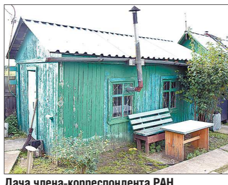
Дача члена-корреспондента РАН началась в 1989 году с зелёного домика — сейчас в нём хранятся инструменты