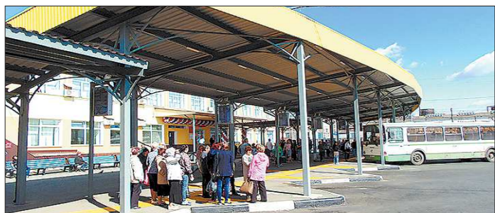
Автовокзал стал удобным и для пассажиров, и для водителей автобусов, которые раньше подъезжали к перрону по ухабам