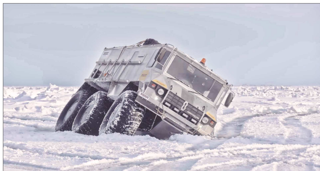
В экспедиции участникам пришлось преодолевать множество трудностей. Одна из них – рыхлый снег. Провалиться легко, но вот достать 3,5-тонную машину – большая проблема