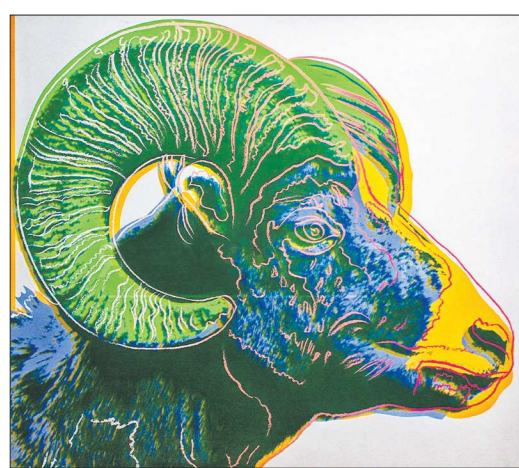
«Толсторогий баран», Энди Уорхол (1983. Вид – снежный баран)

– Удача всегда есть. Но она любит подготовленных. К удаче нужно быть готовым, а иначе упустишь её.