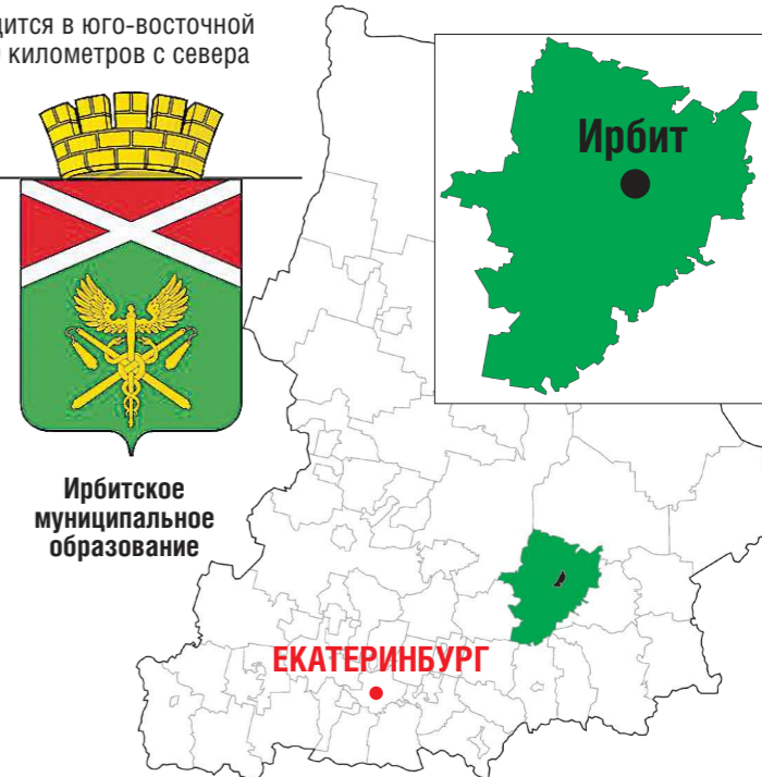
Ирбитское муниципальное образование