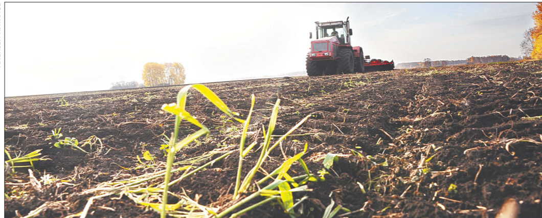
По данным министерства АПК и продовольствия области, на середину мая сев в регионе выполнен на 69,5 процента. В числе лидеров – аграрии Ирбитского МО, где уже завершили посевную кампанию

– Как только закончилась уборка урожая, растениеводы начали пахать зябь. Раньше часть полей нередко оставалась на весну, этот фактор от-