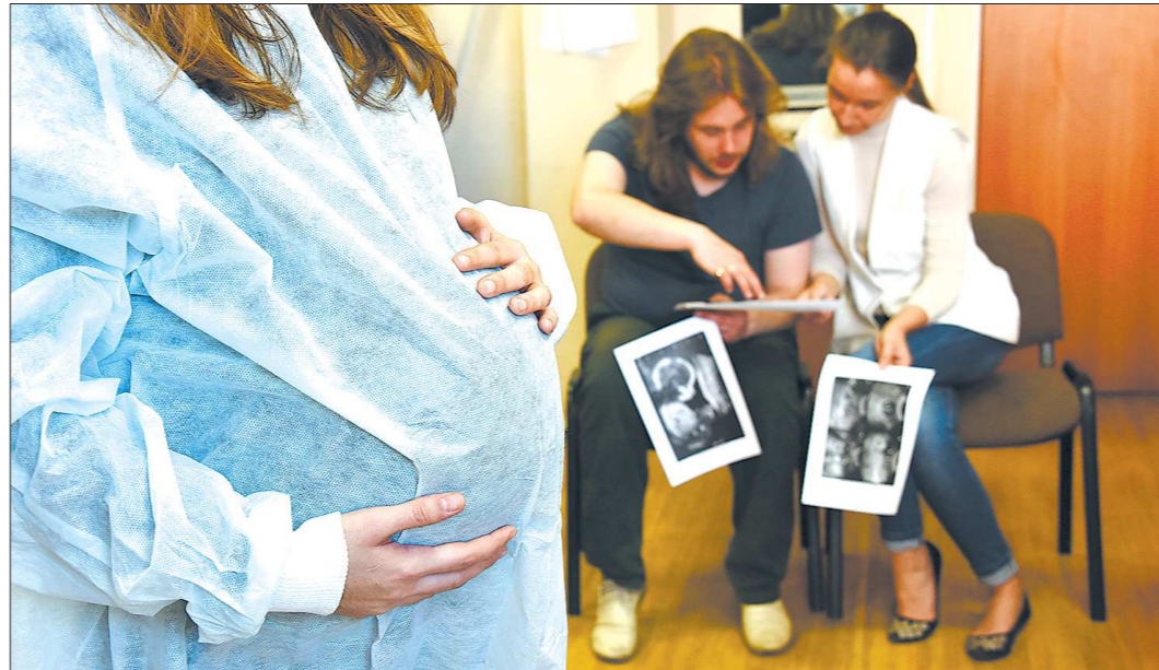
Биологические родители первоначально оговорённую сумму обычно увеличивают, если суррогатная мама родила двойню или ей сделали кесарево сечение

Супруги, которые по состоянию здоровья не могут