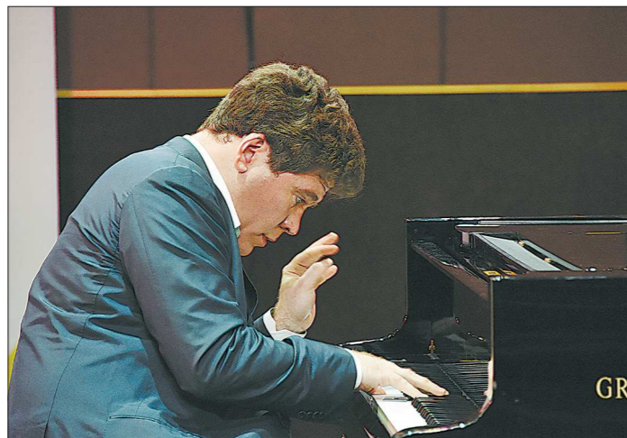
Далеко не каждому городу выпадает такая удача — фестиваль Дениса Мацуева. Это, безусловно, одно из самых ожидаемых мероприятий лета

Коляда-Plays. 20-30 июня. Из года в год Коляда-Plays — одно из самых ярких событий лета. Это уже традиционный для Екатеринбурга Международный фестиваль современной драматургии, куда съезжаются театры со всей страны и