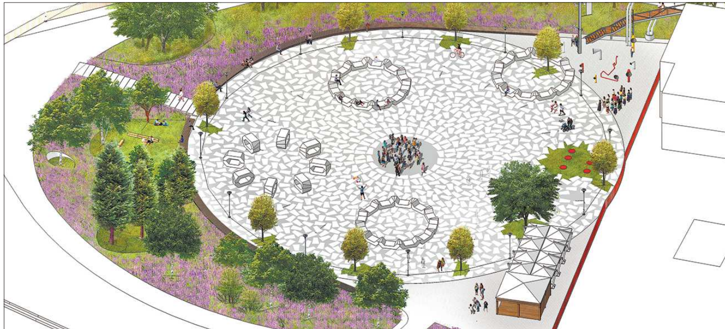
Площадь у Государственного центра современного искусства, обрмлённая по кругу длинной скамейкой, станет местом кинопоказов и фестивалей

Проект родился в рамках федеральной программы по благоустройству ключевых общественных пространств для 40 городов России. Сто-