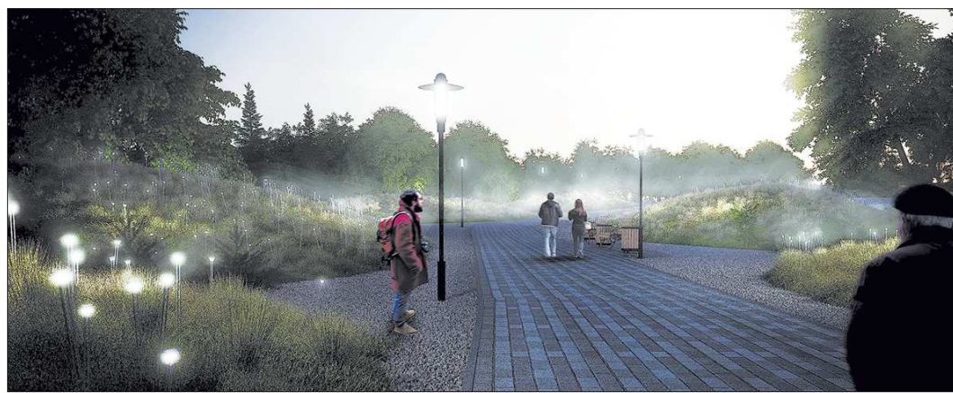
Архитекторы обещают, что гулять по набережной будет нестрашно: пешеходные зоны освещат фонари, торшеры и ландшафтная подсветка

имость реконструкции — более 400 млн рублей: половину областной центр получит из федеральной казны, остальное выделит из регионального и местного бюджетов. Авторы концепции — специалисты архитектурного бюро «ОСА» (Екатеринбург) и консалтинговой компании КБ «Стрелка» (Москва), объяснили, что характер берегов будет сохра-