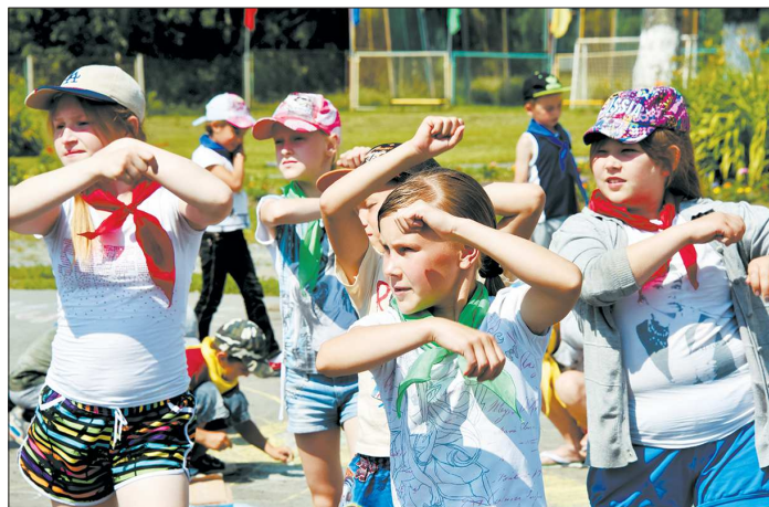
В санаторных лагерях врачи пристально следят за двигательной активностью детей — не менее часа в день

Так, только в Екатеринбурге в 2017 году отдохнуть и подлечиться в санатории смогут 4 925 школьников — почти на сто человек больше, чем в прошлом году. А в Тавде, например, этим летом детей отправят отдыхать да-