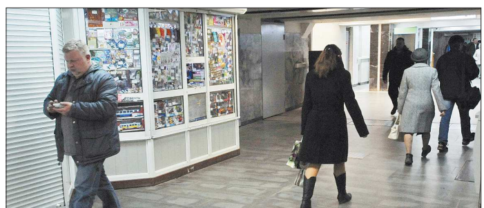
На станции метро «Проект Космонавтов» работают три киоска, где продаются канцтовары, косметика и игрушки. Ещё столько же закрыты

15 рублей за штуку, к оружию с гладкоствольным — 1 500 рублей. Травматические пистолеты и иное оружие самообороны, а также газовое оружие — 800 рублей. Перделанное самодельное оружие — 1 500. Боерприпасы к оружию с нарезным стволом —