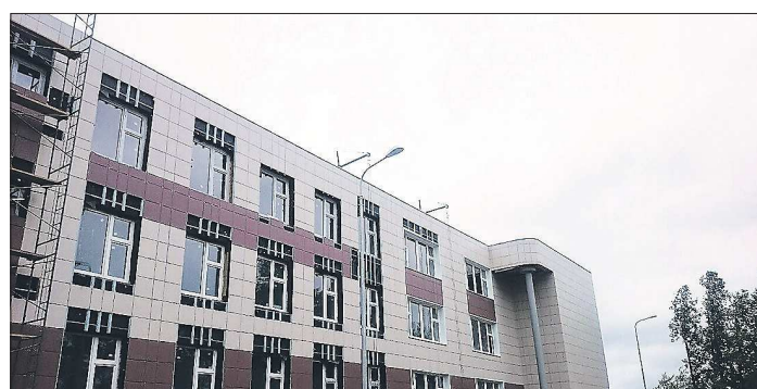
В новую школу верхнесалдинские дети пойдут 1 сентября. Памятник Пушкину вернётся на своё место позже — после реставрации

Последние штрихи нанесли строители на завершаемый объект, который с нетерпением ждут все жители Верхней Салды. Старейшая в городе Пушкинская школа получила не просто новое здание — целый комплекс корпусов и спортивный стадион. Через неделю, в День знаний, 550 учеников придут в уютную, безопасную и современно оснащённую школу №1.