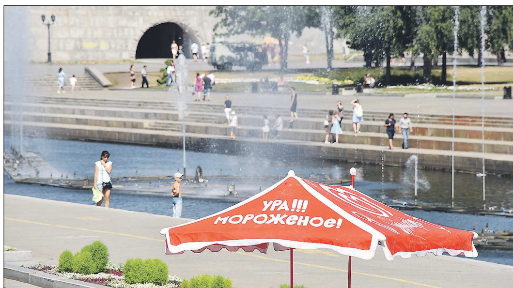
В жаркую погоду активизировались продавцы мороженого: в разных районах города заработали ранее закрытые киоски, а в центре Екатеринбурга появились дополнительные нестационарные точки торговли. В среднем продажи мороженого по сравнению с августом прошлого года выросли на четверть

Эксперты отмечают и рост спроса на новые кондиционеры. Магазины бытовой техники, увеличив на полках количество так называемой «климатической техники» (кондиционеров, сплит-систем и вентиляторов), оказались готовы к запросам горожан. По данным пресс-службы сети магазинов «М.Видео», температурные рекорды в Екатеринбурге и Свердловской области привели к небывалой динамике роста продаж климатической техники: рост продаж в штучном выражении пре-