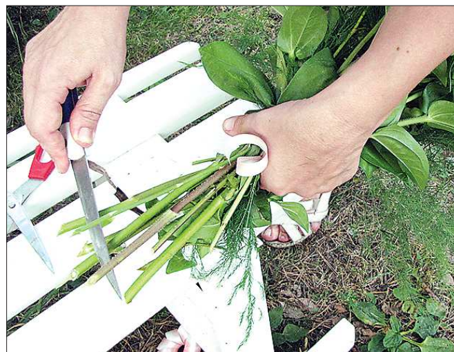
Цветы с мягким стеблем подрезают наискосок, с жёстким — расщепляют