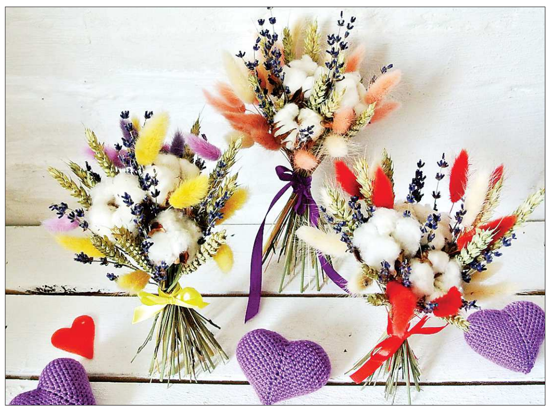
Сухие букеты разных оттенков — отличное украшение интерьера. Они достаточно неприхотливы и могут радовать глаз годами

Важно убрать с нижней части стеблей все лишние, но делать это следует аккуратно, чтобы не повредить стебли. У роз убирают не только листья, но и шипы.