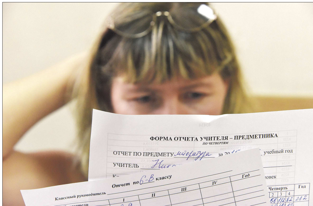
Порой из-за бюрократической нагрузки учителя не успевают готовиться к урокам

— Мы, родители, активно сотрудничаем со школами и видим, что педагоги просто задыхаются от обилия бумаг, мыслимых и немислимых отчетов обо всем — от питания до безопасности. Не случайно появились нехорошая шутка, что у учителей не остаётся времени на детей. На мой взгляд, отчётность должна быть минимальной, и вести её должны не учителя, а те, кто занимается административной деятельностью. Меня удивляет: сейчас много говорят о том, что документооборот должен быть облегчен, вся информация должна быть в электронном виде. Но можно же создавать отчёты с открытыми данными и оттуда брать информацию, а не заставлять учителей постоянно собирать какие-то цифры. Это отвлекает их от основной деятельности и в конечном итоге влияет на качество образования детей, — заявила «ОГ» ответ-