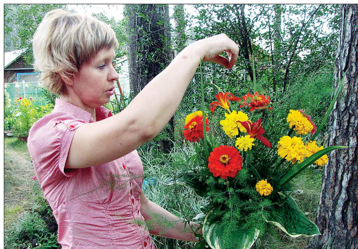
Объём композиции придадут веточки туи, не успевшей зацвести многолетней астры, узкие листья лилейника и широкие — хосты

Однолетние цветы — циннии, астры, львиный зев, календулу — можно срезать ножом подрав друг за другом, — советует флорист. — А вот у многолетних следует позаботиться. К примеру, среди гладиолусов могут находиться большие растения. Срезав цветок с большого, можно на