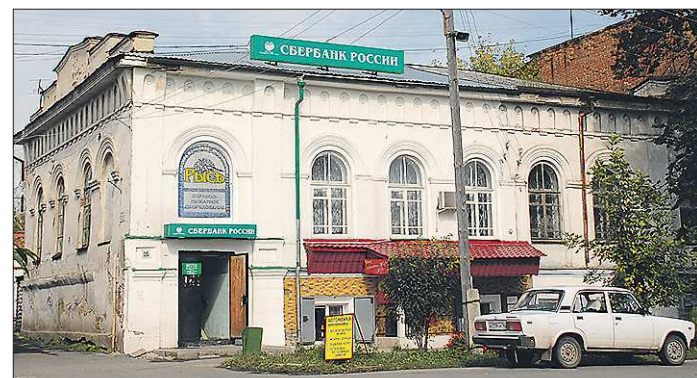
Сразу два офиса Сбербанка в Камышлове попали под определение «несоответствующие стандартам банковского сервиса». Теперь в городе останется только три помещения

На продажу выставили семь офисов в Екатеринбурге, по три офиса в Качканаре, Нижнем Тагиле и Нижней Туре, по два — в Камышлове,