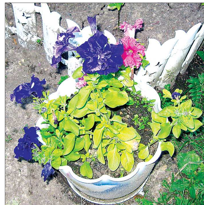
Лучше всего петунью высаживать и выставлять на улицу прямо в кашпо — тогда перед заморозками цветок не придётся спешно выкапывать