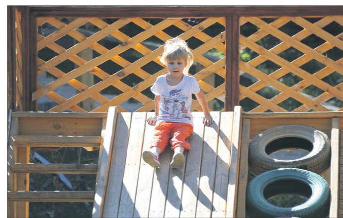
Журналисты «ОГ» взяли с собой детей, чтобы те и отдохнули, и к профессии приобщались

В самом деле, прошло уже 25 лет (кстати, в редакции есть и журналисты-ровесники тех событий), а так до сих пор и не совсем ясно – что это было? Попытка спасти советскую империю? Прорыв в светлое капиталистическое будущее? Блестящая операция ЦРУ по развалу «империи зла»? После отмены шестой статьи Конституции СССР, которая закрепляла монополию КПСС на власть в стране, изменилась и жизнь всех СМИ, которыми тогда рулила партия. Как мы развивались, как распорядились внезапно обретенной свободой? Что обрели, что потеряли? Эти темы и стали предме-