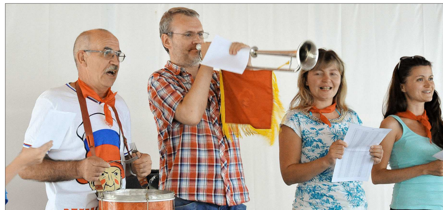
Какое же возвращение в СССР без пионерской линейки и задорных речёвочек?