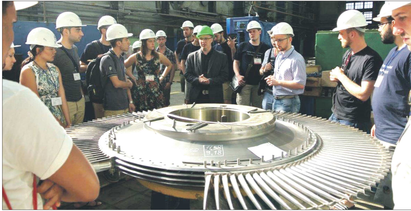
Слушатели летней энергетической школы знакомятся с Уральским турбинным заводом

В школу отобраны по 20 студентов-старшекурсников из УрФУ и Берлинского технического университета. Ныне,