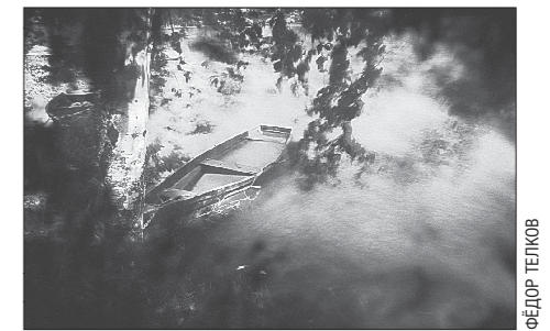
Фотография из проекта «Сказы», сделанная в городе Нижние Серги

Фотограф Фёдор Телков и куратор выставки Женя Чайка работают над проектом «Сказы» с 2013 года. Проект развивался в трёх направлениях: мифология башкир и манси, произведение Павла Бажова и заводская культура – это основа проекта, в которой заложены главные образы уральской идентичности. На основе богатейшего культурного, исторического и экспедиционного материала авторы проекта пытаются создать новый образ региона.