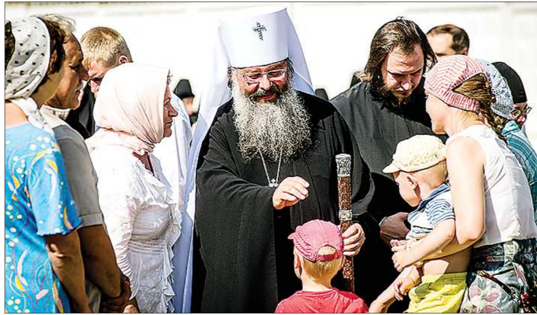
По словам владыки, в области еженедельно проводятся различные мероприятия духовной тематики — у людей к ним неуклонный интерес

— В митрополии действует одна духовная семинария. Нам удалось перевести её из приспособленного помещения детского сада в более обустроенное место, возле Троицкого кафедрального собора. Но всё равно помещение пока далеко даже от дореволюционного уровня. Действует учреждение высшего образования «Миссионерский институт». Оно уникально для России, здесь жители региона на бесплатной основе получают высшее теологическое образование. К сожалению, и это образовательное учреждение вынуждено арендовать учебные площади. Нам удалось открыть две православные гимназии — в Екатеринбургском и в Нижнем Тагиле. Мы не говорим уже о воскресных школах — новые открываются практически ежемесячно. Сегодня их уже более 230. У нас даже действует специальное образовательное учреждение по подготовке педагогов воскресных школ — «Учительская семинария». Около 150 слушателей сегодня учатся там.