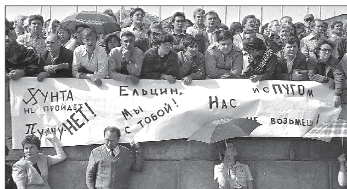
Участники митинга с плакатами, требующими отставки губернатора.