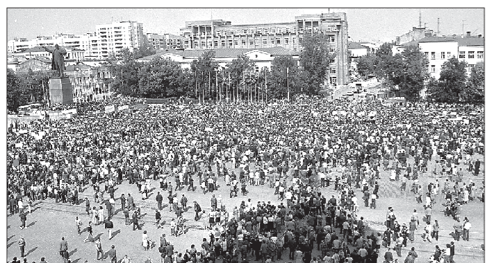
21 августа на площади 1905 года прошёл митинг, в котором участвовали десятки тысяч человек, МВД констатировало отсутствие протестов в Свердловске и объявило стачку благодарности за это