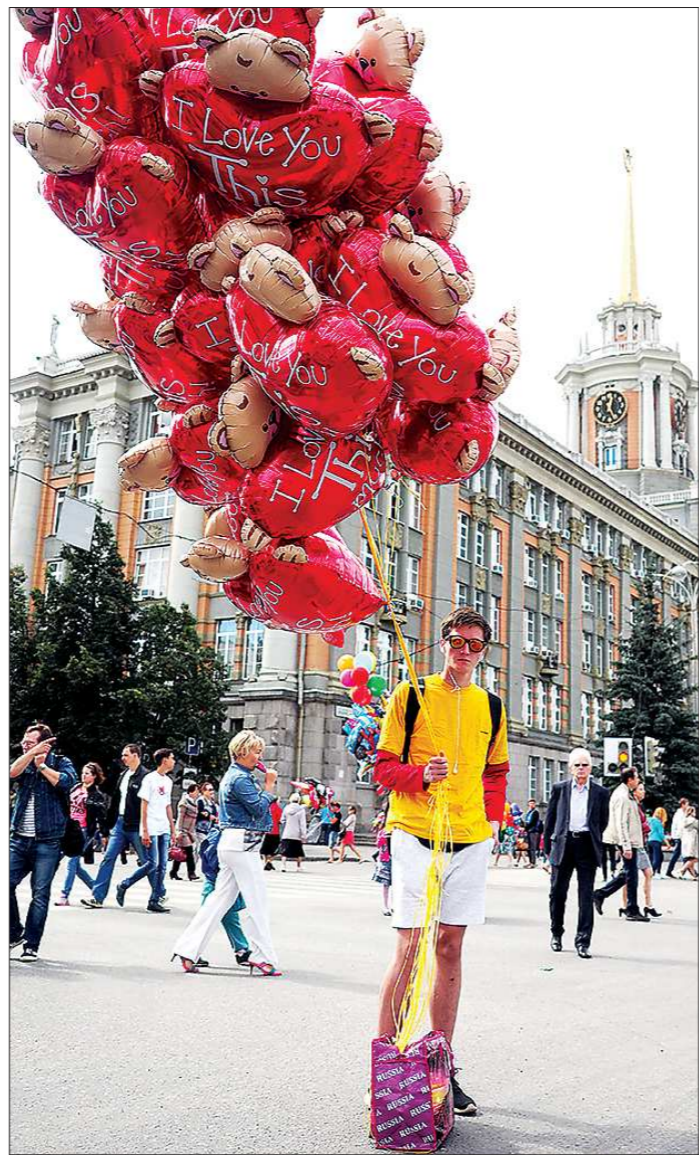
День рождения города становится настоящим праздником не только для горожан, но и для жителей области, которые приезжают в уральскую столицу на прогулку и праздничный салют

22:30 Праздничный фейерверк (акватория городского пруда)