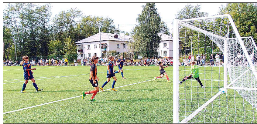
Первый гол на поле Шатова забил юный футболист «Спутника» в ворота «Высокогорца». Победа в товарищеском матче тоже осталась за ними