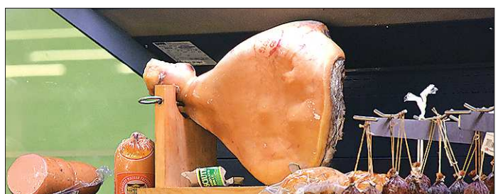
Санкционный окорок с прилавков исчез, а вот отечественный из-за снижения покупательского спроса — залеживается