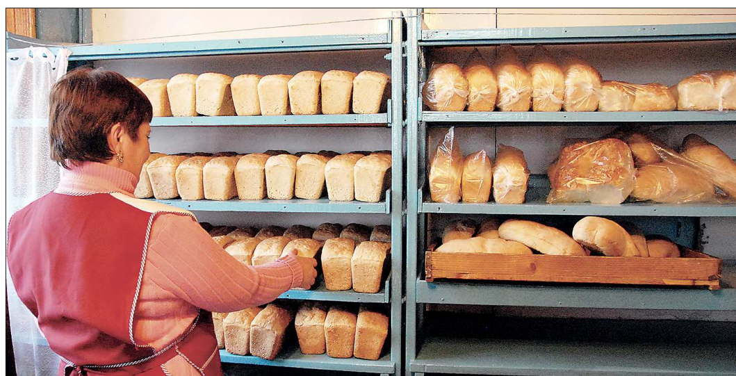
От ухода с рынка слабых игроков потребители не пострадают — полки в магазинах займут более активные хлебопечки

Эксперты из Росийского союза пекарей называют несколько причин плачевного положения хлебопекарей. Например, формирование цен на хлебобулочные изделия не отвечает рыночным механизмам — цены на муку, сырьё, упаковочные материалы растут, а хлеб в магазинах так же дорожает не может, так как это социальный продукт. Мешают и борются с хлебопечками — организации розничной торговли сдирают от миллиона рублей в месяц за маркетинговые, логистические и другие услуги (обязательные, если хочешь увидеть свой товар на витринах). В итоге рентабельность многих предприятий составляет 1 процент и меньше.