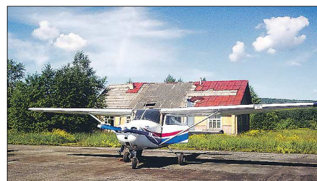
В полную силу аэродром в Красноуфимске уже давно не функционирует, но на его ВПП периодически приземляются пилоты на небольших частных самолётах