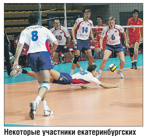
Некоторые участники екатеринбургских матчей 2006 года выступают за нашу сборную до сих пор. Например, Сергей Тетюхин (№ 8). Сегодня ночью он нёс флаг России на церемонии открытия Олимпиады в Рио-де-Жанейро

За отличную организацию тех матчей Екатеринбург впоследствии получил бонус: в 2010 году столице области были отданы одни из самых топовых в мировом волейболе поединков — Россия — США.