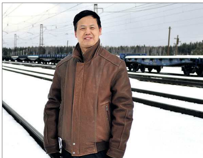
Тянь Юнсян побывал во многих точках Свердловской области. На первом фото он запечатлён на железнодорожной станции в Верхней Туре, на втором — во время встречи с ветеранами 9 Мая в Екатеринбурге, на третьем — при посещении Уралхиммаша, на четвертом — держит золотой слиток на комбинате Уралэлектромедь

Губернатор Свердловской области Евгений КУЙВАШЕВ