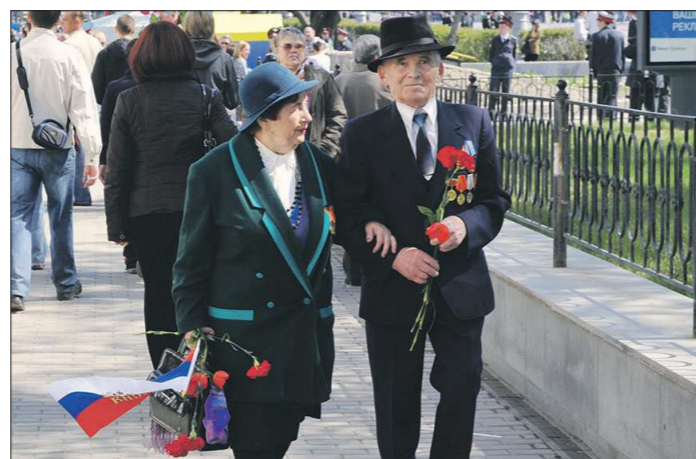
Программа «Сила Урала» направлена на улучшение качества жизни свердловчан, в том числе — представителей старшего поколения

— Мы создали комитет — общественный орган нашего округа, куда вошли ветеранские общественные организации, а также организации,