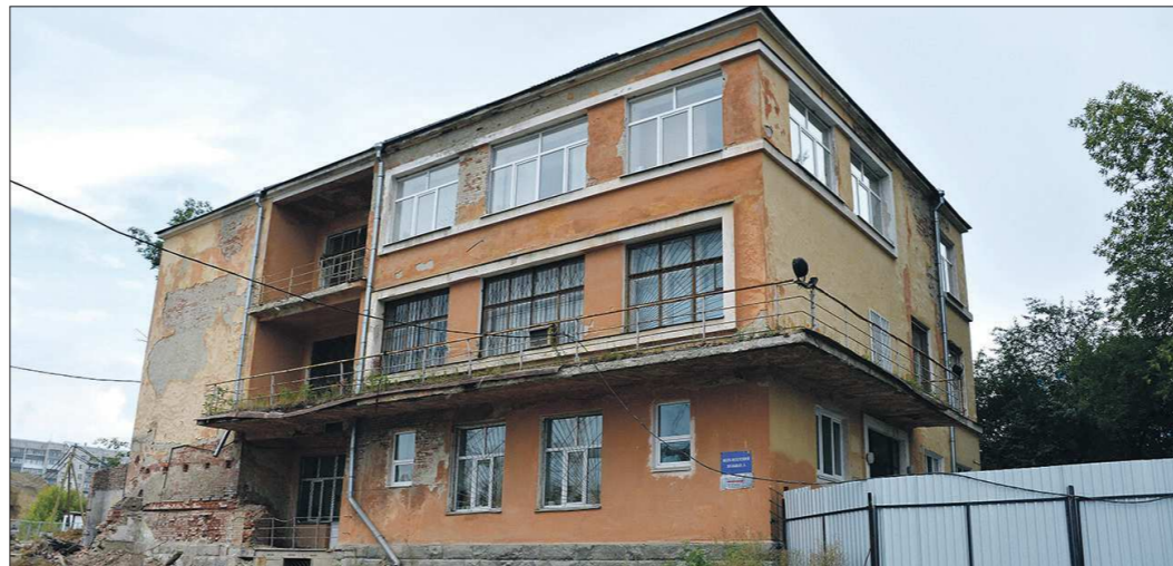
Состояние фасада здания поликлиники Минобороны РФ оставляет желать лучшего. Но пока оно в федеральной собственности, ни область, ни город не могут взяться за его восстановление

Сегодня недостроен за основным корпусом НИИ ОММ и зданием консультативно-диагностической поликлиники Военного клинического госпиталя на улице Репина находится в федеральной собственности. Ни область, ни город по закону не имеют права участвовать в их развитии, благоустройстве, проведении ремонтных и реставрационных работ. Вот и получается, что таким объектам остается только сиротливо наблюдать за тем, как стремительно меняется облик города, а самим в этом преобразовании не участвовать. Интерес первого вице-премьера Игоря Шувалова, который посетил Екатеринбург с рабочим визитом, к этим объектам закономерен — российский Президент Владимир Путин ранее поддержал планы региональных властей о создании в районе Академической медицинского кластера на базе НИИ ОММ