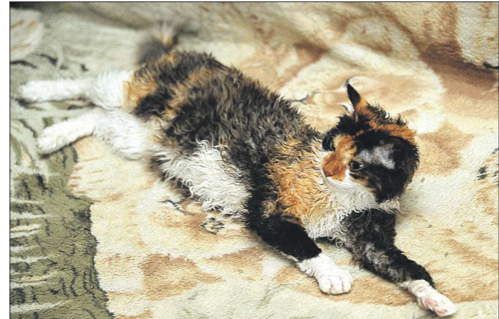
В мире насчитывается не более 400 Уральских рексов, больше всего питомников (пять) — в Екатеринбурге, а за границей эту породу разводят только в Германии. Средняя цена котёнка — 20 тысяч рублей

Есть мнение, что на мутацию повлияло излучение от Белоярской атомной электростанции, которая расположена в Заречном. Однако это — заблуждение, в городе атомщиков строго следят за тем, чтобы радиационный фон был в норме. По словам заводчицы, подобных кошек геологи видели во время своих экспедиций по берегам ре-