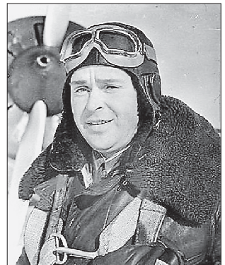
Владимир Курочкин получил звание Героя Советского Союза ещё до начала Великой Отечественной войны

* «Чайкой» называли советский поршневого истребитель И-153.