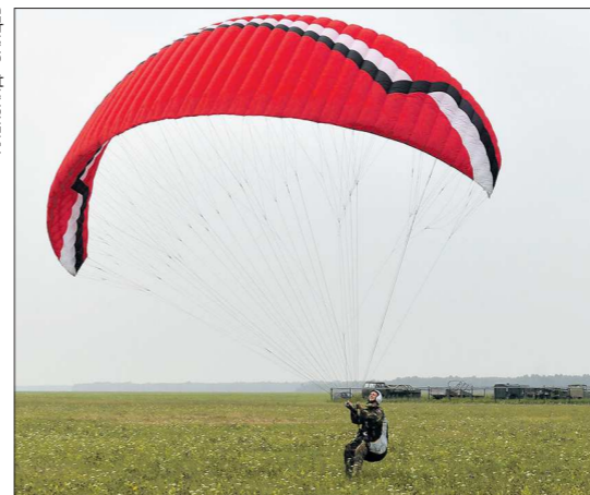
Условия для полётов малой авиации диктует погода. На фестивале «Крылья Урала» ветер силой 8 м/с для аэростата (на фото слева) был слишком сильным, купол чуть не сдуло. Зато парашютисты (на фото справа) с лёгкостью поднимали свои крылья, а частные самолёты (в центре) этот ветер вообще не заметили

от 85 до 150 тысяч рублей, по итогам выдаётся пилотское удостоверение международного образца.