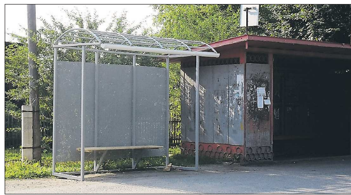
Монтажники ещё не успели установить крышу и стены на павильонах, а салдинцы уже устроили разное новым конструкциям. Однако и старые их не устраивают: в них всегда мусорно и пахуче