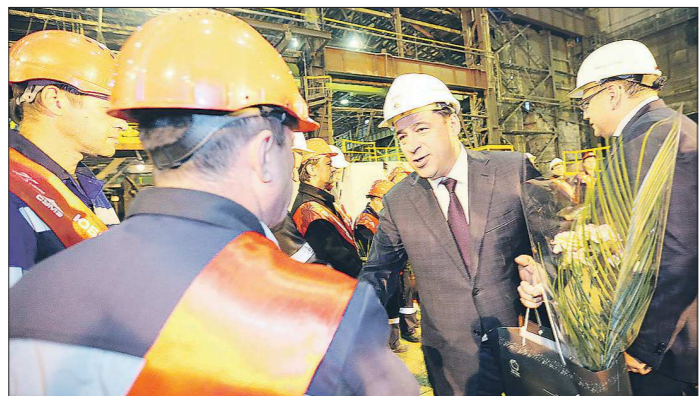
Евгений Куйвашев — частый гость на металлургических предприятиях Свердловской области

Завтра, 17 июля, День металлурга. Уважаемые металлурги и ветераны отрасли! Поздравляю вас с профессиональным праздником!