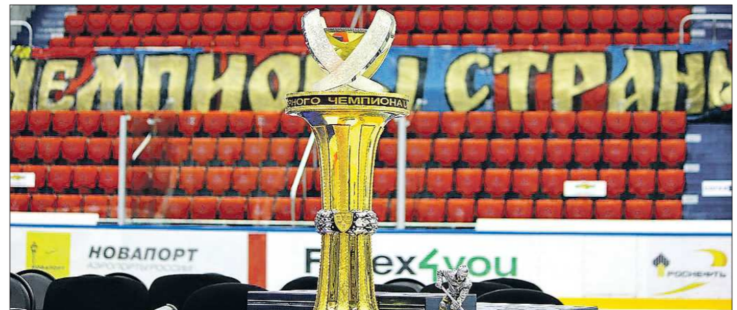
Так выглядит кубок, который вручают команде — чемпиону России. Последний раз по «старой» системе его выиграл московский ЦСКА в сезоне в 2014/15, но уже в полуфинале плей-офф чемпионы России проиграли «Металлургу»

Внимательные болельщики, наверняка, задали себе во-