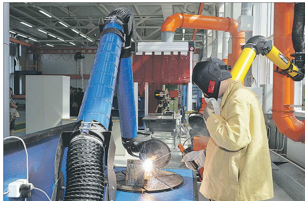
В центре будут готовить по таким специальностям, как металлургия чёрных металлов, обработка металлов давлением, мехатроника, сварочное производство, токарные и фрезерные работы

В первом классе гостей приветствует робот Мехатроник и кивает на стенд с учеб-