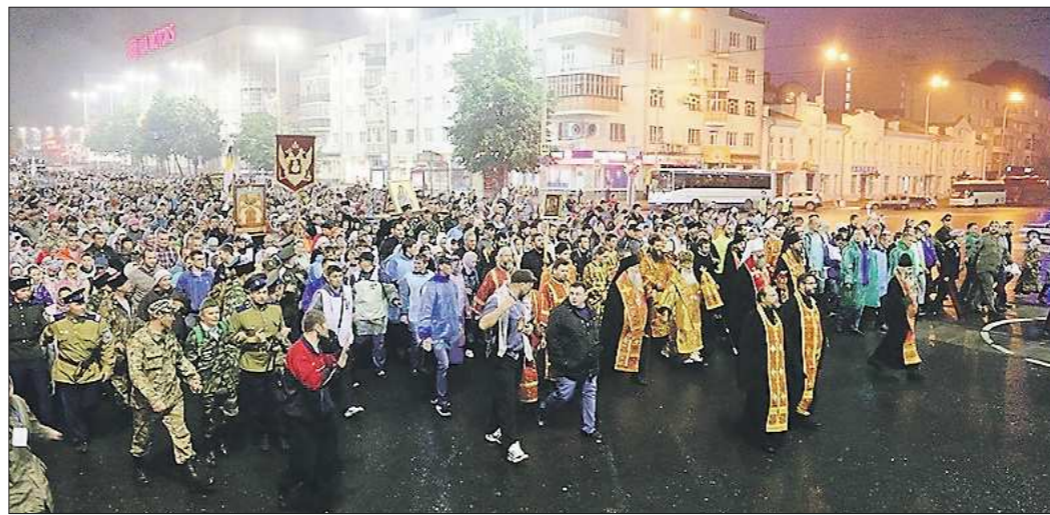
Год назад крестным ходом от Храма-на-Крови до Ганиной Ямы прошли 60 тысяч верующих

Всю неделю Царских дней будут идти торжественные богослужения в Храме-на-Крови. Но кроме этого, в программе фестиваля — много интересных событий: концерты, лекции, ярмарки, встречи. Побывать на них можно всем, кто пожелает, аб-