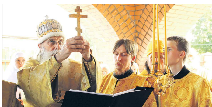
Митрополит Корнилий освящает старообрядческие храмы Уральской епархии, поскольку здесь нет своего епископа