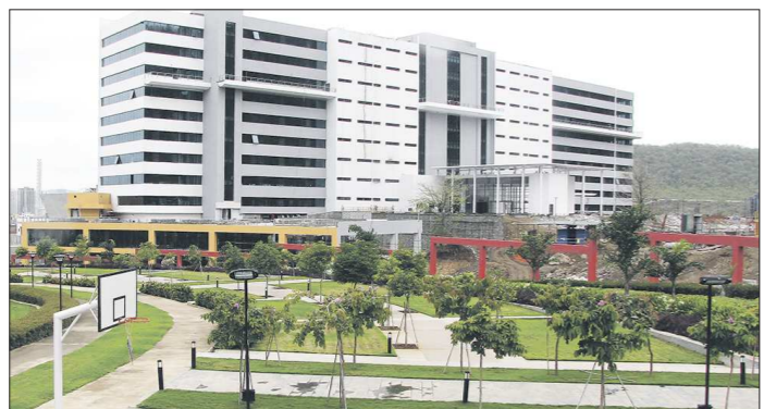
Для сотрудников технопарка есть отдельная парковка, несколько вместительных кафе и спортивная площадка с трибунами

● УНИВЕРСИТЕТЫ В ТЕХНОПАРКАХ. Когда на Урале только начали говорить об индустриальных парках и особых экономических зонах, в Махараштре они уже вовсю