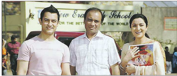
Кадр из фильма «Звёздочки на земле». В главных роли — один из самых известных сегодня актёров Индии — Аамир Кхан (слева)