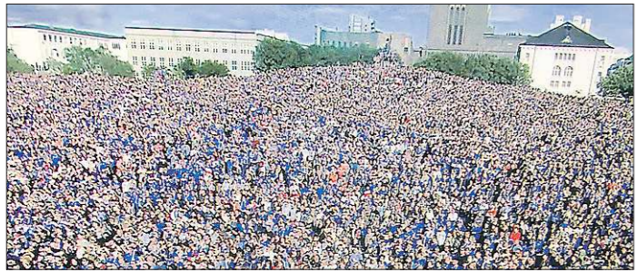
Около 15 процентов населения Исландии были на стадионе в Сен-Дени. Остальные собрались поддержать свою команду на площади в Рейкьявике