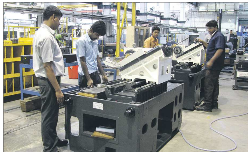
Завод станкостроительной компании «Ace Designers limited» состоит из двух цехов: в этом оборудовании собирают, в следующем — тестируют на качество. Все сотрудники здесь — индийцы. Иностранцев специалистов к работе не привлекают